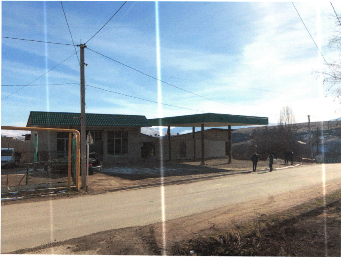
სურათი 1. ბენზიგასამართი სადგურის არსებული ხედი

საწვავმარიგებელი სვეტები პროექტის მიხედვით დამონტაჟებული იქნება ავტოგასამართი სადგურის გადახურული ფარდულის ქვეშ და დაკავშირებული თანამედროვე პლასტიკის მილებით საწვავის ავზთან.