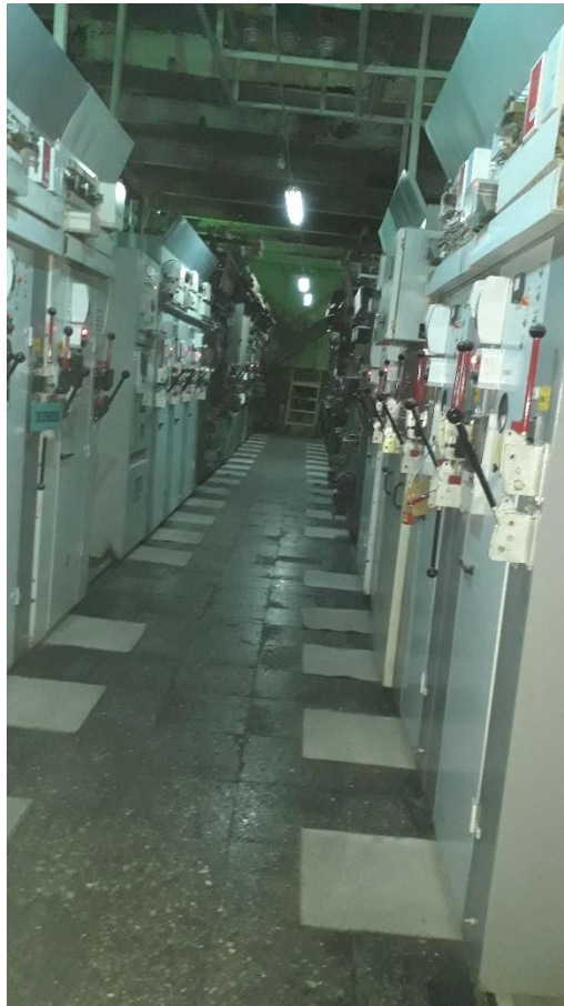
რუსთავის ცემენტის ქარხნის ქვესადგურის ნკვ დახურული გამანაწილებელი მოწყობილობა

ძირითადი მონაცემები ქვესადგურის საქმიანობის შესახებ მოყვანილია ქვემოთ ცხრილში 2.1.1.