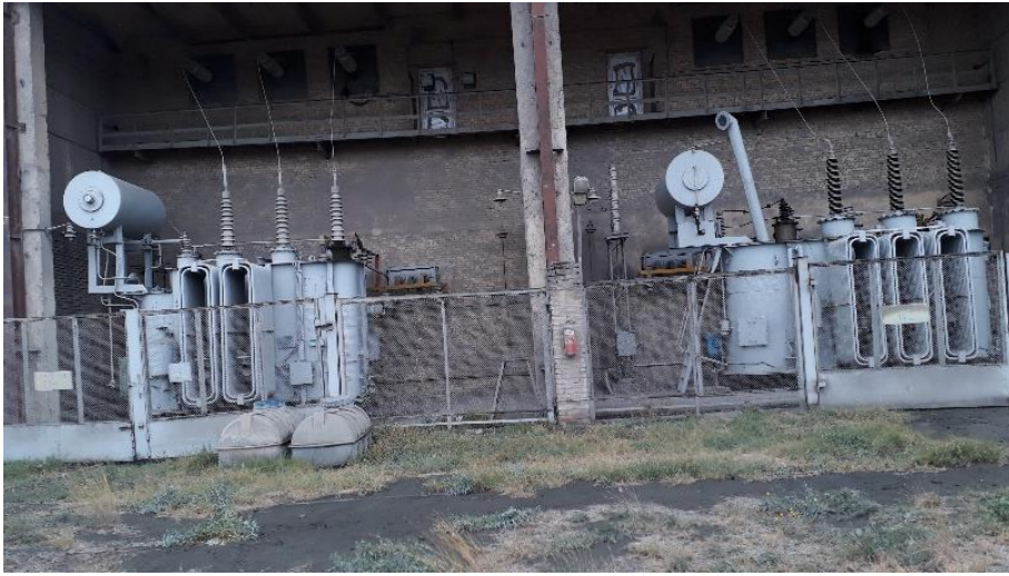
რუსთავის ცემენტის ქარხნის ქვესადგურის ორ ტრანსფორმატორიანი (25 მვა და 16 მვა) ღია გამანაწილებელი მოწყობილობა