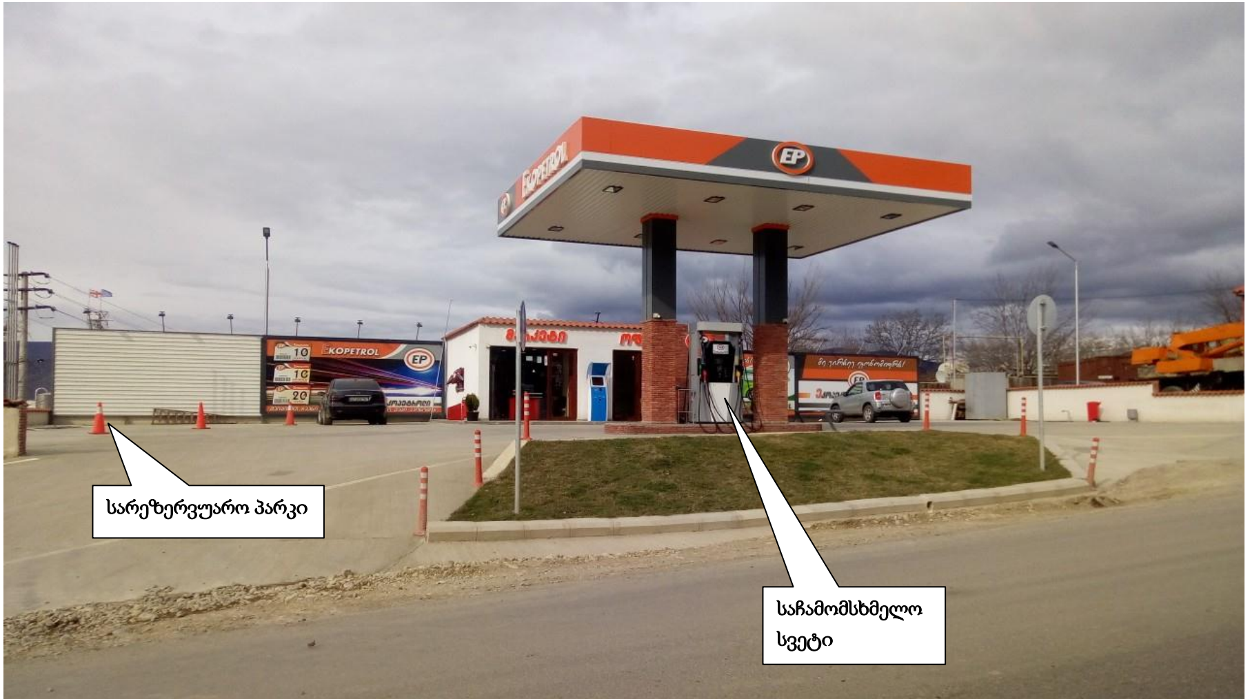
სურათი 1. აგს-ის ხედი საავტომობილო გზის მხრიდან