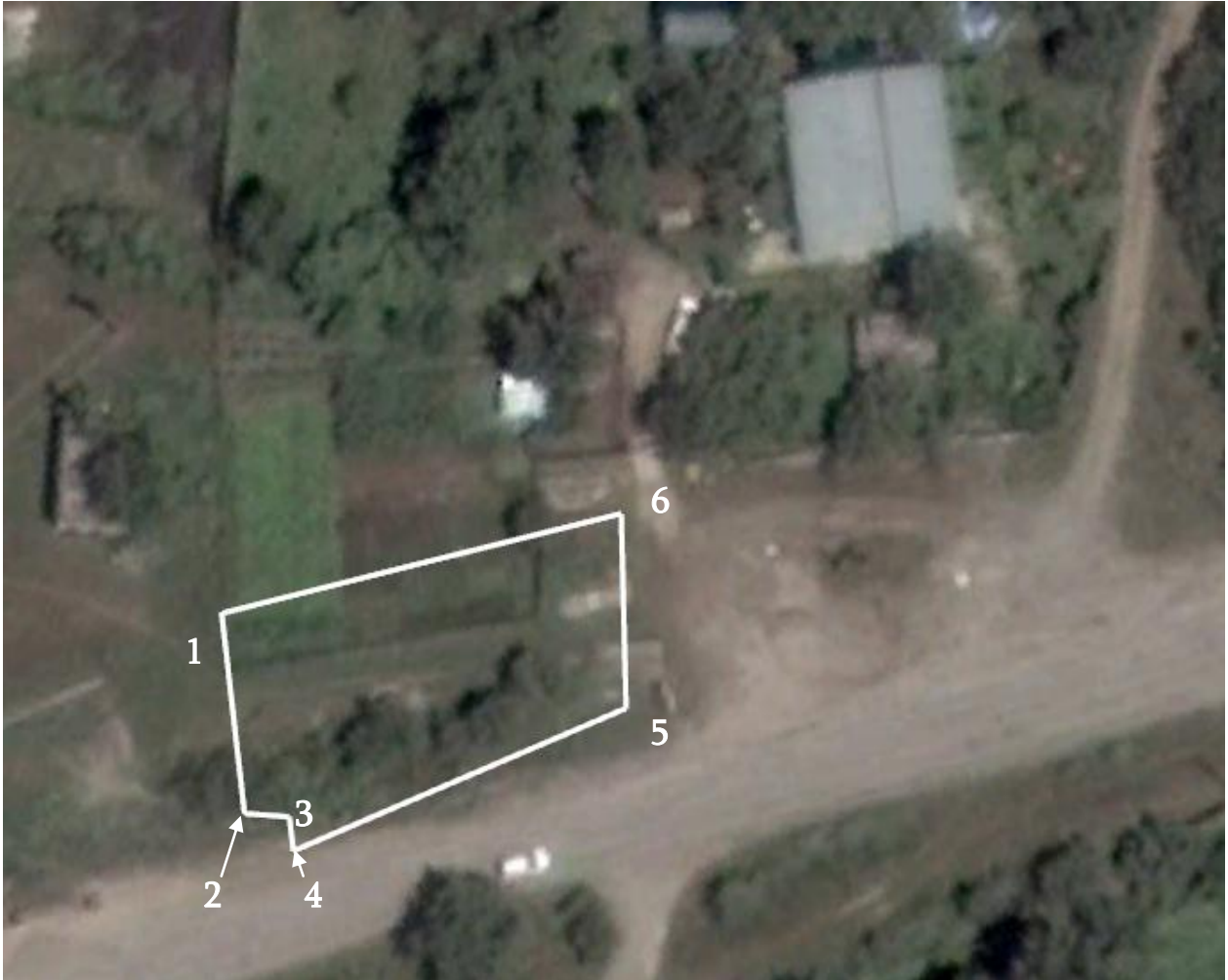
ნახაზი 2. ტერიტორიის კუთხეთა წვეროები.