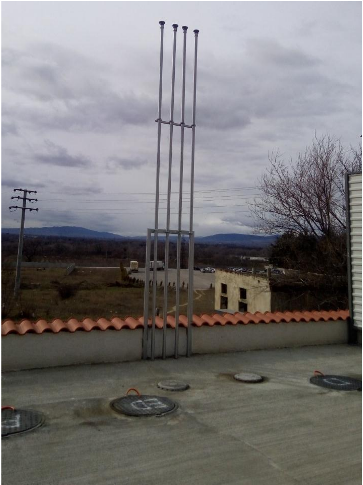
სურათი 3. ავზების დამცავი სარქველები