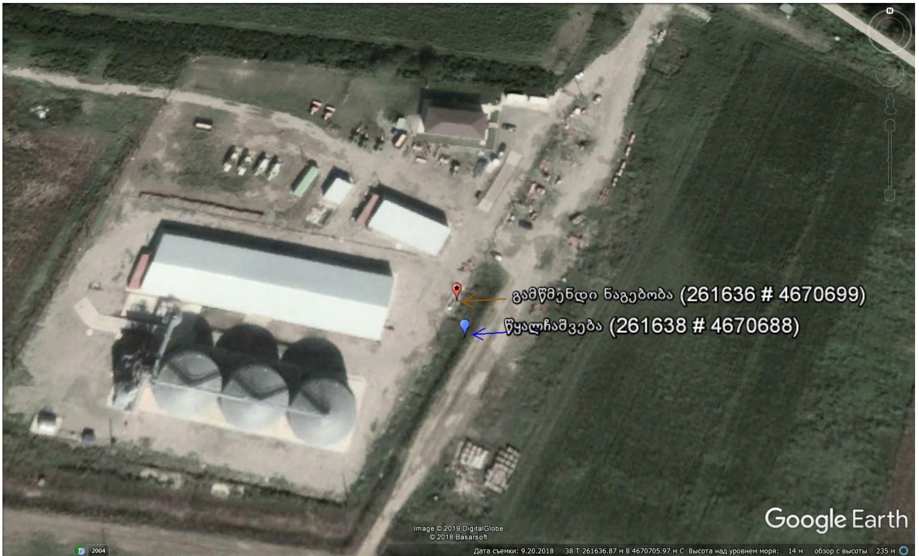
სურ.#4 - გამწმენდი ნაგებობა და ჩაშვების წერტილი