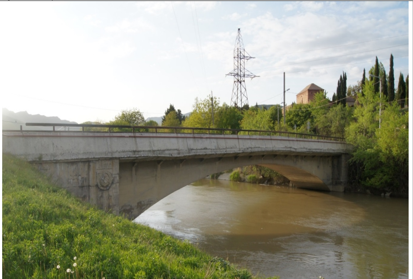
სურათი 1- არსებული ხიდი

მოცემული ხიდის პროექტი დამუშავებულია საქართველოში მოქმედი სამშენებლო ნორმების შესაბამისად.