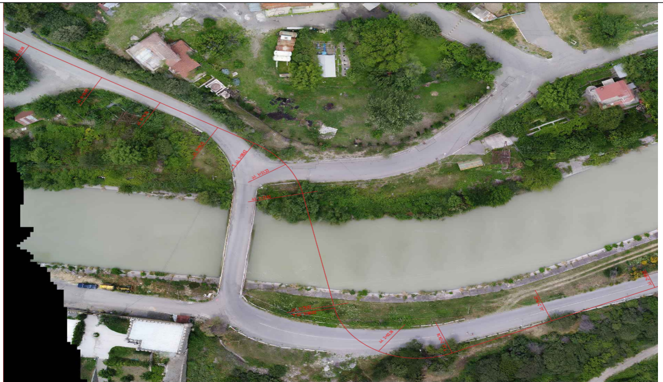
სურ.2_საპროექტო ხიდის ადგილმდებარეობა მოცემულია ქვემოთ სურათზე.

ვიზუალურად, განაპირა ბურჯები მასიური გრავიტაციული ტიპისაა, რომელიც გრუნტის და ტრანსპორტის მოძრაობით გამოწვეულ დატვირთვებს საკუთარი მასით უწევს წინაღობას.