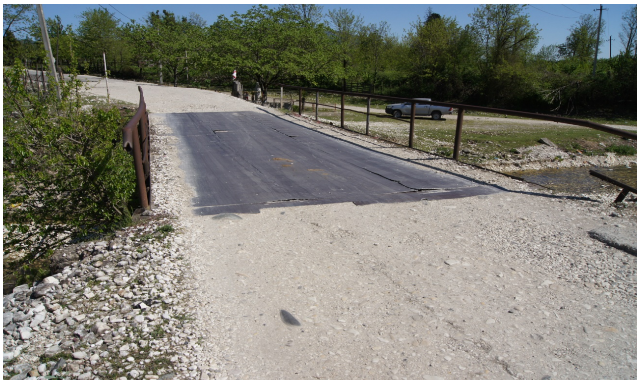
სურ. 2 არსებული ხიდი