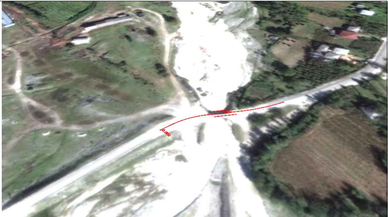
სურ_1_საპროექტო სიტუაციური სურათი

პროექტს ახორციელებს საქართველოს რეგიონული განვითარების და ინფრასტრუქტურის სამინისტროს საავტომობილო გზების დეპარტამენტი.