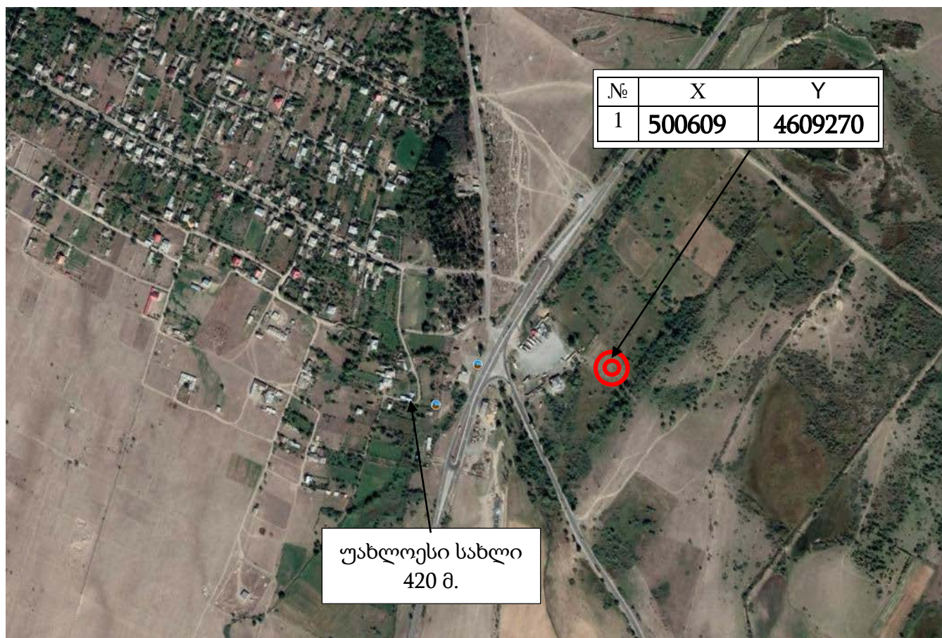
ნახ.1 შპს „ქართული ცემენტი“-ს ცემენტის საწარმო. მაშ. 1:10000.

შპს „ქართული ცემენტი 2020“-ს საწარმო განლაგდება გარდაბნის მუნიციპალიტეტში, სოფ. გამარჯვების ტერიტორიაზე. მანძილი ცემენტის ქარხნიდან უახლოეს საცხოვრებელ სახლამდე 0,42 კილომეტრია.