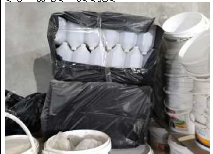
სურათი 7. საღებავების პლასტმასის ჭურჭელი.