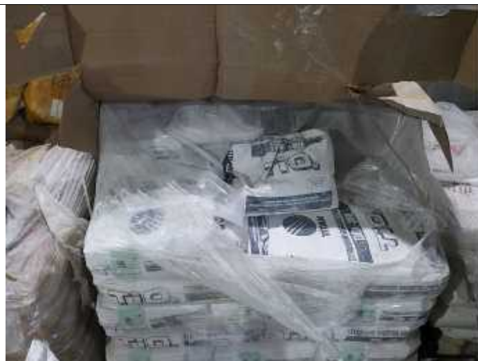
სურათი 4. ტომრებში დაფასოვებული ნედლეული.