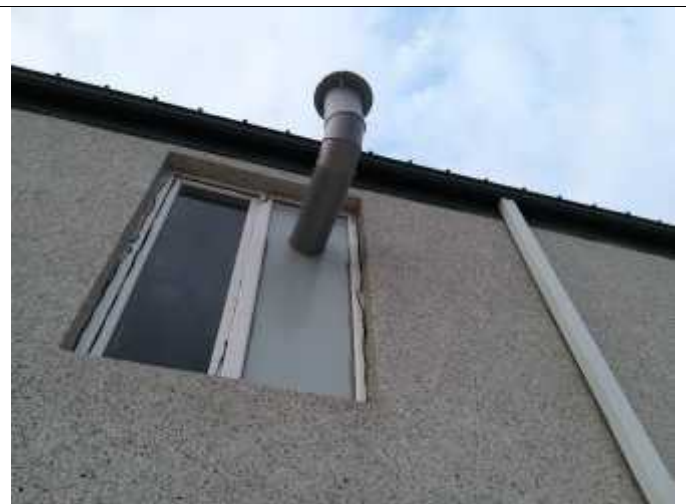
სურათი 1. გამწოვი მილი.