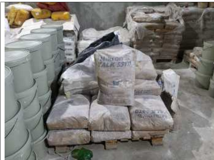
სურათი 3. ნედლეულის საწყობი.