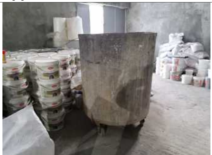
სურათი 8. პროდუქციის დასაწყობების ტერიტორია.