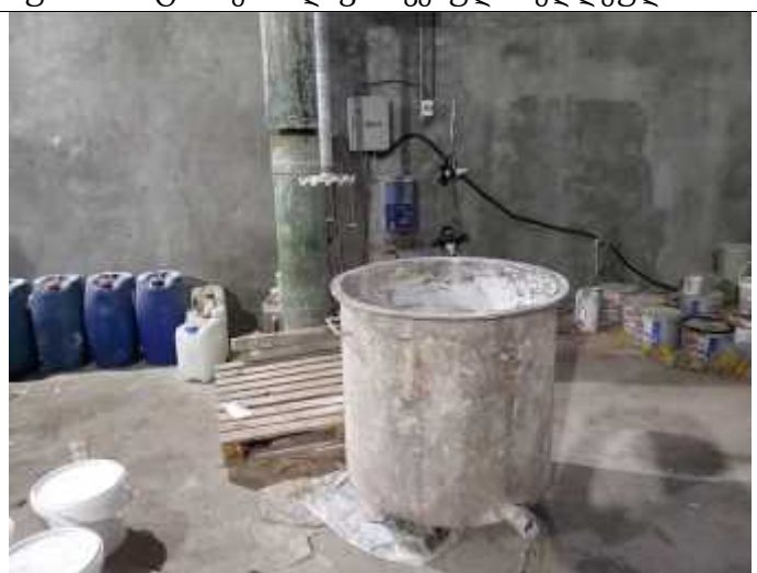
სურათი 6. წყალში ხსნადი საღებავების ამრევი მიქსერი.