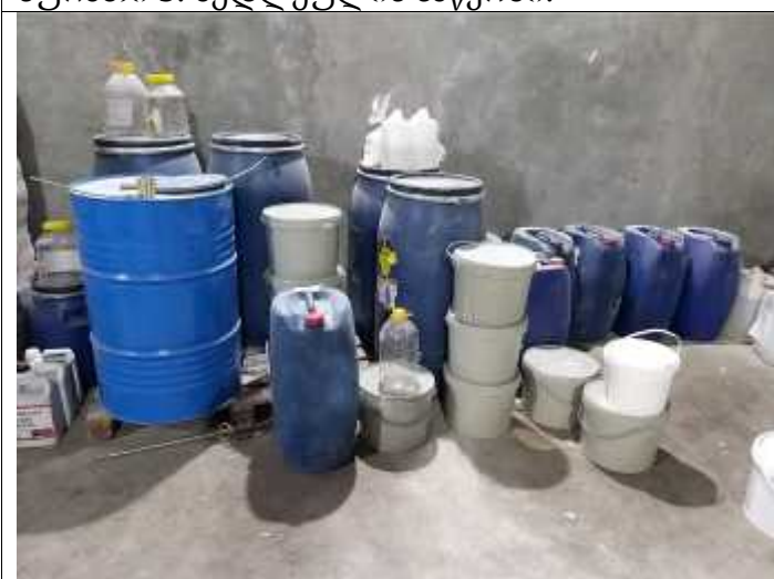
სურათი 5. პლასტმასის ჭურჭელში დაფასოვებული ნედლეული.