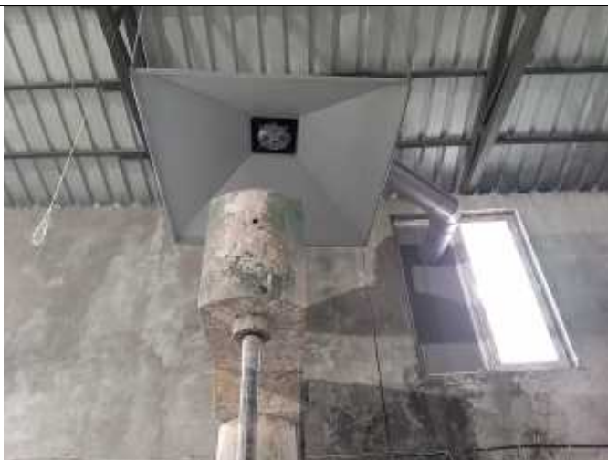
სურათი 1. გამწოვი ქოლგა.