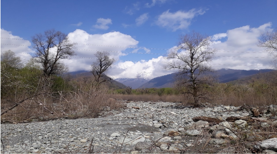
ფოტო 1. ჭარბი აკუმულაციის მასალით გადავსებული მდ. შრომისხევის კალაპოტი