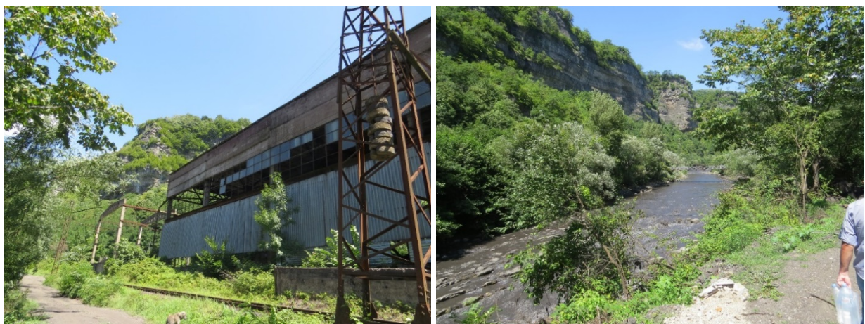
სურათი 2.3. საწარმოს შენობის და მიმდებარე ტერიტორიის ხედები