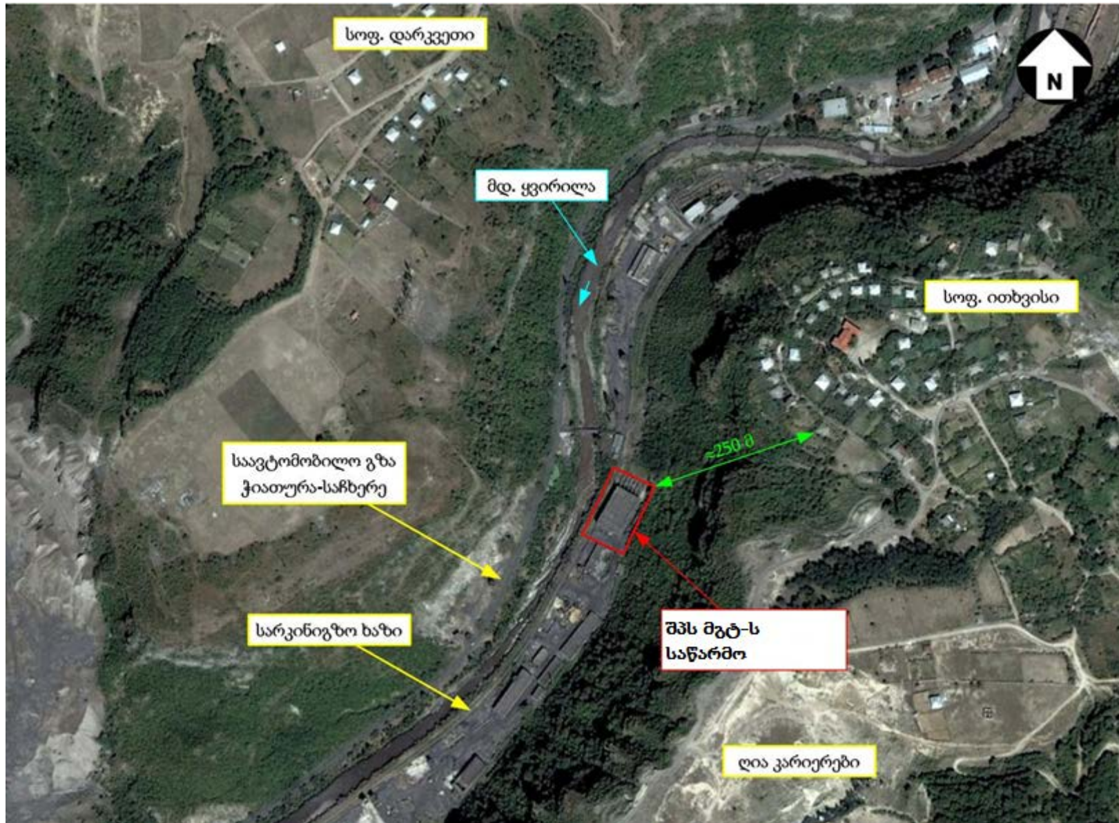
სურათი 2.1. საწარმოს განთავსების არეალის სიტუაციური ნახაზი