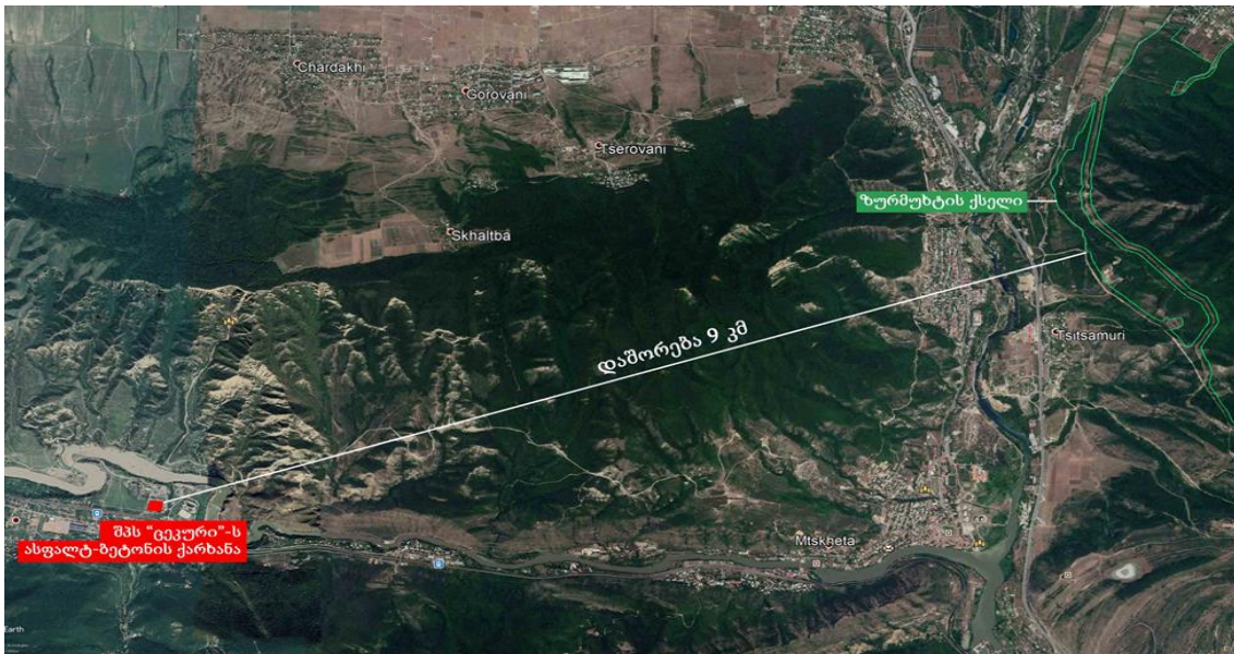
სურათი 3.1 შპს ცეკური“-ს და ზურმუხტის ქსელის დამტკიცებული საიტის „საგურამო“ (GE0000047) ურთიერთგანლაგების სქემა