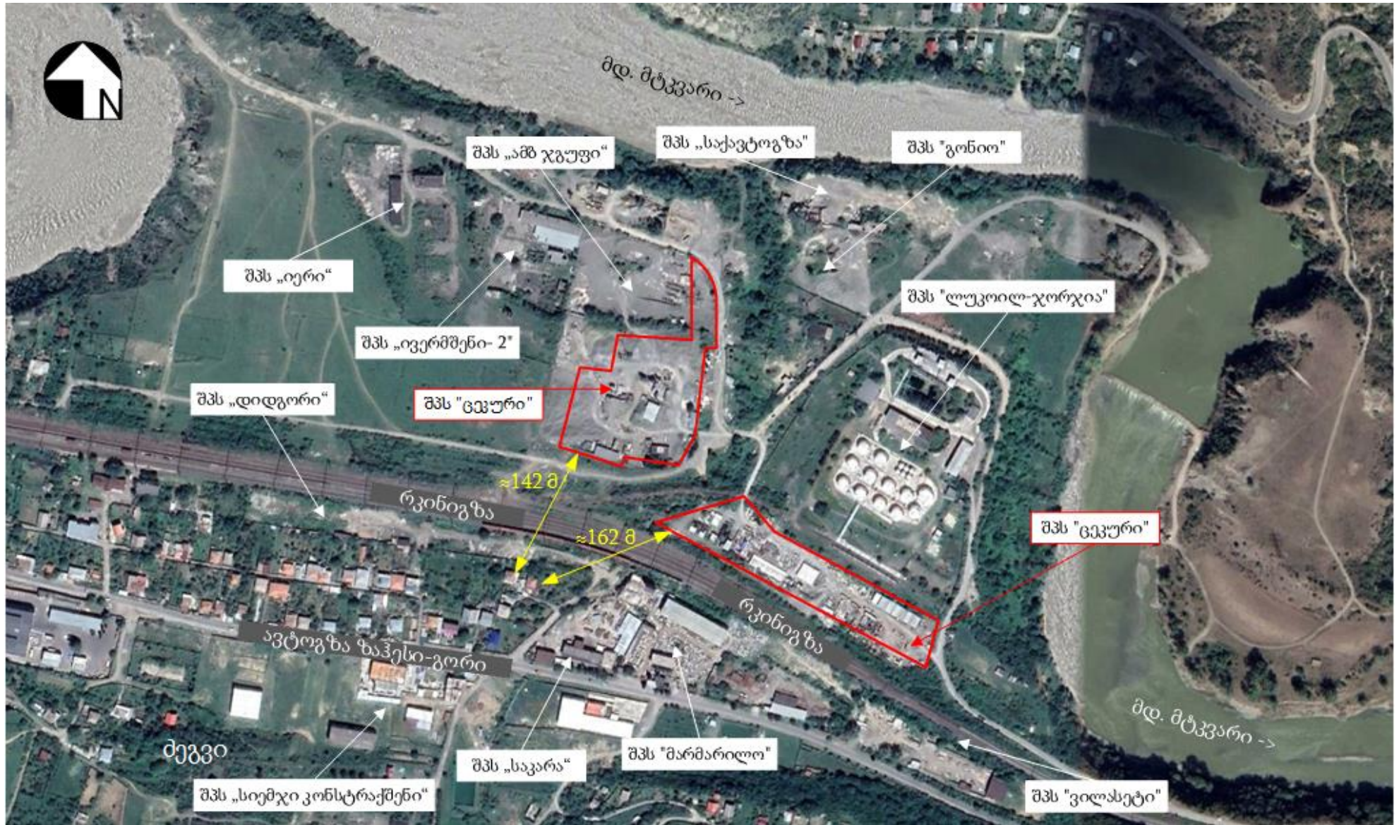
სურათი 2.1.1. ტერიტორიის სიტუაციური სქემა