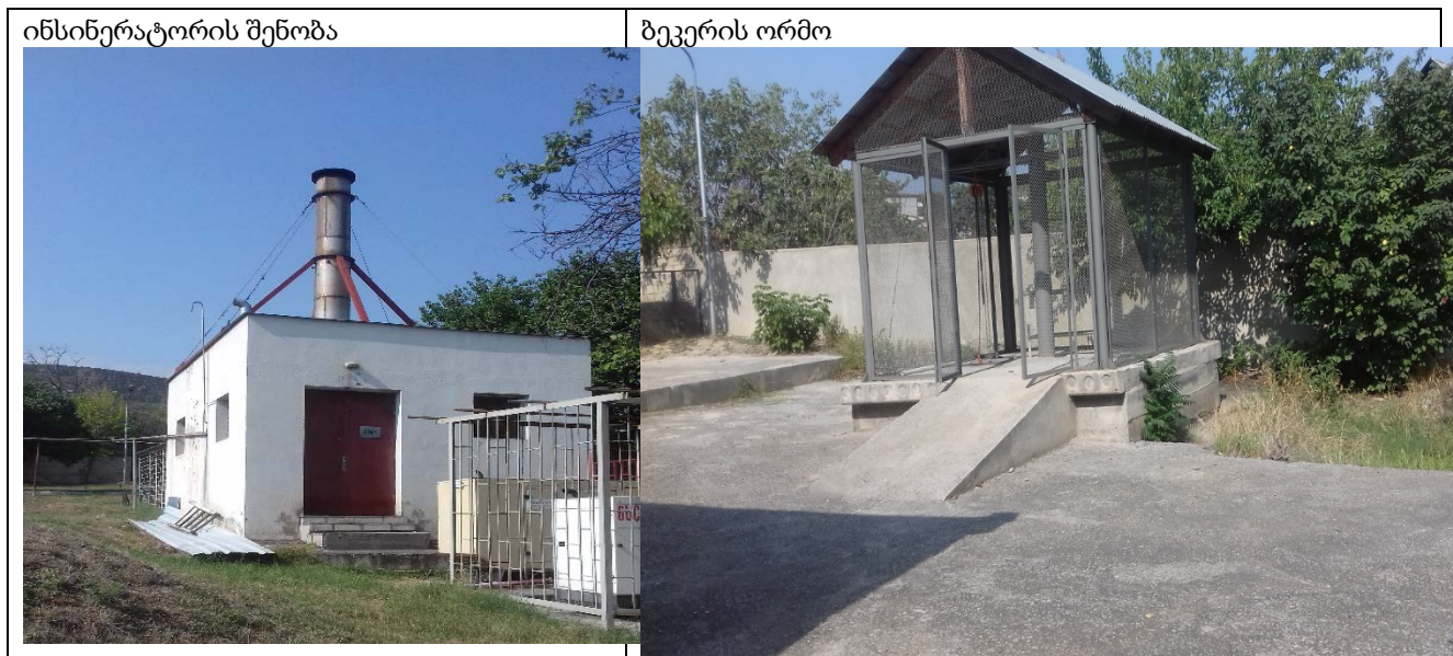
სურათი 2.2.1. ინსინერაციის შენობის და ბეკერის ორმოს ფოტო-მასალა

ინსინერაციის შენობის და ბეკერის ორმოს ფოტო-მასალა მოცემულია 2.2.1 სურათზე.