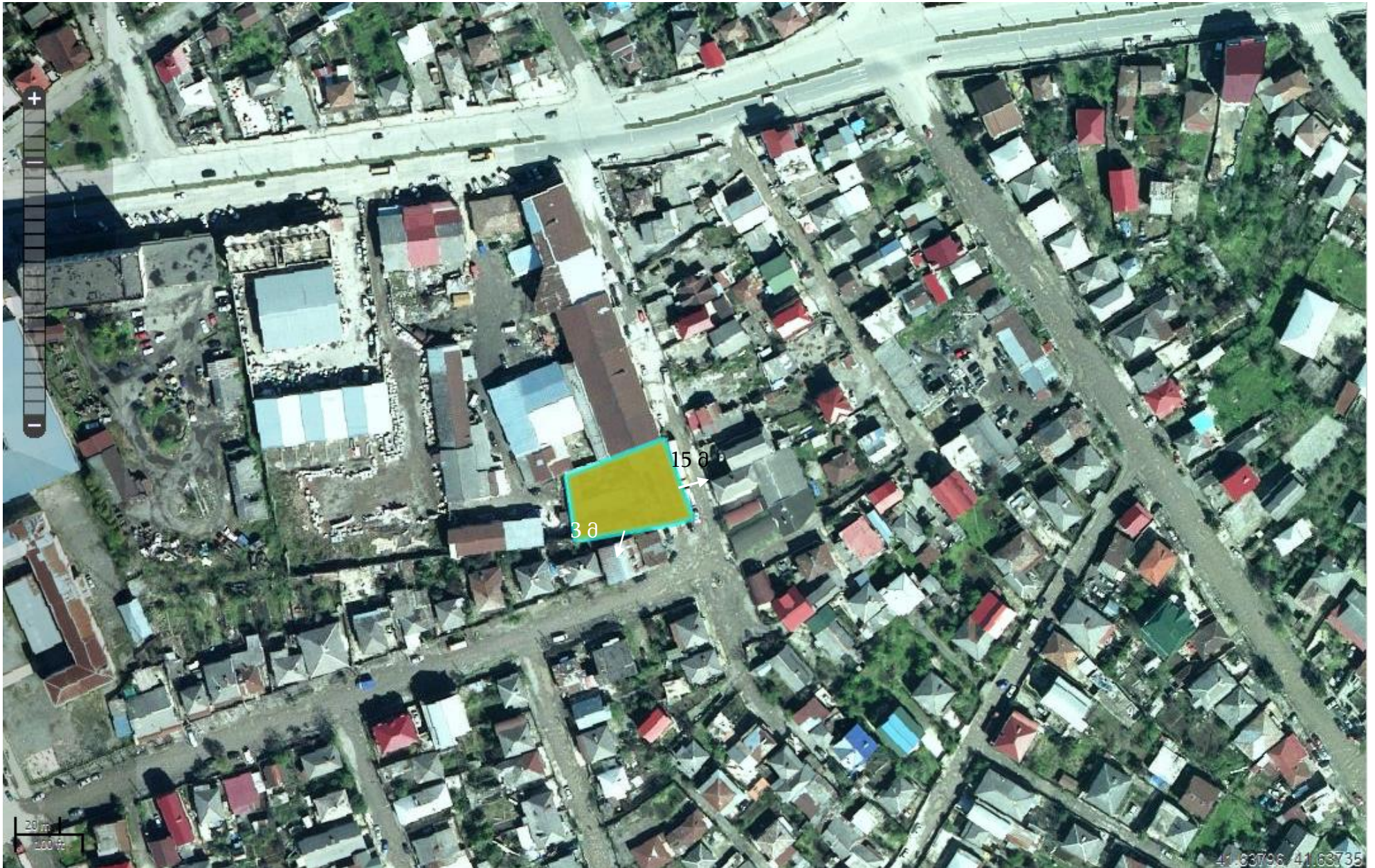
სურათი 3.1.1. სიტუაციური გეგმა