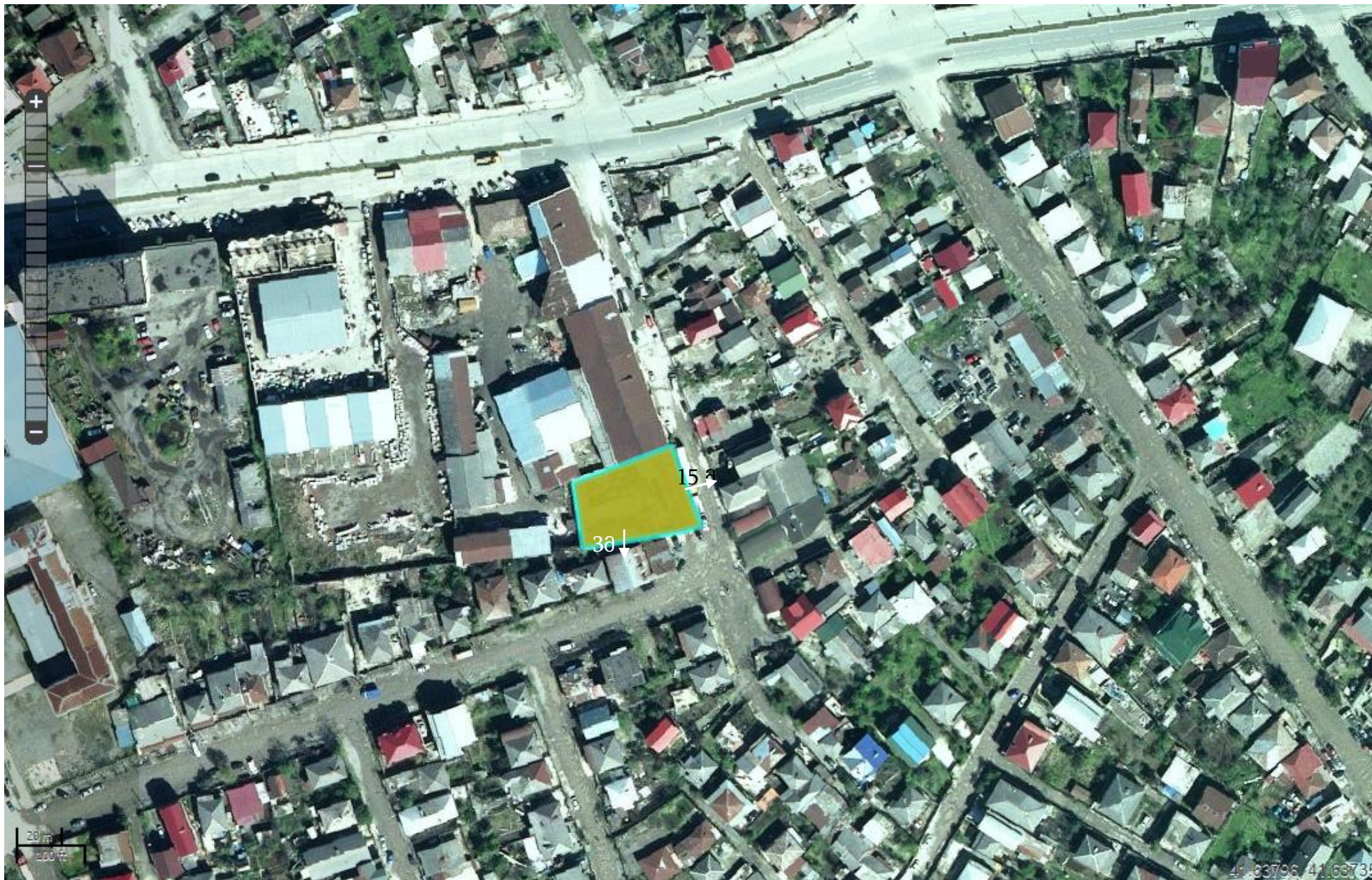
დან.2. საწარმოს განლაგების სიტუაციური რუკა.