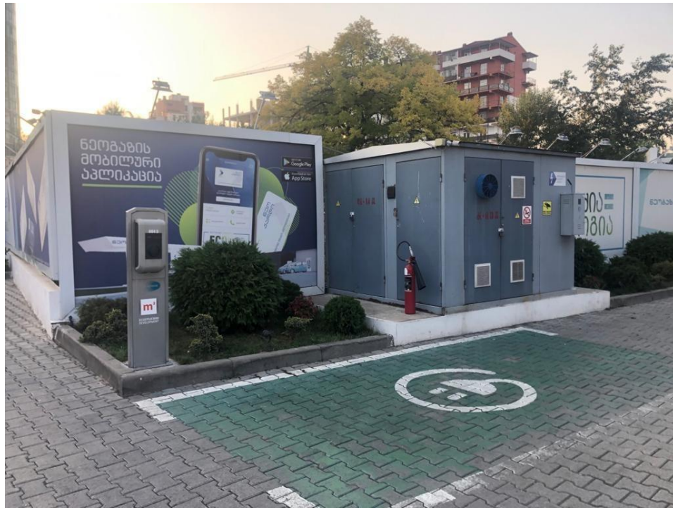
სურ. N 7 - ელექტრომობილების დამტენი სვეტი

საწარმო ობიექტი აღჭურვილია სახანძრო განგაშისა და ცეცხლამოძრენი სისტემებით, ასევე სახანძრო ჰიდრანტით, ხანძარსაწინააღმდეგო სტენდით.