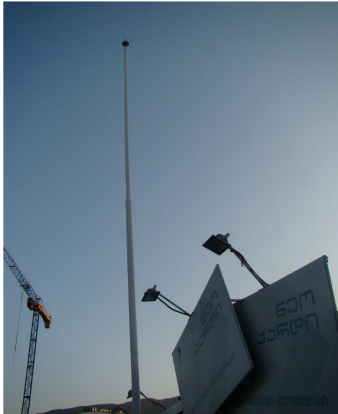
სურ. N 10 - მეხამრიდი