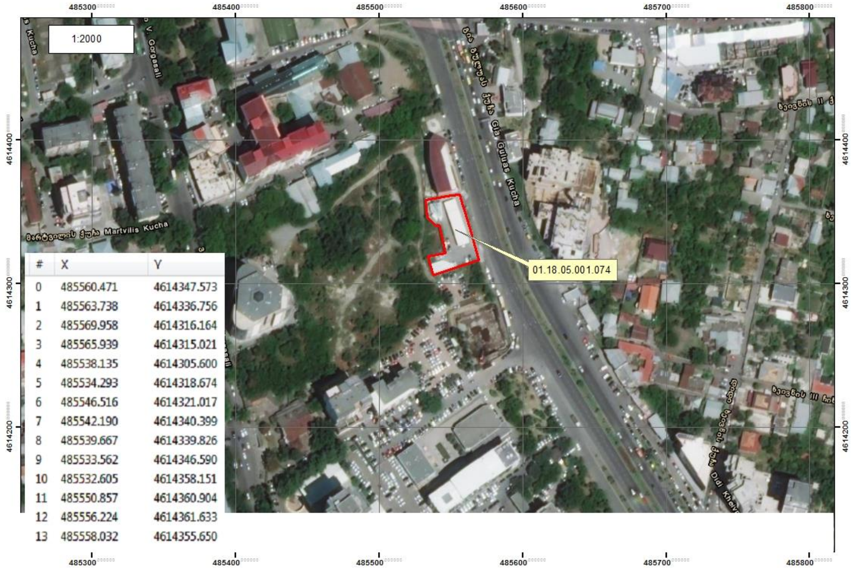
სურ. N 1 - ობიექტის განთავსების სიტუაციური რუკა