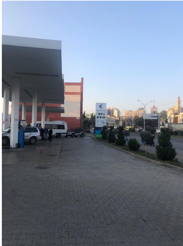
სურ. N 12; 13; 14 - მისასვლელი გზა