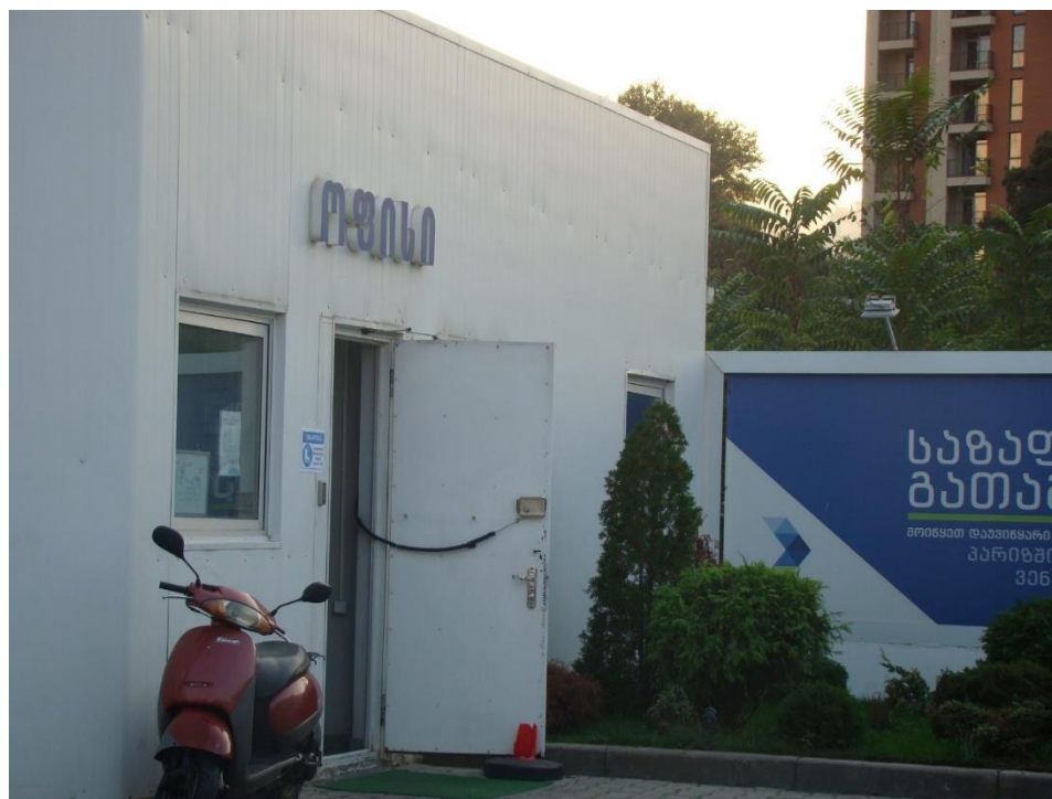
სურ. N 3 - ოფისის შენობა

როგორც უკვე აღინიშნა ობიექტის ტერიტორიაზე მოწყობილია ადმინისტრაციული შენობა, რომელიც მოიცავს როგორც ოფისისთვის განკუთვნილ ინფრასტრუქტურას ასევე საოპერატორს.