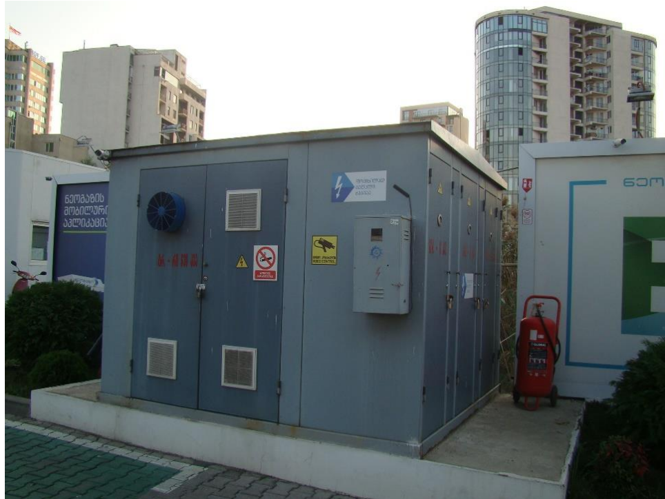
სურ. N 9 - ელექტროენერჯის სატრანსფორმატორო ჯიხური

არსებული გაზგასამართი ობიექტის ტერიტორია აღჭურვილია ყველა საჭირო დამხმარე ინფრასტრუქტურით, როგორცაა: მეხამრიდი, განათების სისტემა, კეთილმოწყობილი სველი წერტილები, ინდივიდუალური ელექტროენერჯის სატრანსფორმატორო ჯიხური და ა.შ.