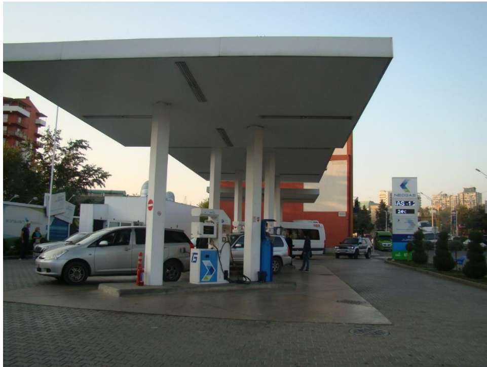
სურ. N 6 – ზუნებრივი აირის გაცემის სვეტები

ობიექტი თხევადი აირით მანქანების გამართვას ამ ეტაპზე არ აწარმოებს.