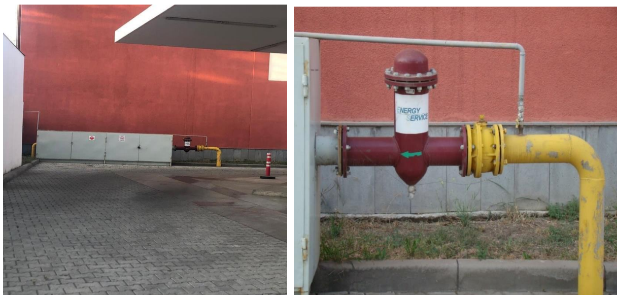
სურ. N 4; 5 - გაზგასამართ ტერიტორიაზე შემომავალი გაზსადენი

ქსელში წნევის ცვალებადობის გამო (რის გამოც ფერხდება კომპრესორების მუშაობა) გაზსადენის დასაწისში მოწყობილია დანადგარი, რომელიც უზრუნველყოფს საკომპრესორო სადგურისთვის ბუნებრივი აირის ოპტიმალური წნევით მიწოდებას (საშუალოდ 5კგ/სმ 2 ). ბუნებრივი აირის მექანიკური გაწმენდის მიზნით საკომპრესორო სადგურამდე მოწყობილია საფილტრავი დანადგარი. კომპრესორში მიწოდებული აირი 5კგ/სმ 2 იზრდება 200-220 კგ/სმ 2 -მდე ოთხ საფეხურად გაზის მიმდევრობითი დაჭირხვნის შედეგად. შეკუმშვის ყოველი საფეხურის ბოლოს გაზს თბომცვლეულში ერთმევა შეკუმშვის გამო გამოყოფილი (შინაგანი ენერჯის გაზრდის შედეგად) სითბო და შეკუმშვის ყოველ შემდგომ საფეხურს მიეწოდება ამგვარად გაგრილებული გაზი. შეკუმშვის ბოლო საფეხურის ბოლოს გაზის წნევა ხდება 200-220 კგ/სმ 2 და თბომცვლეულში გავლით გაგრილდება გარემოს ტემპერატურამდე. შემდეგ ბუნებრივი საწვავი დროებით შესანახად მიეწოდება მაღალი წნევის რეზერვუარს, საიდანაც მარაგდება ავტომანქანის საწვავი გაზით გაწყობა-გამართვის სვეტები/დისპენსერები.