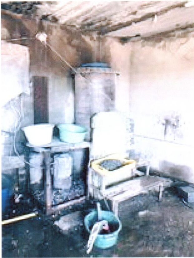
1. როტაციული დამაქუცმაცებელი