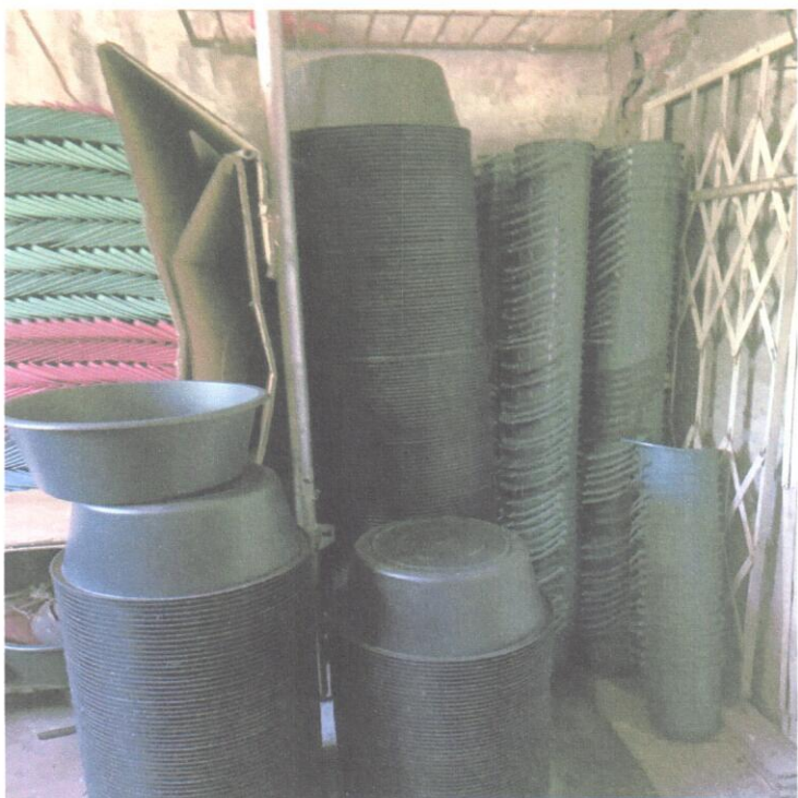
მზა პორდუქციის საწყობი 1