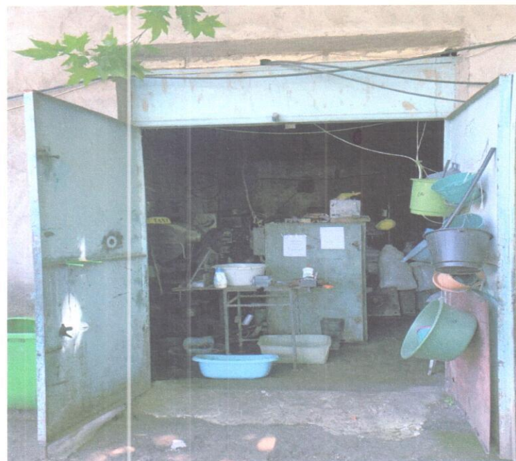
თერმოპლასტ - ავტომატი 2