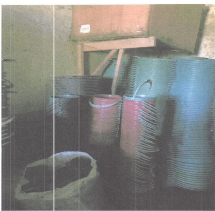
მზაპორდუქციის საწყობი 2