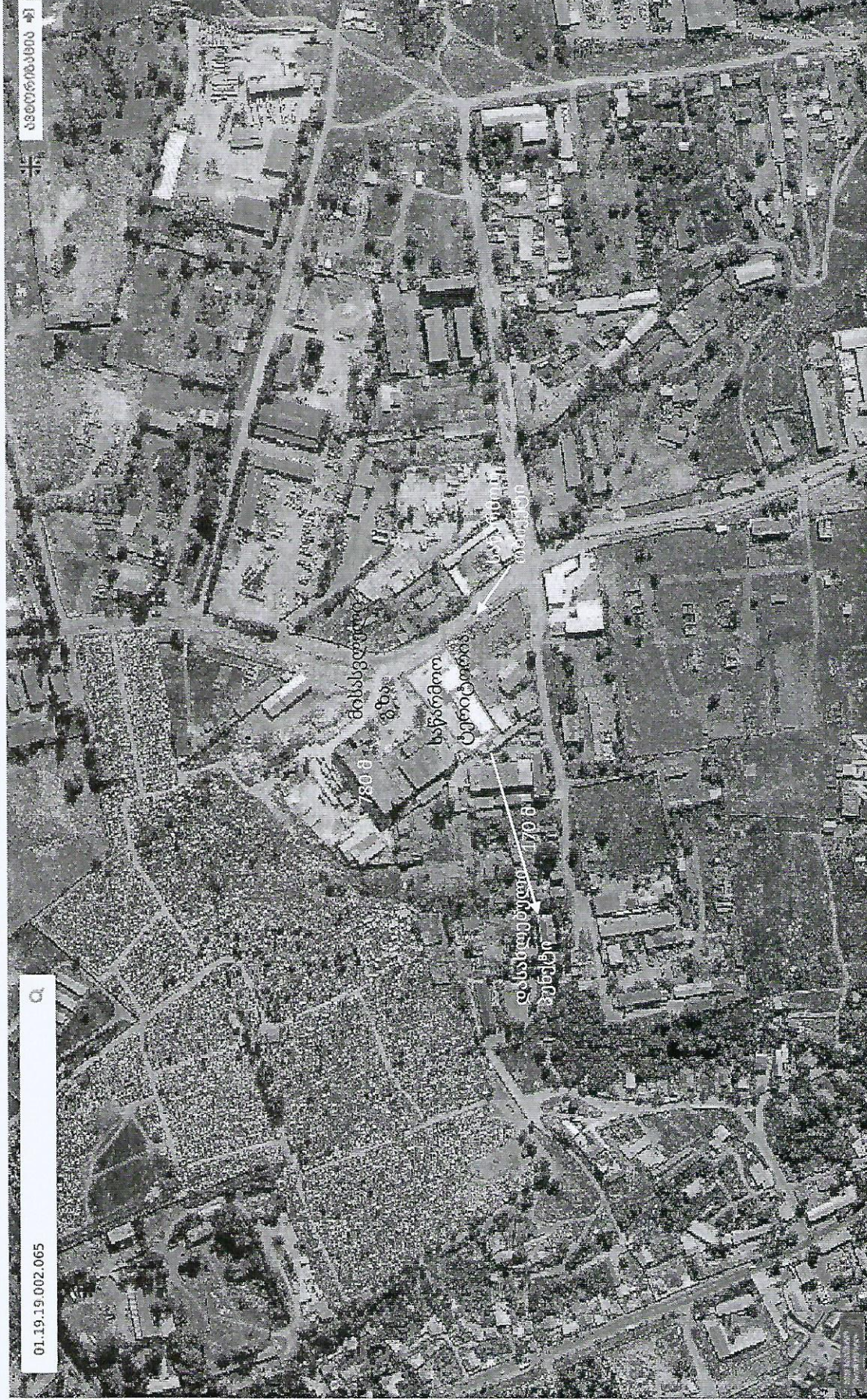
სურ. 1 - საწარმოს განთავსების ტერიტორიის სიტუაციური რუკა.