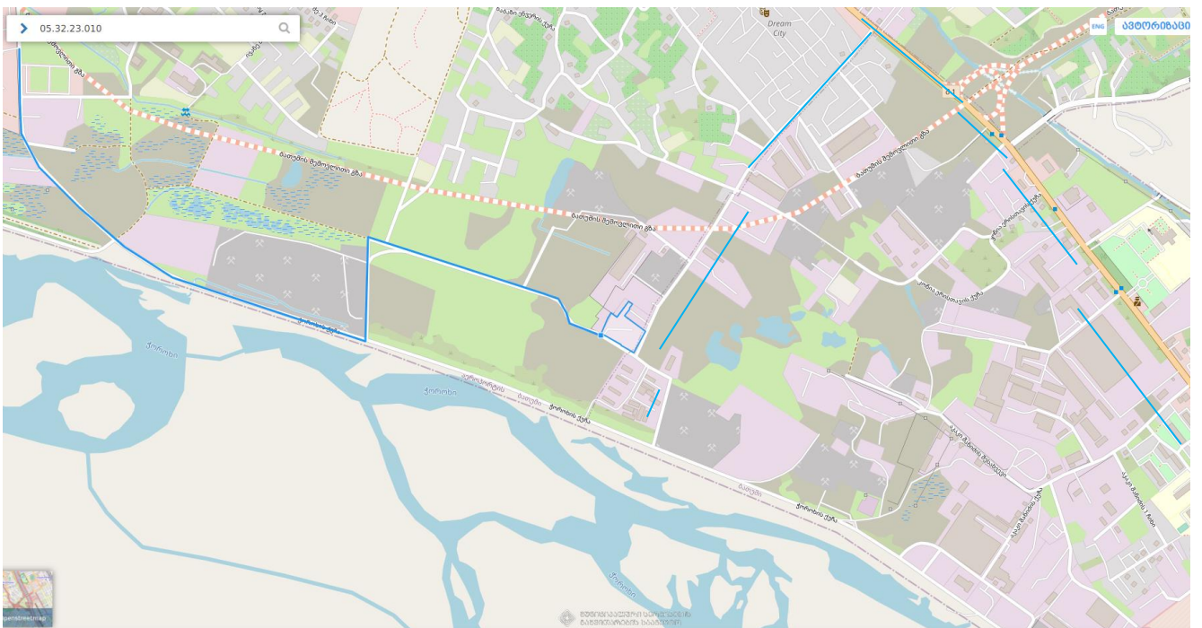
სურათი 4.11.1. საწარმოში ნედლეულისა და პროდუქციის ტრანსპორტირების მოძრაობის სქემა (ლურჯი ფერით მონიშნულია ტრანსპორტირების მარშრუტი).

საწარმოში ნედლეულისა და პროდუქციის ტრანსპორტირებისათვის, ქ. ბათუმის მერიის მიერ შერჩეულია ქალაქის შემოსასვლელი გზებით მოძრაობა, ხოლო ქალქში დასახლებულ პუნქტებთან მოძრაობა სატვირთო მანქანების აკრძალულია, რომელიც რეგულირდება შესაბამისი მოძრაობის ამკრძალავი ნიშნებით.