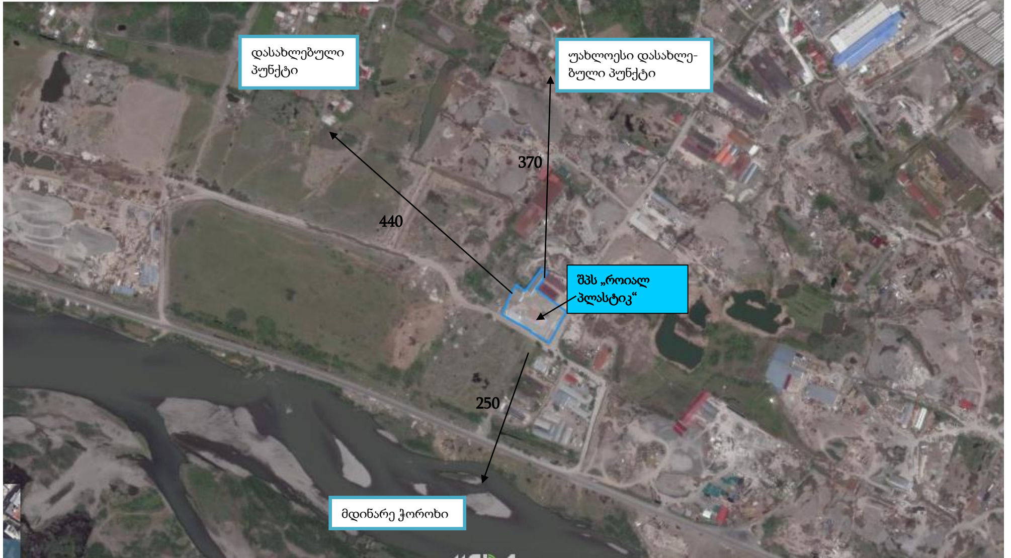
დან.2. საწარმოს განლაგების სიტუაციური რუკა.