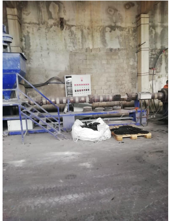
სურათი 2.2.3, გრანულატორი

გამომშვებული პროდუქციის გადაზიდვა-რეალიზაცია: ნარჩენების გადამუშავების შედეგად გამოშვებული პროდუქცია (გრანულების სახით) მათი ტიპების შესაბამისად მზად არის მათი გადაზიდვა-რეალიზაციისთვის.