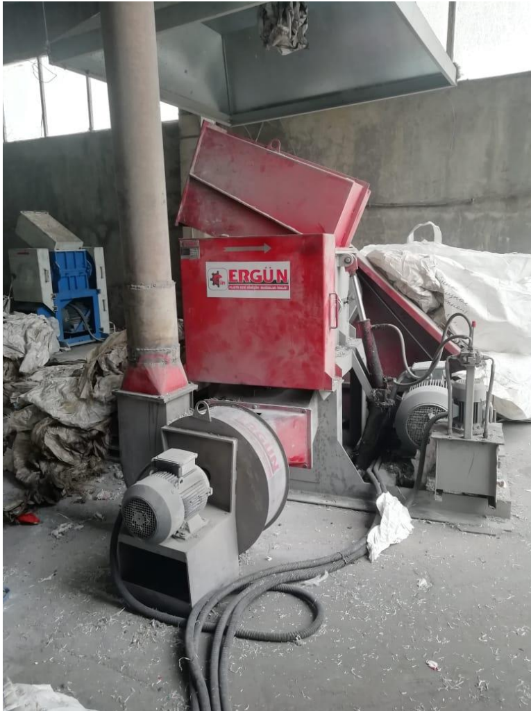
სურათი 2.2.1 აგლომერატის დანადგარი (წისქვილი)

ნარჩენების გადამუშავების პროცესი: საწარმოში შემოსული ნედლეული გადის მშრალ დამაქუცმაცებელი დანადგარის გავლით, სადაც ხორციელდება ნარჩენების დაქუცმაცების პროცესი. აგლომერაციის დანადგარში ხდება ნარჩენების სასურველ ზომამდე დაყვანა და შემდგომ ხდება ნედლეულის წინასწარი მომზადების პროცესი. მაღალი სიჩქარით მბრუნავ ქვაბში ხდება ნედლეულიდან ნესტის აცილება, მათი დაქუცმაცება და პატარა ზომებად ქცევა (იხ. სურათი 2.2.1).