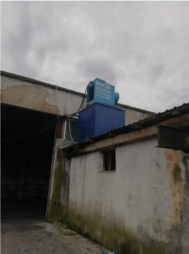
სურათი 2.2.2 წყლის გაცივების დანადგარი

გრანულატორი: აგლომერაციის დანადგარში დამუშავებული ნედლეული მიდის გრანულატორის დანადგარში, სადაც ის ელექტროენერგიის ხარჯზე ხურდება 160 – 170 გრადუსამდე, ხდება ერთგვაროვანი ბლანტი. შემდეგ ხდება გამდნარი ნედლეულის ცივი წყლის აუზის სისტემაში გაცივება, რომელიც მუშაობს როგორც დახურული სისტემა და გამოიყენება ნედლეულის გასაგრილებლად (იხ. სურათი 2.2.2).. ნედლეული, რომელსაც ცივი წყალი გადის გამდნარ მდგომარეობაში იყოფა მცირე ზომის ნაჭრებად და საჭრელ დანადგარში გადაიქცევა გრანულად (იხ. სურათი 2.2.3).