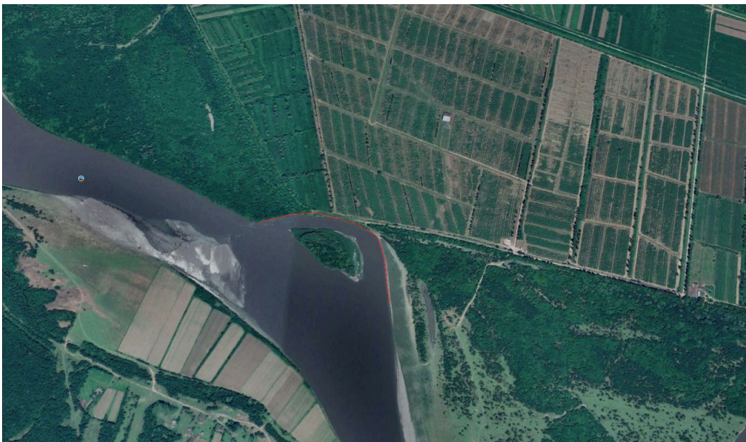
ნახ.1 მდ. რიონის ეროზიული მარჯვენა ნაპირი

საპროექტო ღონისძიება. საკვლევი უბანი მდებარეობს სენაკის მუნიციპალიტეტის სოფ.სირიაჩკონში მდინარე რიონის მარჯვენა ნაპირზე. გვერდითი ეროზიის შედეგად ირეცხება მარჯვენა ნაპირი, სადაც განლაგებულია თხილის პლანტაციები (ნახ.1). დაახლოებით 195 მ მონაკვეთზე მთლიანად გარეცხილის მიწის დატბორვის საწინააღმდეგო დამბა. საკვლევ უბანზე, წინა წლებში დაახლოებით 115 მ სიგრძის მონაკვეთზე განხორციელებული იყო ნაპირსამაგრი სამუშაოები, თუმცა ვიზუალური შეფასებით ნაგებობის ნარჩენები სრულყოფიად ვერ შეასრულენ ეროზიის საწინააღმდეგო ნაგებობის ფუნქციას.