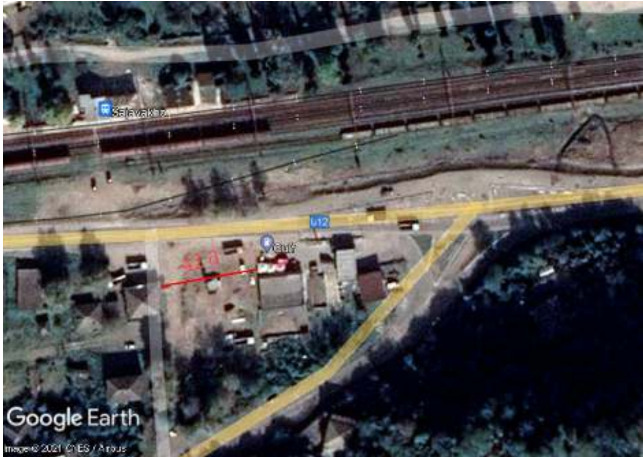
ილუსტრაცია 1 საპროექტო ტერიტორიის სიტუაციური რუკა