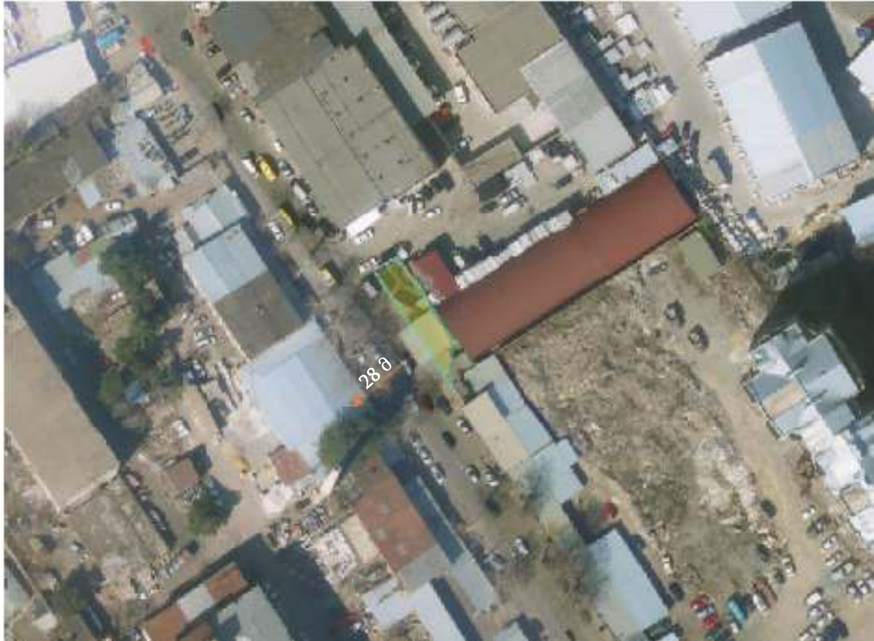
ილუსტრაცია 1საპროექტო ტერიტორიის სიტუაციური რუკა