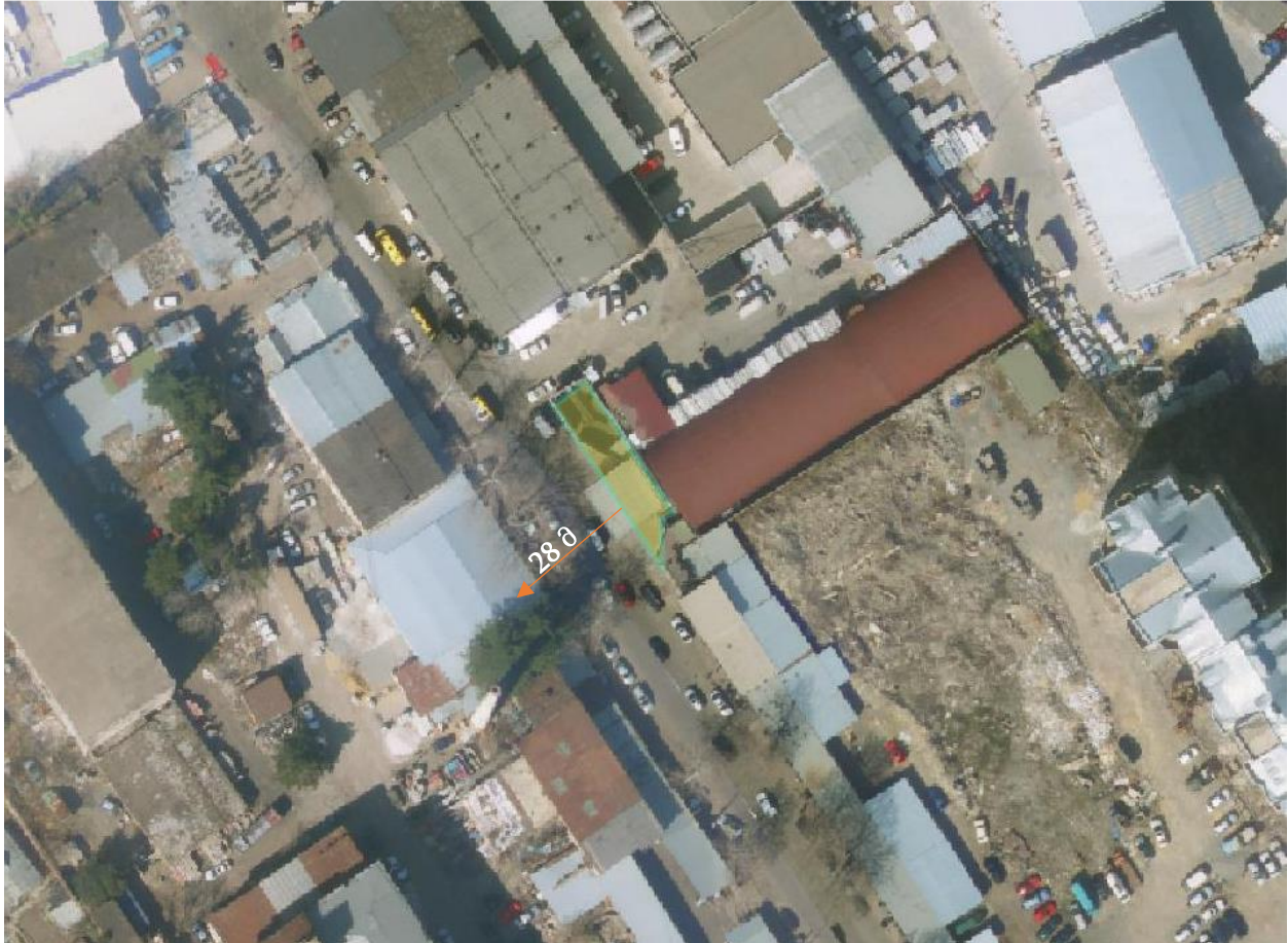
ილუსტრაცია 1საპროექტო ტერიტორიის სიტუაციური რუკა