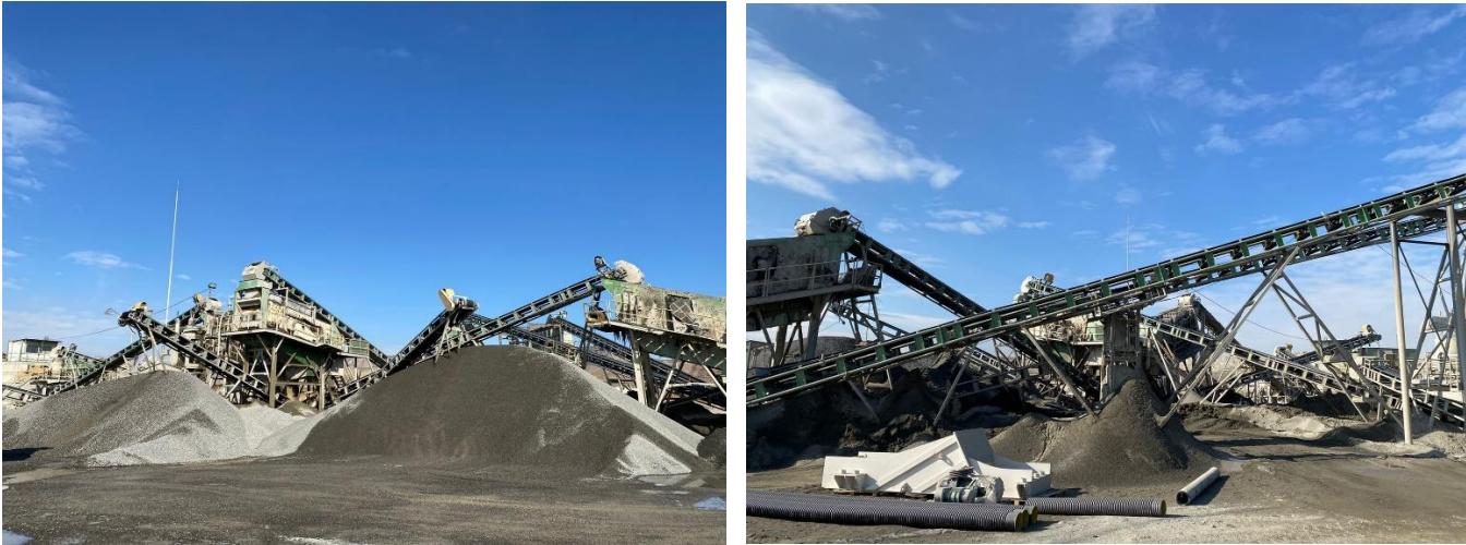
სურ. N2.1 - საპროექტო ტერიტორია

საპროექტო ტერიტორიამდე მიდის არსებული გზა, რომელიც უერთდება შიდასახელმწიფოებრივი მნიშვნელობის მაგისტრალს და დამაკმაყოფილებელ მდგომარეობაშია. შესაბამისად დამატებითი გზების მოწყობა საქმიანობის ფარგლებში გათვალისწინებული არ არის. აღსანიშნავია ის ფაქტი, რომ საპროექტო ტერიტორია შემოღობილია და მიწის ნაკვეთებამდე მიყვანილია ელექტრო ენერგია.