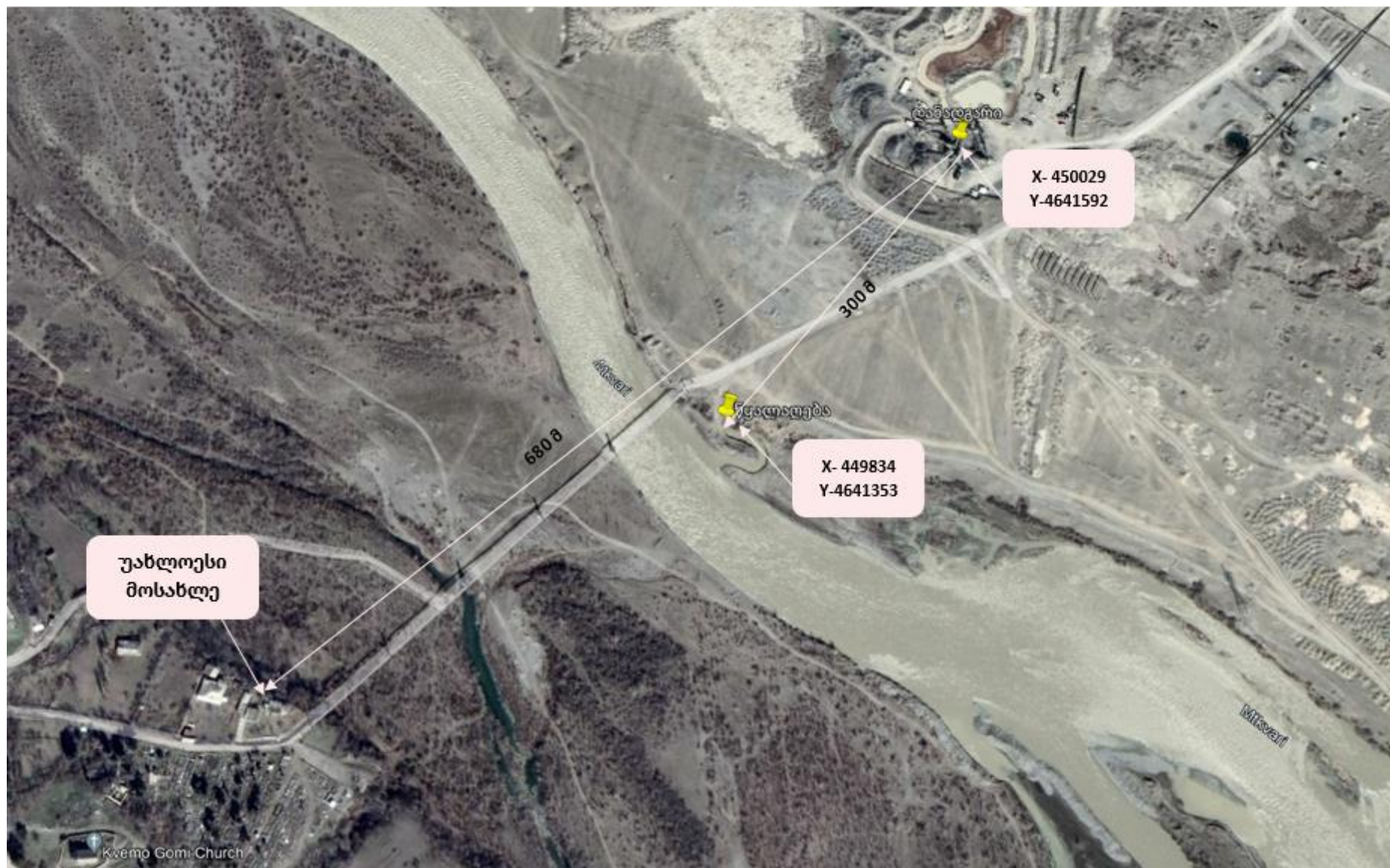
სურ. N2.2 - ობიექტის განთავსების სიტუაციური რუკა