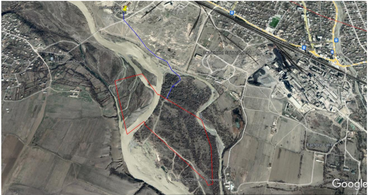
სურ. N3.3 - მარშრუტი საწარმოო დანადგარიდან დაგეგმილ კარიერამდე