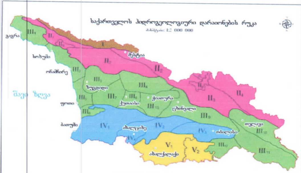
ჰიდროგეოლოგიური რეგიონების რუკა