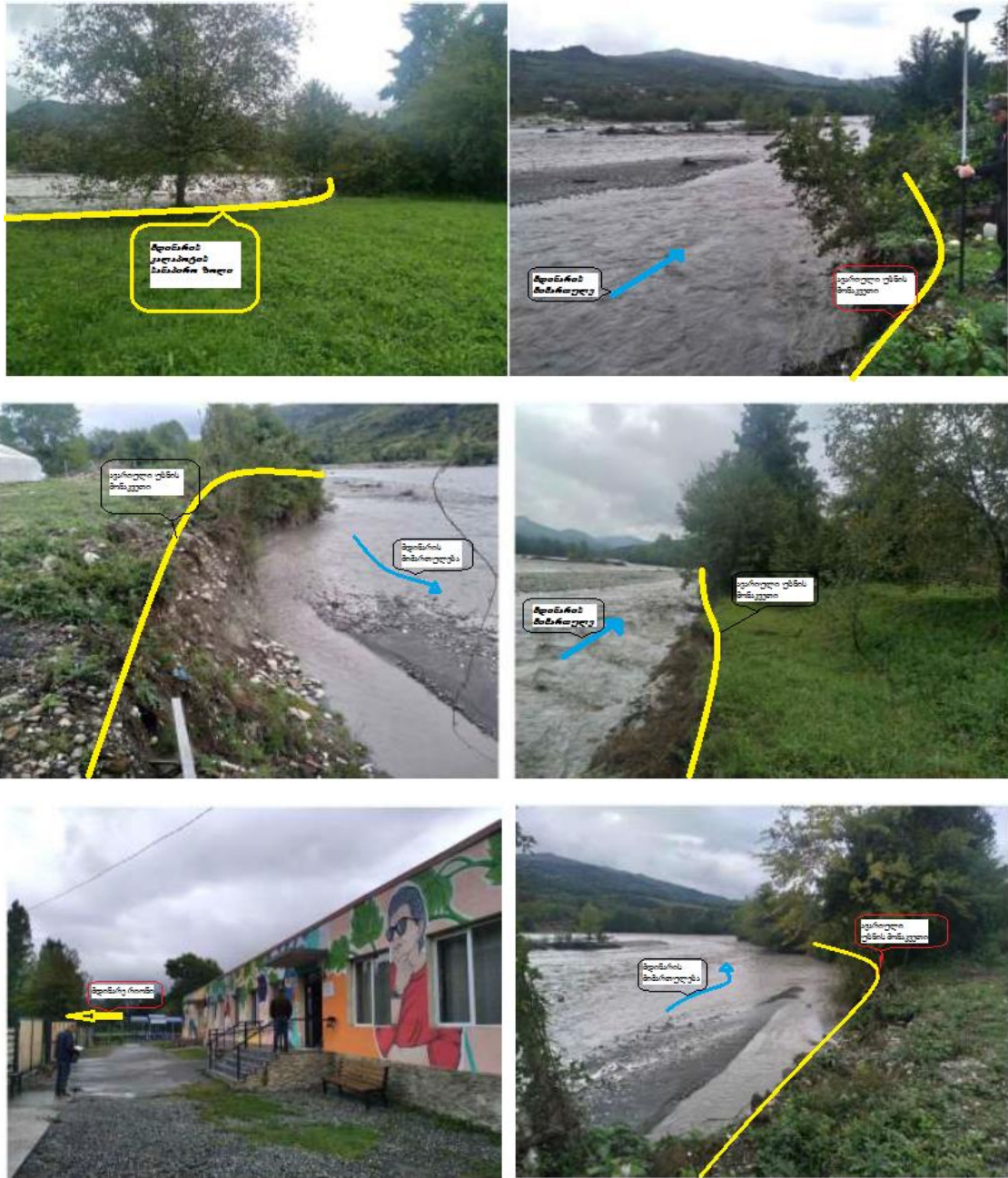
სურათები 2.1. საპროექტო ტერიტორიის ხედები

ნაპირდამცავი ნაგებობის მიმდებარე ტერიტორიაზე არ არის სხვა მნიშვნელოვანი ინფრასტრუქტურული ობიექტი.