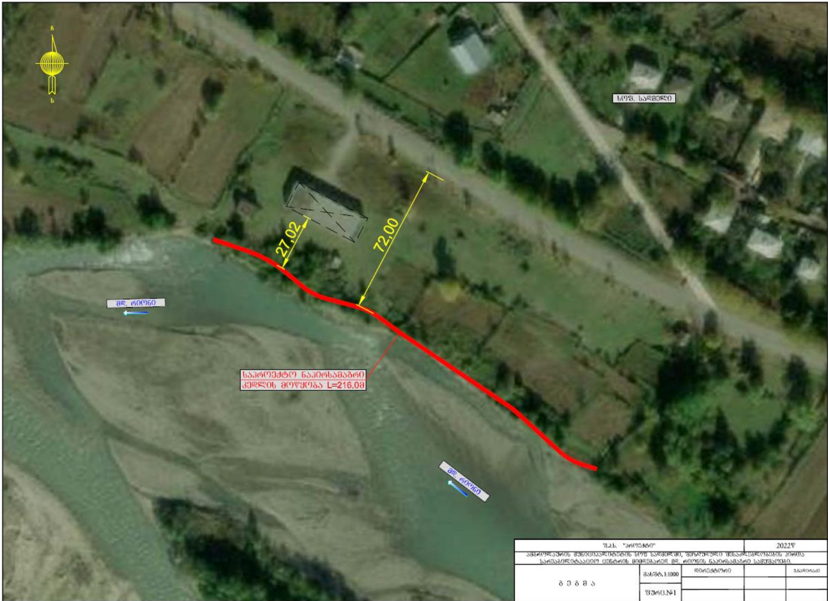
ნახაზი 2.1. საპროექტო ტერიტორიის სიტუაციური სქემა