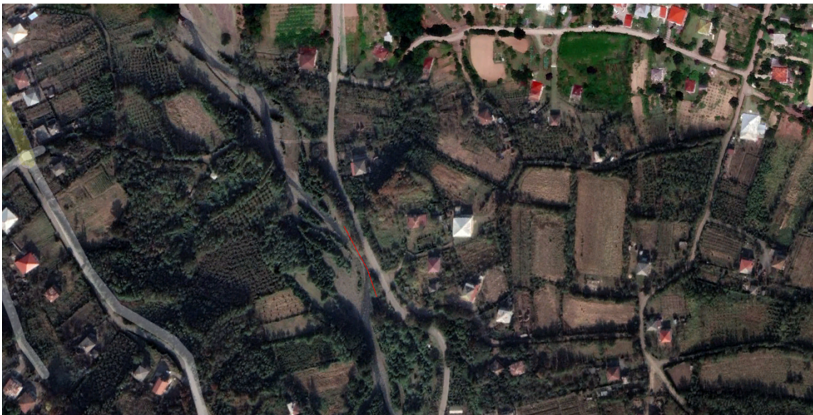
ნახ.1 მდ. კვინისწყლის ეროზიული მარჯვენა ნაპირი

საპროექტო დონისძიებები. ავარიული უბანი მდებარეობს სოფ.ამაღლებაში, მდ. კვინისწყლის მარჯვენა ნაპირზე. მდინარის მოხვევის ადგილას გვერდითი ეროზიის შედეგად ირეცხება მაღალი (3-4 მ) პირველი ტერასა, რომელზეც გადის ამაღლება-საპრასიას საავტომობილო გზა. ეროზიული პროცესის გაგრძელების შემთხვევაში საშიშროება დაემუქრება ამ საავტომობილო გზას. (ნახ.1).