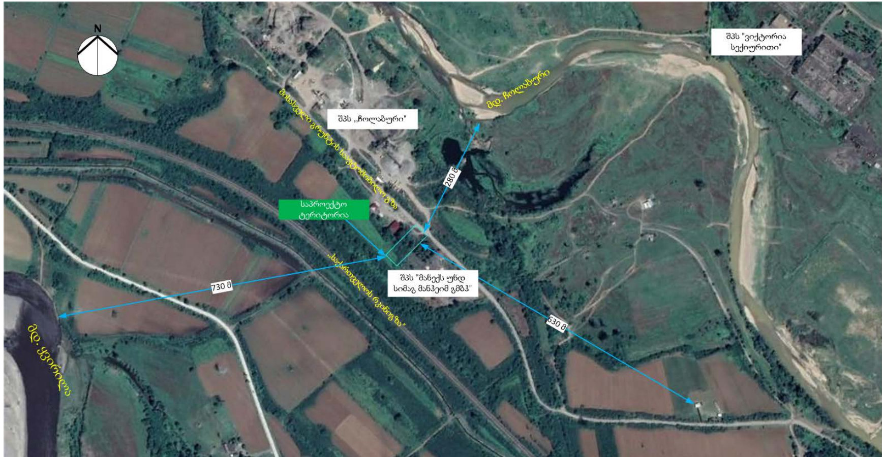
სურათი 1 საწარმოს განთავსების სიტუაციური რუკა