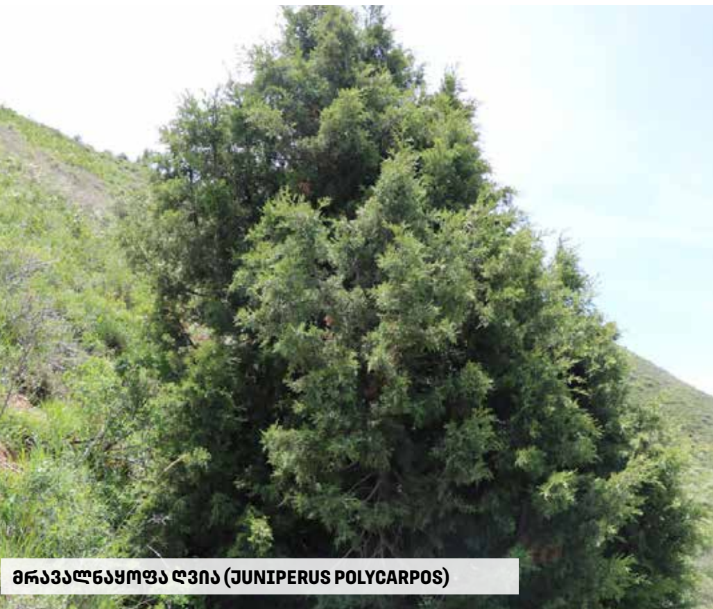
მრავალნაყოფა ღვია (JUNIPERUS POLYCARPOS)

საქართველო მდიდარია მცენარეებითაც, რომელთა გავრცელების თავისებურებასა და მრავალფეროვნებას განაპირობებს აკოლოგიური პირობები, ჰავისა და რელიეფის ნაირგვარობა, გეოლოგიური აგებულება, გეობრაფიული მდებარეობა და სხვა. საქართველოში მრავლადაა როგორც ენდემური და რელიქტური, ასევე ადვანტური სახეობის ბუნებრივი და კულტურული მცენარე. საქართველოს მცენარეული საფარის 380-მდე სახეობა ენდემური წარმომოხდისა, ამასთან, ზომიერეთი გათბანი რელიქტურ მცენარეებსაც მიეკუთვნება.