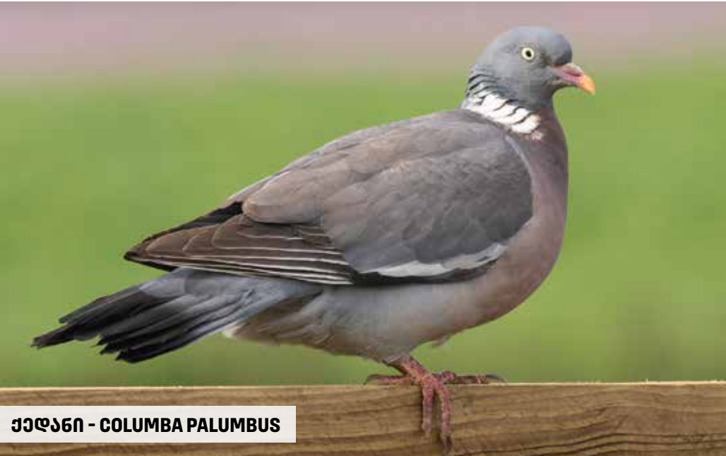
ქედანი - COLUMBA PALUMBUS

საქართველოს ფრინველთა სამყარო საკმაოდ მრავალფეროვნებულია. ჩვენს ტერიტორიაზე ფართოდაა წარმოდგენილი როგორც ენდემური, ისე სხვადასხვა კვიყნებისათვის დამახასიათებელი სახეობები. წარმოდგენით საქართველოს ფაუნის ერთ-ერთ ყველაზე საინტერესო სახეობებს - ქედანსა და ჭიკვარას.