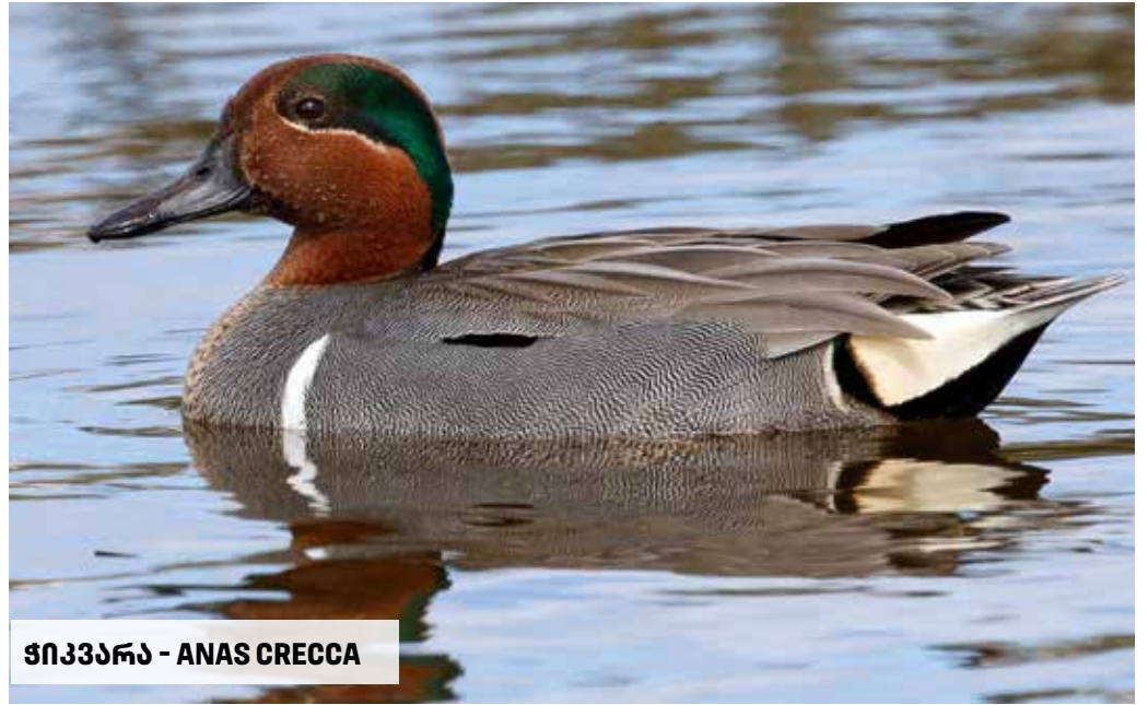
ჭიკვარა - ANAS CRECCA

ქედანი იკვებება ბუდის უშუალო სიახლოვეს მარცვლოვნებით, უფრო იშვიათად მწერებითა და სხვა უხერხემლოებით.