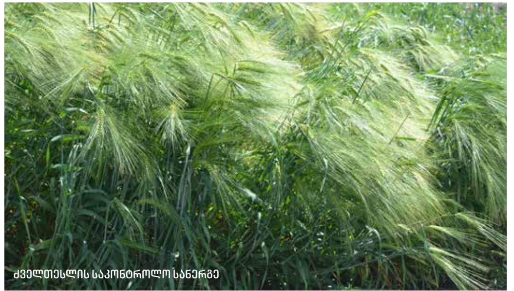
ძველთესლის საკონდიროლო სანერგე