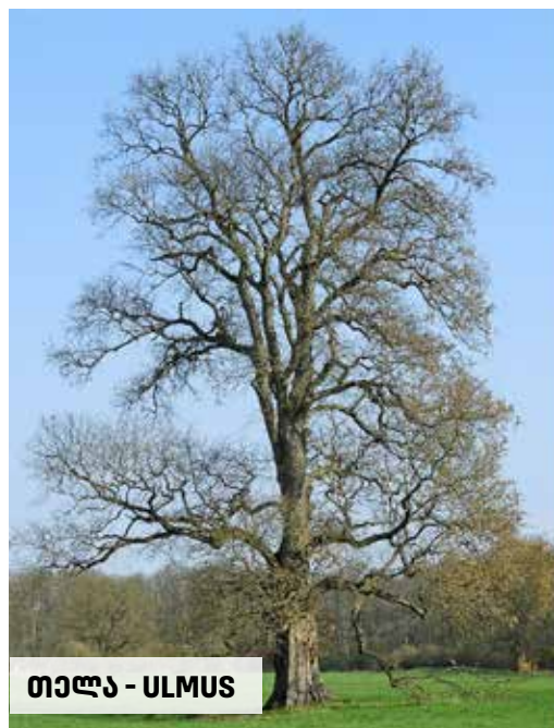
თელა - ULMUS

მრავალნაყოფა ღვია იზრდება მშრალ, ქვიან ფერდობებზე. იგი სემიარიდული ეკოსისტემების ნათელი ტყეების შემადგენელი ნაწილია. საქართველოში, ძირითადად, კახეთშია გავრცელებული. გავრცელების საერთო არეალი მოიცავს კავკასიას, მცირე აზიასა და ირანს.