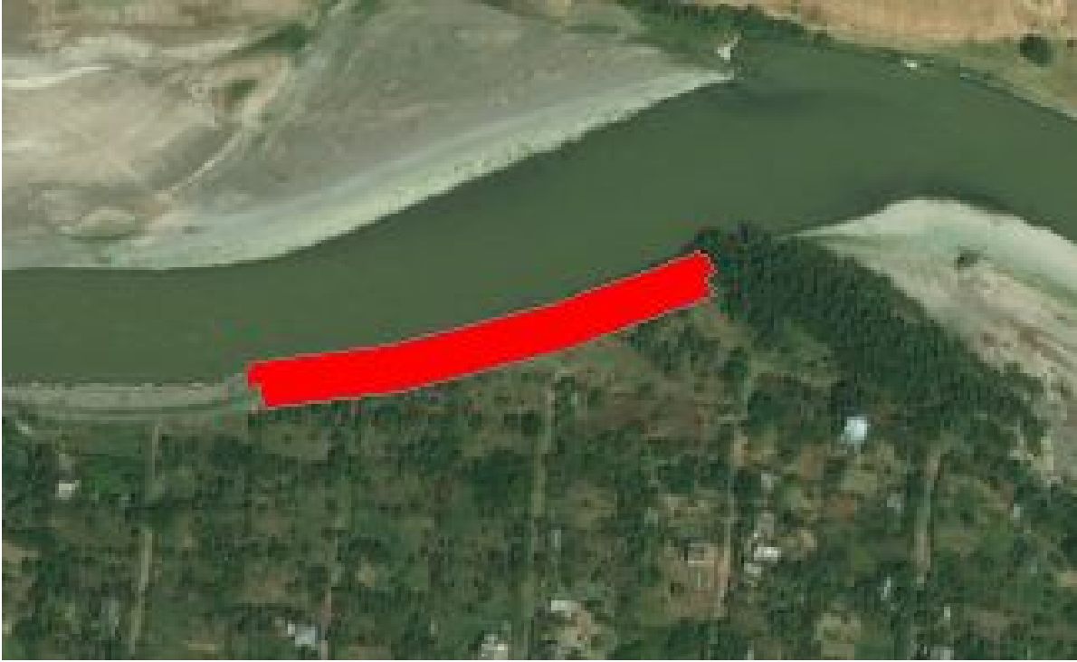
საპროექტო ნაგებობა ორთოფოტოზე