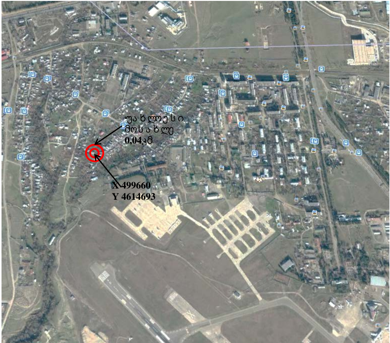
ნახ.1 შპს „ლიდერ პლასტიკ“-ს პლასტმასის ნარჩენების გადასამუშავებელი საწარმო.

შპს „ლიდერ პლასტიკ“-ის პლასტმასის ნარჩენების გადასამუშავებელი საწარმო განლაგდება თბილისში, „ალექსეევკა“-ს დასახლებაში, თბილისის აეროპორტის მიმდებარე ტერიტორიაზე. მანძილი უახლოეს სახლამდე 0,04 კილომეტრია.