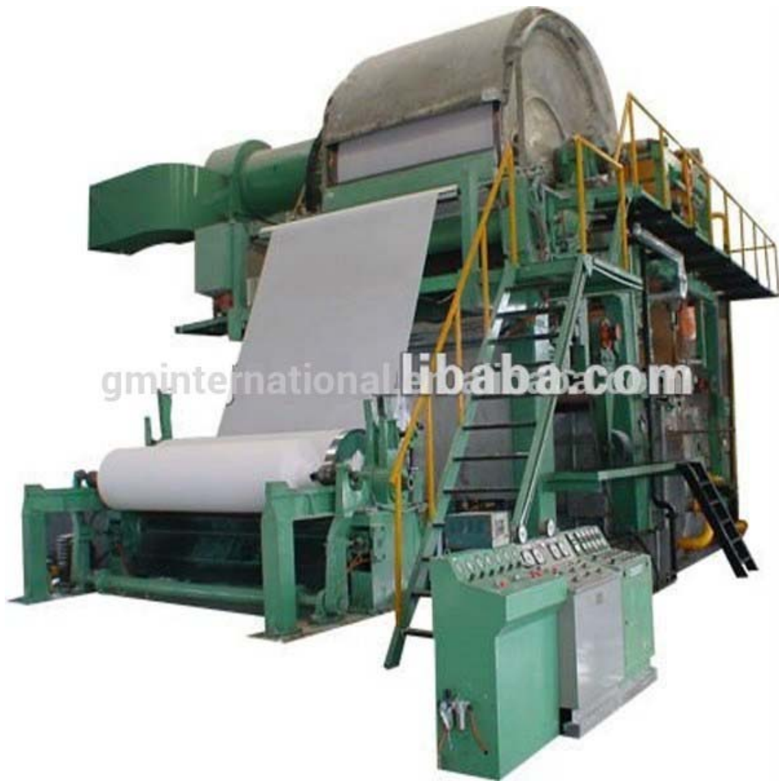
სურათი 1. ქაღალდის ნარჩენების გადამამუშავებელი დანადგარი (1092 Paper make line (1.5 – 2.0 tons))

საწარმოში გადამამუშავების პირველ ეტაპზე ხდება მაკულატურის გადარჩევა. ტექნოლოგიურად ვარგისი მასალა არ უნდა შეიცავდეს უცხო მინარევებს: პოლიეთილენს, პლასტმასს, მეტალს, თოკებს, ე.წ. „სკოჩს“. მაკულატურა არ უნდა იყოს დაბინძურებული ზეთოვანი და ცხიმოვანი ნივთიერებებით, არ უნდა იყოს წყალში უხსნადი მასალა - კალკა, სურათები, ელ. კარდიოგრამის ფირები და ა.შ. საწარმოში ხელით გადარჩევისას ხორციელდება შემოთ ჩამოთვლილი არა საჭირო ინგრედიენტების მოცილება. გადარჩევისას წარმოქმნილი ნარჩენები იყრება ნაგვის ბუნკერში, რომელიც შემდგომ გააქვს ქ. თბილისის დასუფთავების სამსახურს.