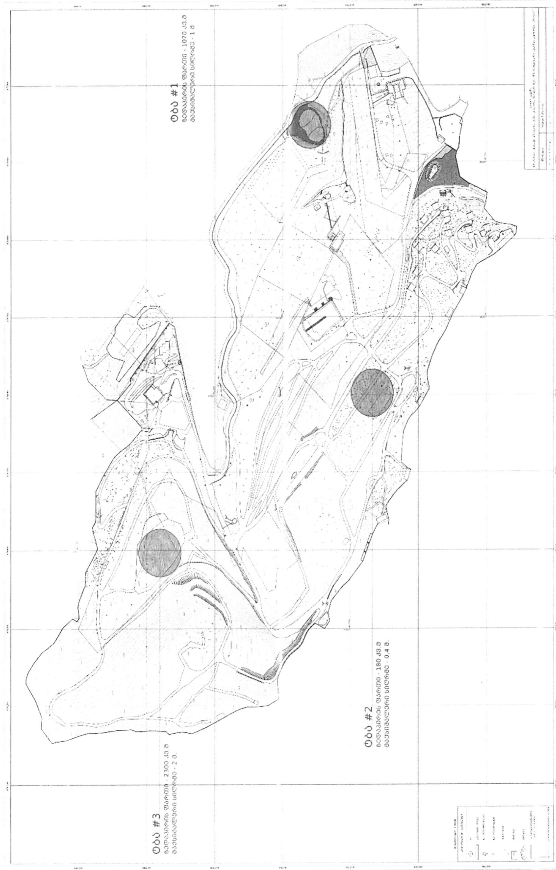
სურ. #2 - ხელოვნური ტბების განთავსების ადგილმდებარეობა