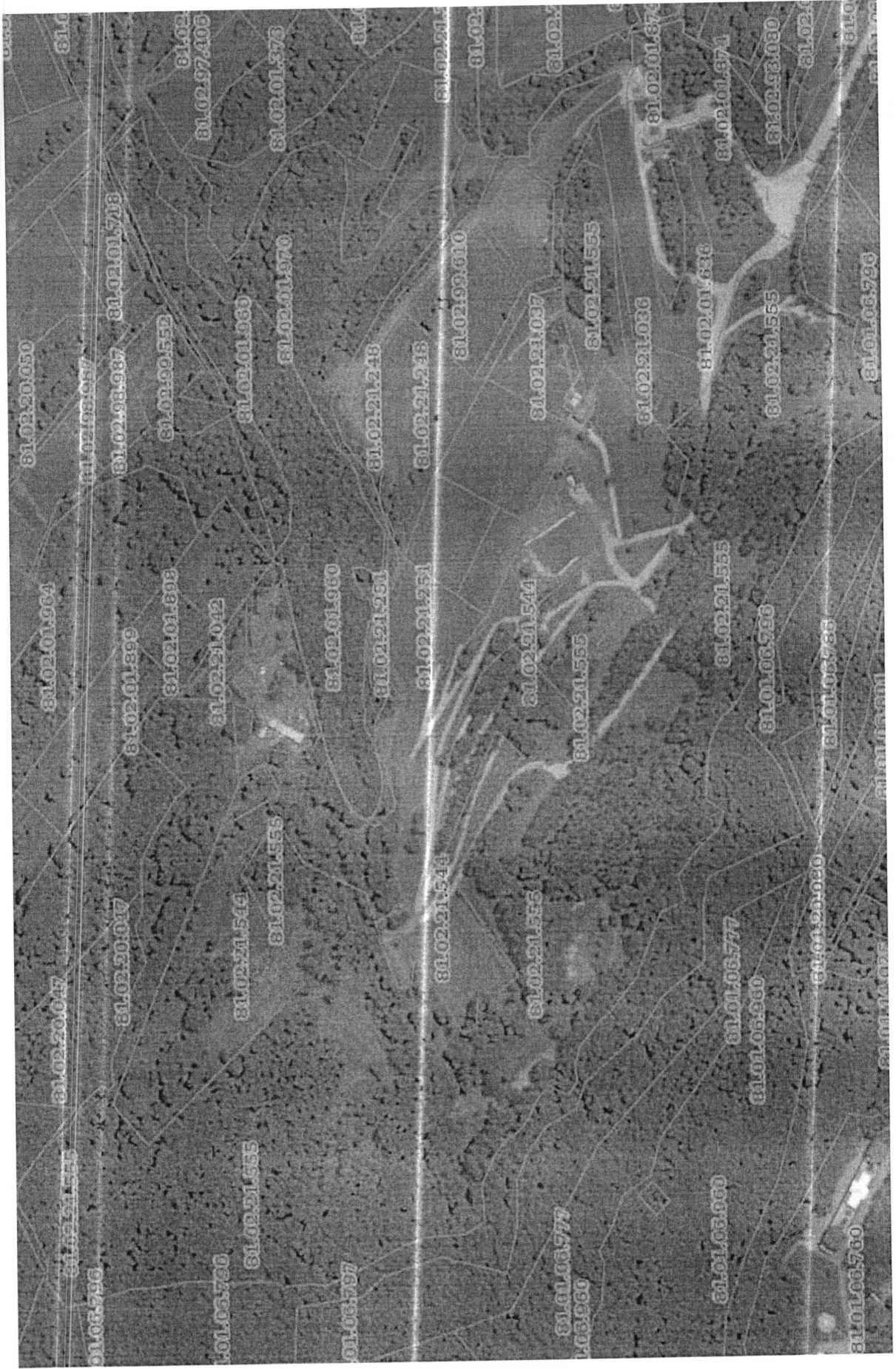
სურ. #3 - კურორტის განაშენიანების სიტუაციური სქემა