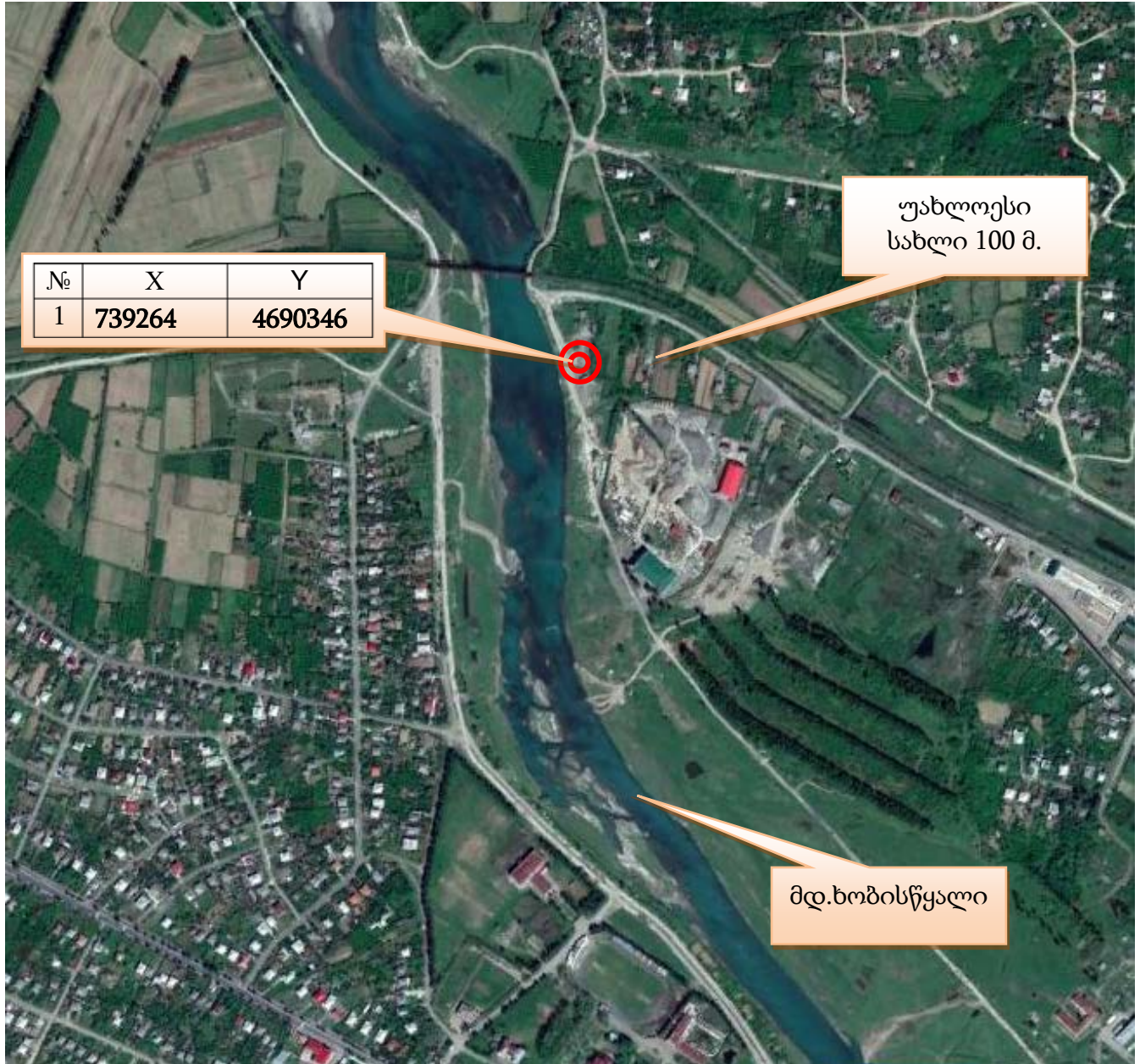
ნახ.1 შპს „ჯ ტ მ“-ს ქვიშა-ლორდის საწარმო. მაშ. 1:10000.

შპს „ჯ ტ მ“-ს მშენებარე საწარმო განლაგებულია . ხობში, ქაჯაიას ქუჩაზე მანძილი უახლოეს სახლამდე 0,10 კილომეტრია.