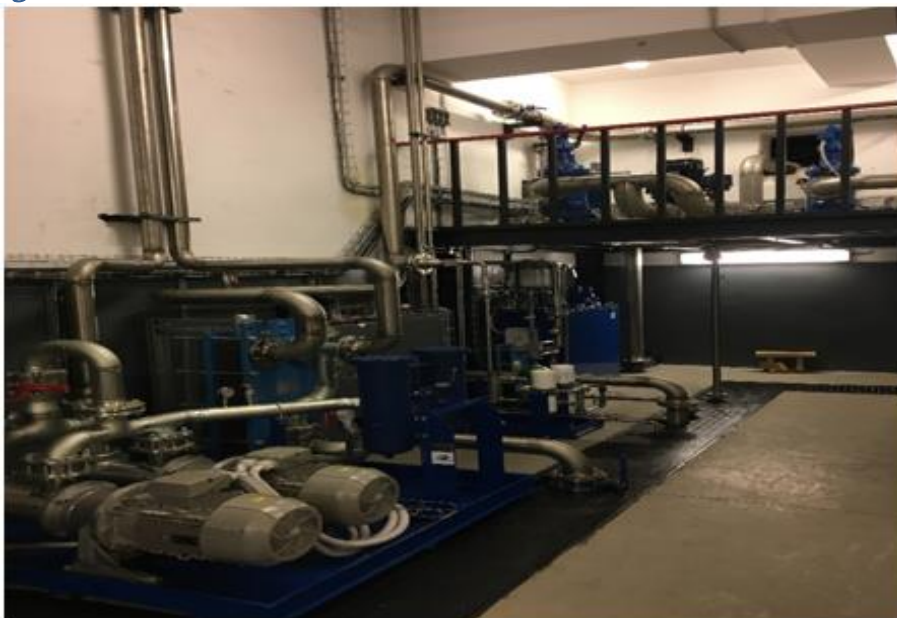
ახალი შეზეთვისა და გაციების სისტემები