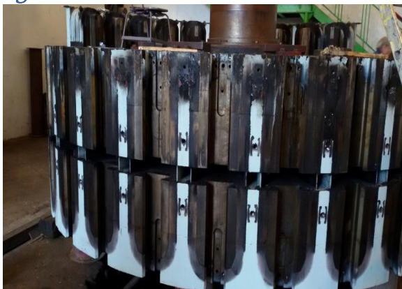
ძველი და ახალი როტორი