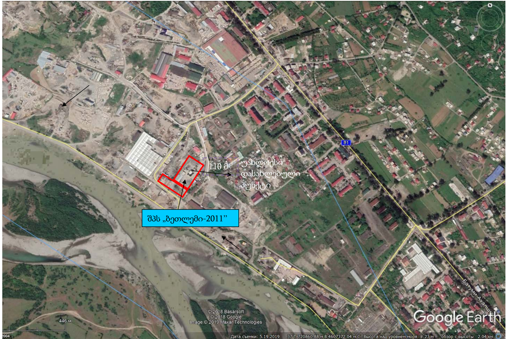
სურათი 2.1.1. სიტუაციური გეგმა