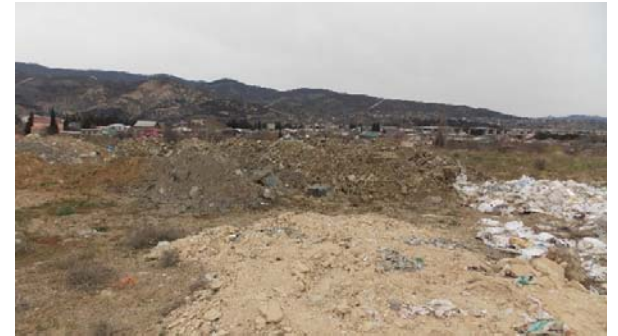
სამშენებლო ნარჩენების გროვები მარჯვენა სანაპიროზე