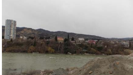
მჭიდროდ განაშენიანებული ტერიტორია მარცხენა სანაპიროზე