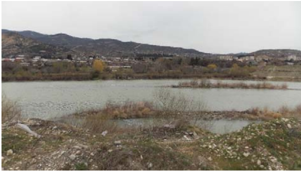
დამბის განთავსების გასწორი