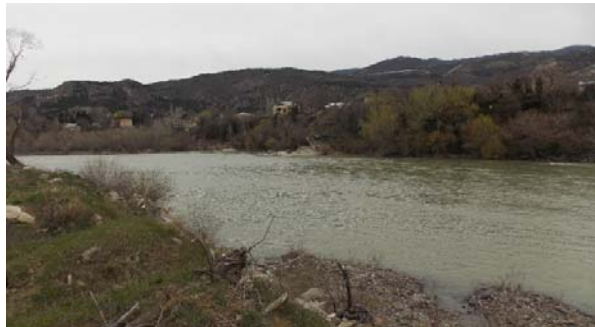
საპროექტო წყალსაცავის პერიმეტრი