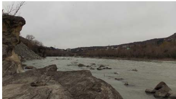
საპროექტო წყალსაცავის პერიმეტრი,