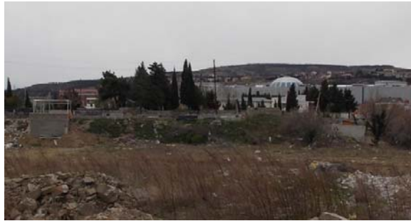
სასაფლაო მდ. მტკვრის მარჯვენა სანაპიროზე