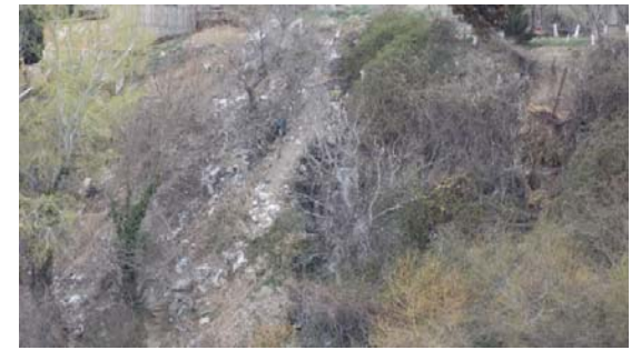
მარცხენა სანაპიროზე არსებული განაშენიანებული ტერიტორიიდან საკანალიზაციო წყლების წყალჩაშვება მდ. მტკვარში