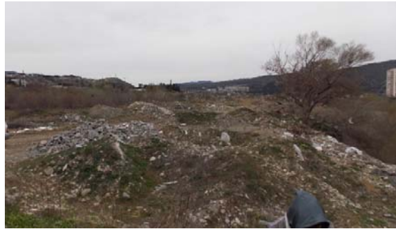
სამშენებლო ნარჩენების გროვები დამბის განთავსების კვეთთან, მარჯვენა სანაპირო