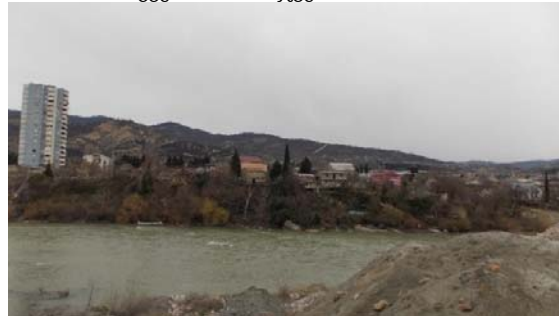
მჭიდროდ განაშენიანებული ტერიტორია მარცხენა სანაპიროზე