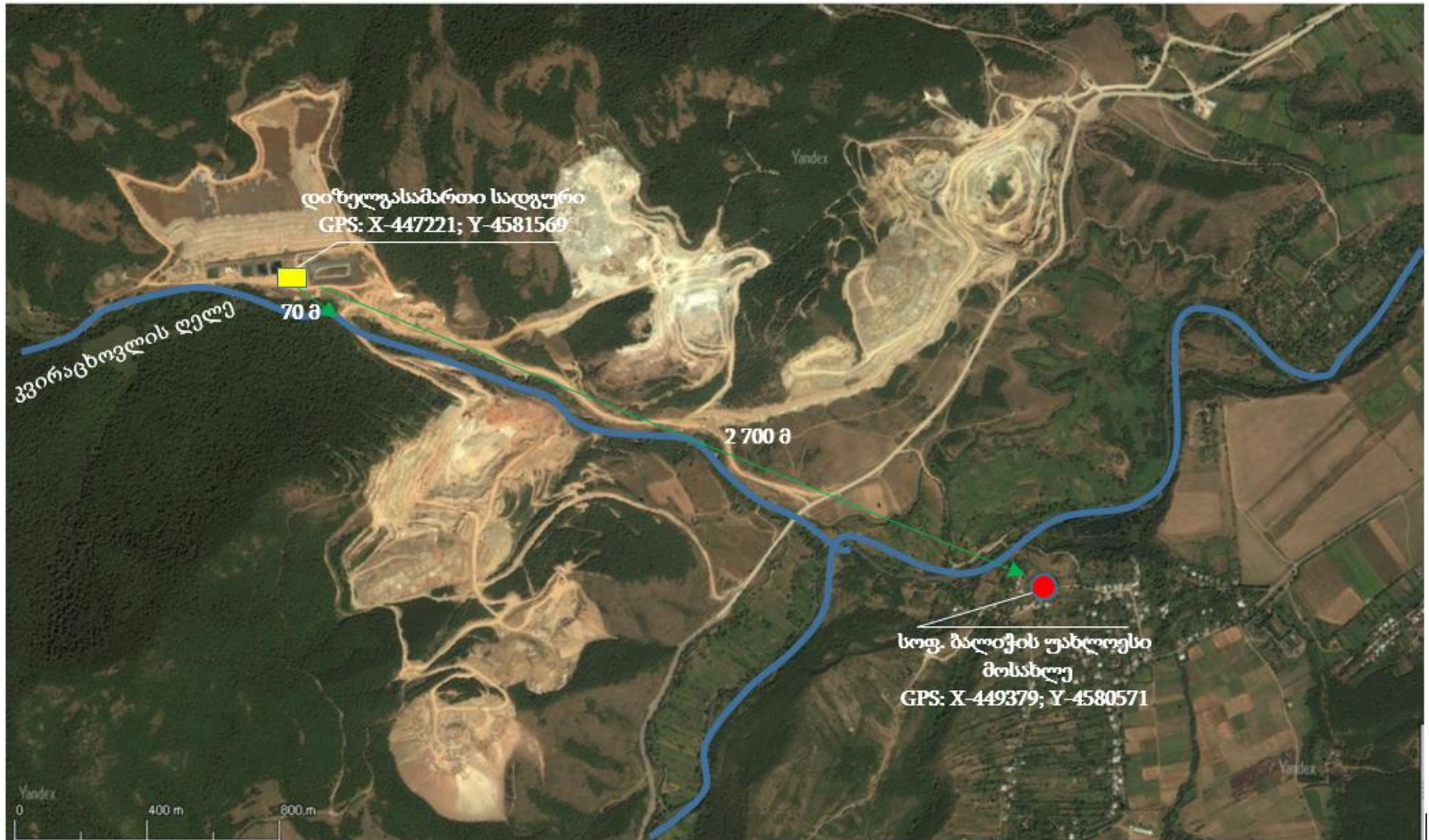
სურათი 1. ნავთობპროდუქტების საცავის განთავსების ადგილი