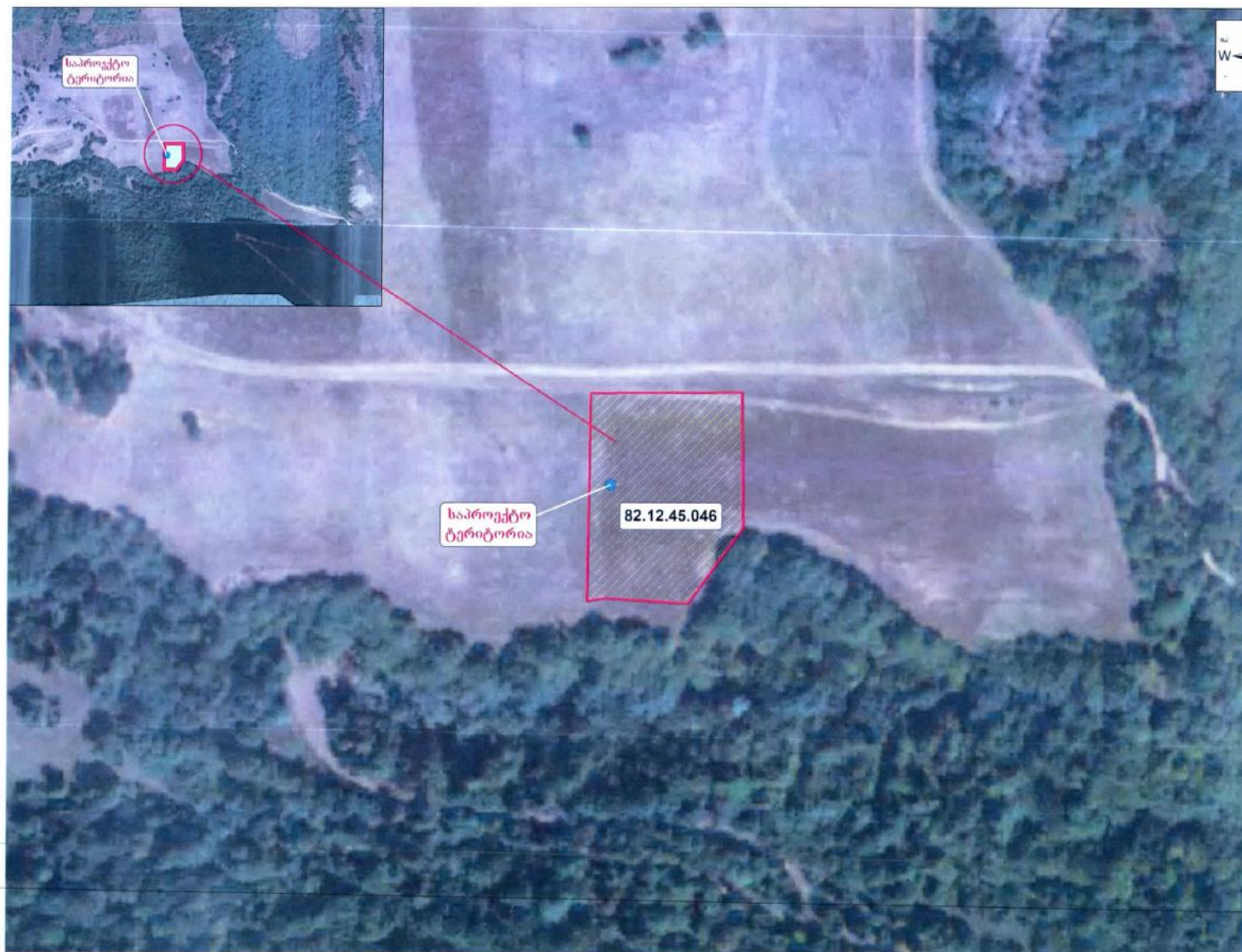
დანართი 2. ნავთობპროდუქტების საცავის ადგილმდებარეობის სიტუაციური ნახაზი