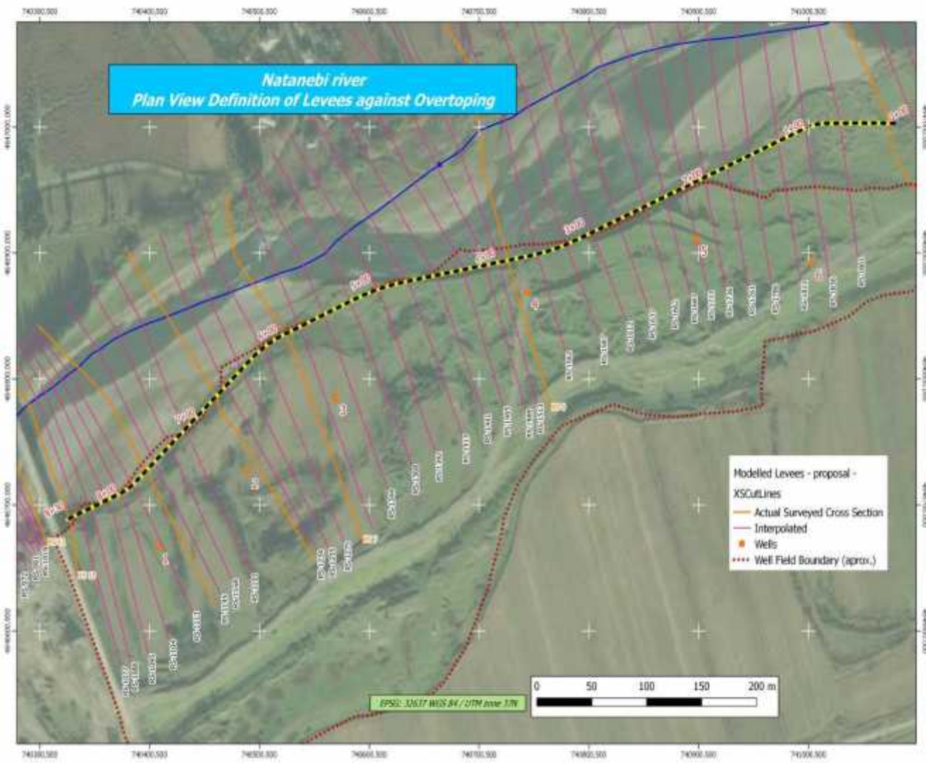
სურ. 1: შემოთავაზებული ჯებირის ხედი