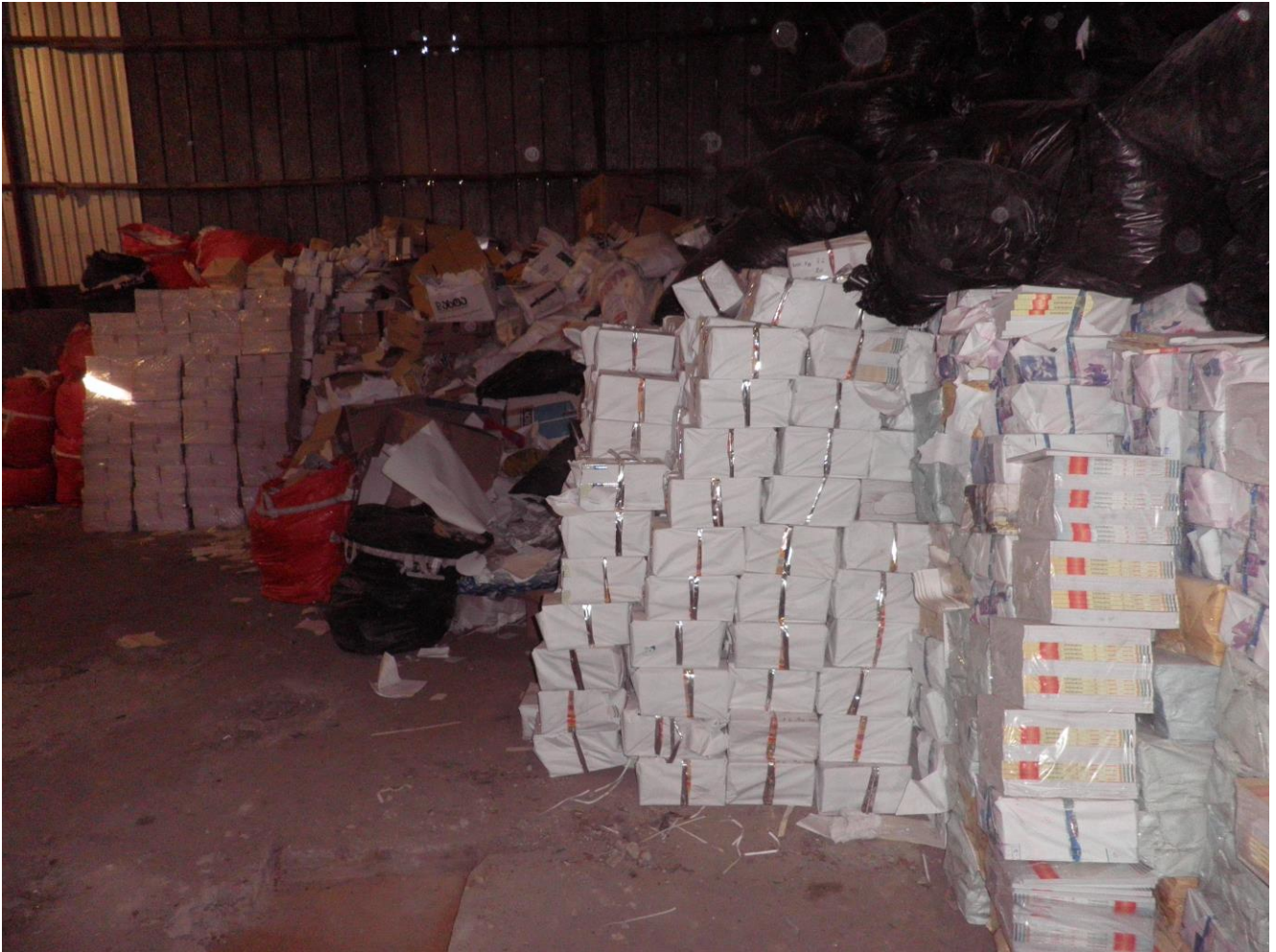
სურათი 2. საწარმოს შენობაში მაკულატურის დასაწყობების ტერიტორია.

საწარმოში შემოტანილი მაკულატურა საწყობდება შენობის შიგნით ერთ მხარეს, რომელიც გამოყოფილი იქნება საწარმოო პროცესებში საჭირო დანადგარებიდან (იხ. სურათი 2).