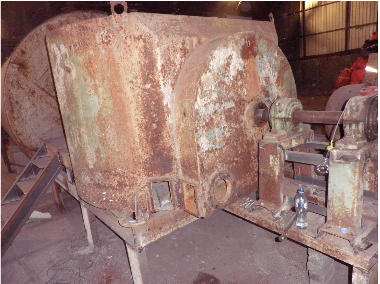
სურათი 3. ქალაღდის ნარჩენების დამაქუცმაცებელი დანადგარი წყალთან ერთად.

დაქუცმაცებული მასა გადადის მეორე რეზერვუარში (იხ. სურათი 4), საიდანაც წყლის წისქვილნასოსის საშუალებით ადის ზემო მესამე რეზერვუარში (იხ. სურათი 5). უკვე საბოლოოდ დაქუცმაცებული მასა ჩამოედინება კაპრონის ბადურაზე, საიდანაც წყალი ჩაედინება სპეციალურ სალექარ რეზერვუარში, რომლის ზომებია 4x2x2. წყალთან ერთად გამყოლ მცირე რაოდენობით დაქუცმაცებული მასა ილექება სალექარ რეზერვუარში (იხ. სურათი 6), რომელიც იწმინდება ყოველ მესამე დღეს. სალექარ რეზერვუარში დარჩენილი სუფთა დალექილი წყლის ჩადინება განხორციელდება ქ. თბილისის საკანალიზაციო ქსელში.