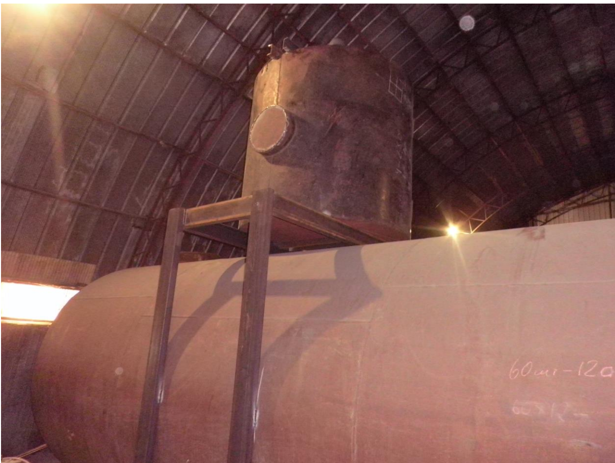
სურათი 5. დაქუცმაცემული ქაღალდნარევის მესამე რეზერვუარი.