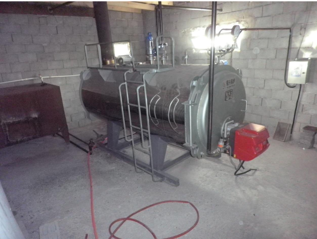
სურათი 9. ორთქლის საქვებუ.