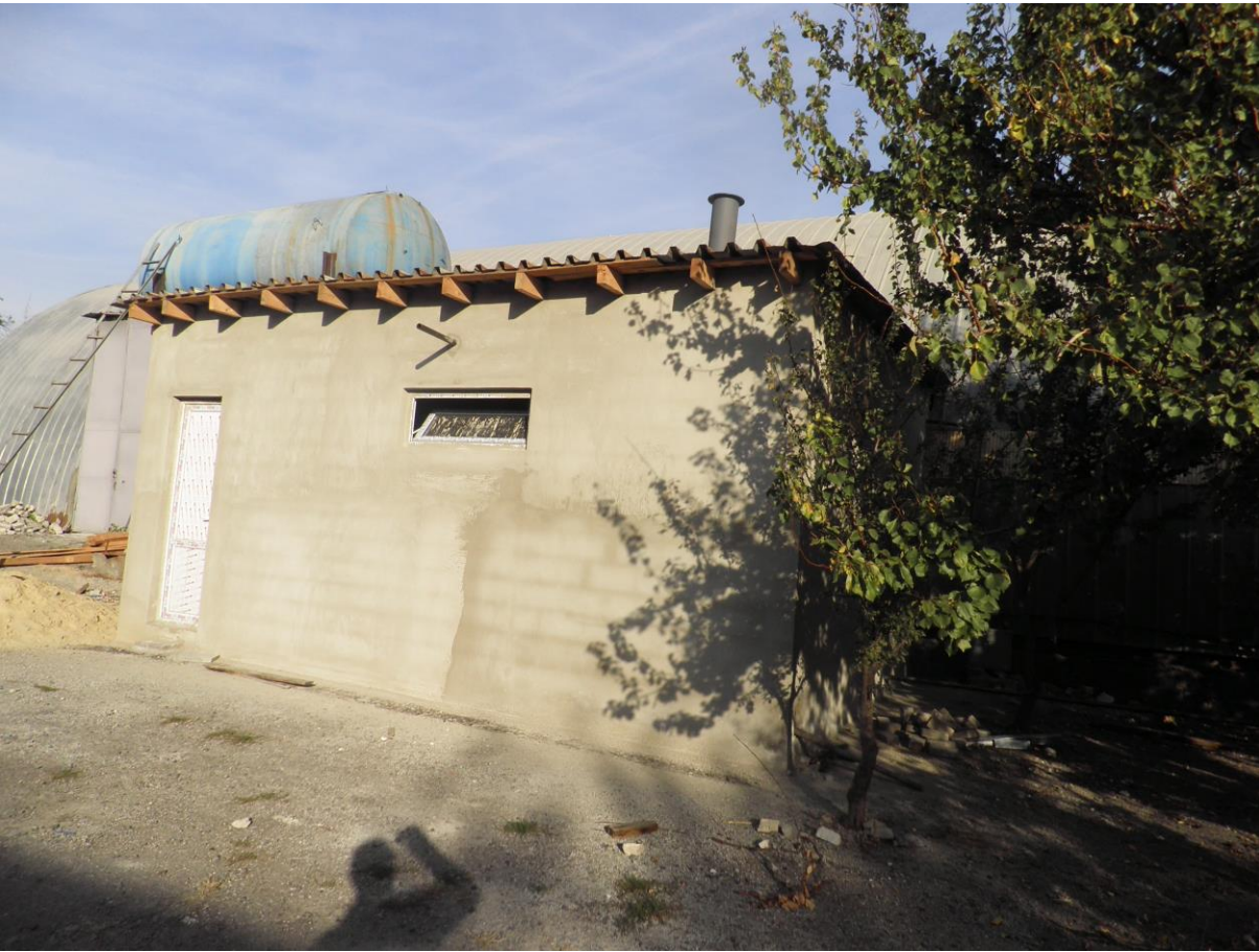
სურათი 8. საქვების შენობა.