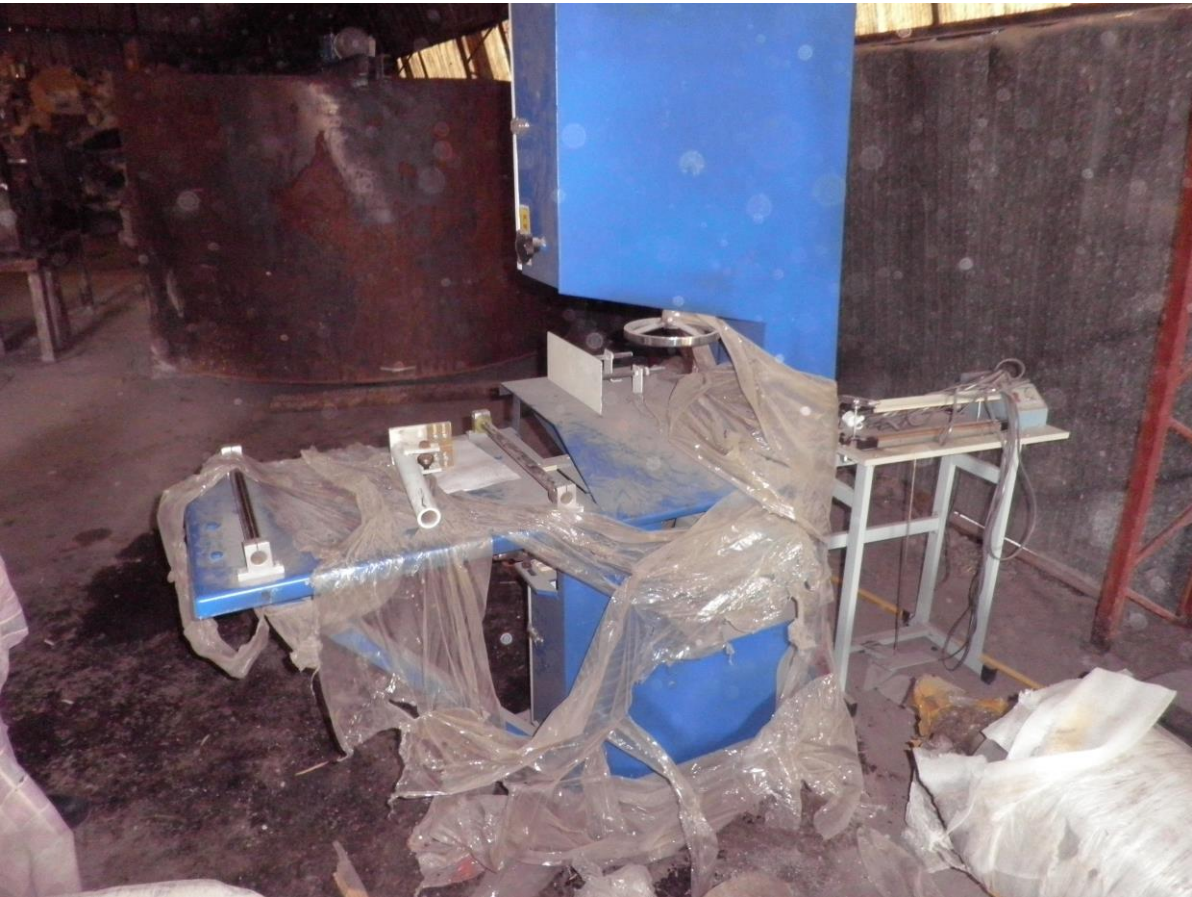
სურათი 7. ქაღალდის რულონების საჭრელი დანადგარი.