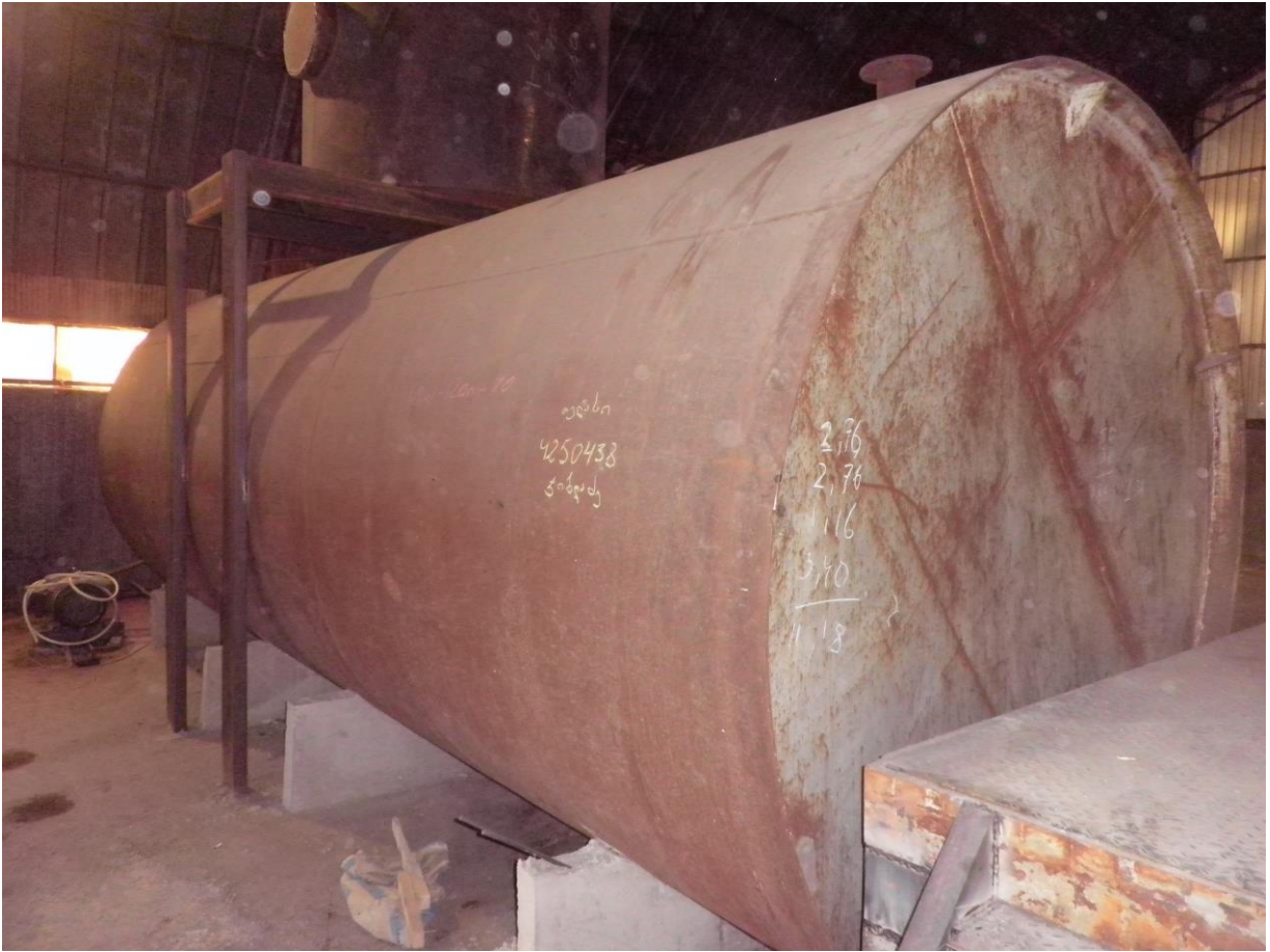
სურათი 4. დაქუცმაცემული ქაღალდნარევის მასის რეზერვუარი.