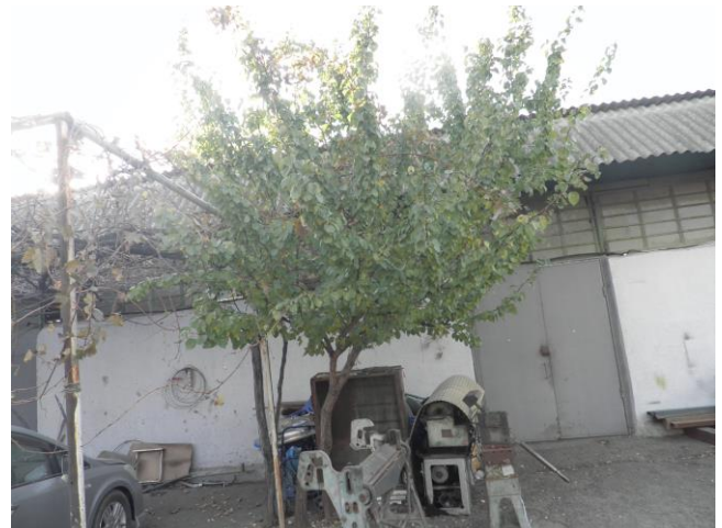
სურათი 5.5.1. ჭერამის ხეები