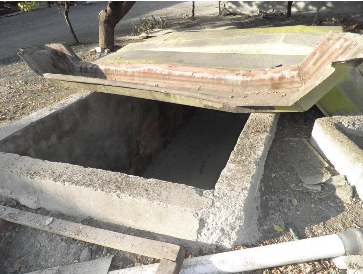
სურათი 6. სალექარი.