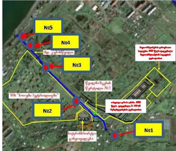
სურათი 3 .მდინარე კუბასწყლის მონიტორინგის წერტილები