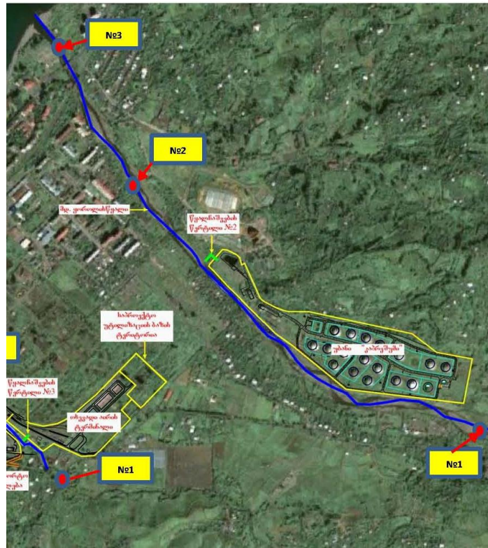
სურათი 4 .მდინარე ვინაისწყლის მონიტორინგის წერტილები