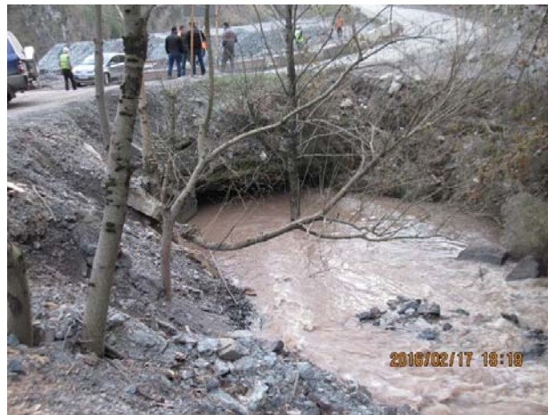
N6 სანაყაროსთან არსებული ხევი