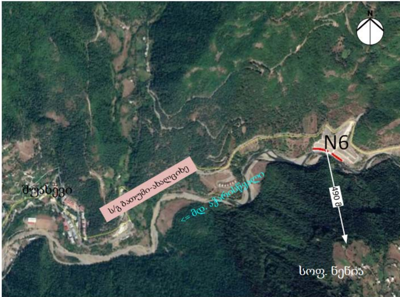
სურათი 2.2.1 N6 ნაპირსამაგრი ნაგებობის განლაგების სიტუაციური სქემა