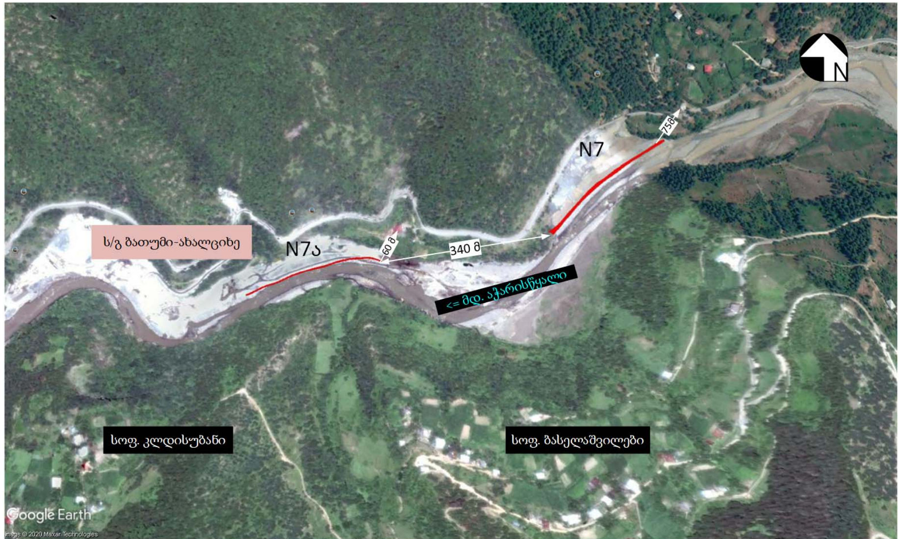
სურათი 2.1.1 N7 და N7ა ნაპირსამაგრი ნაგებობის განლაგების სიტუაციური სქემა