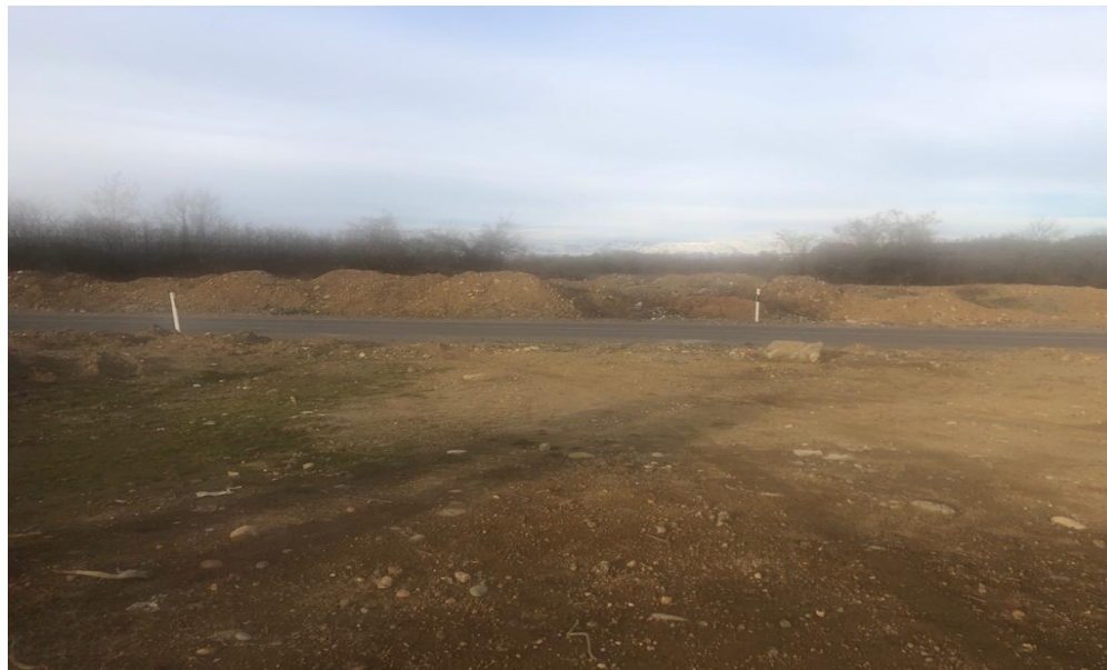
სურ.1 - საწარმოს განთავსების ტერიტორია