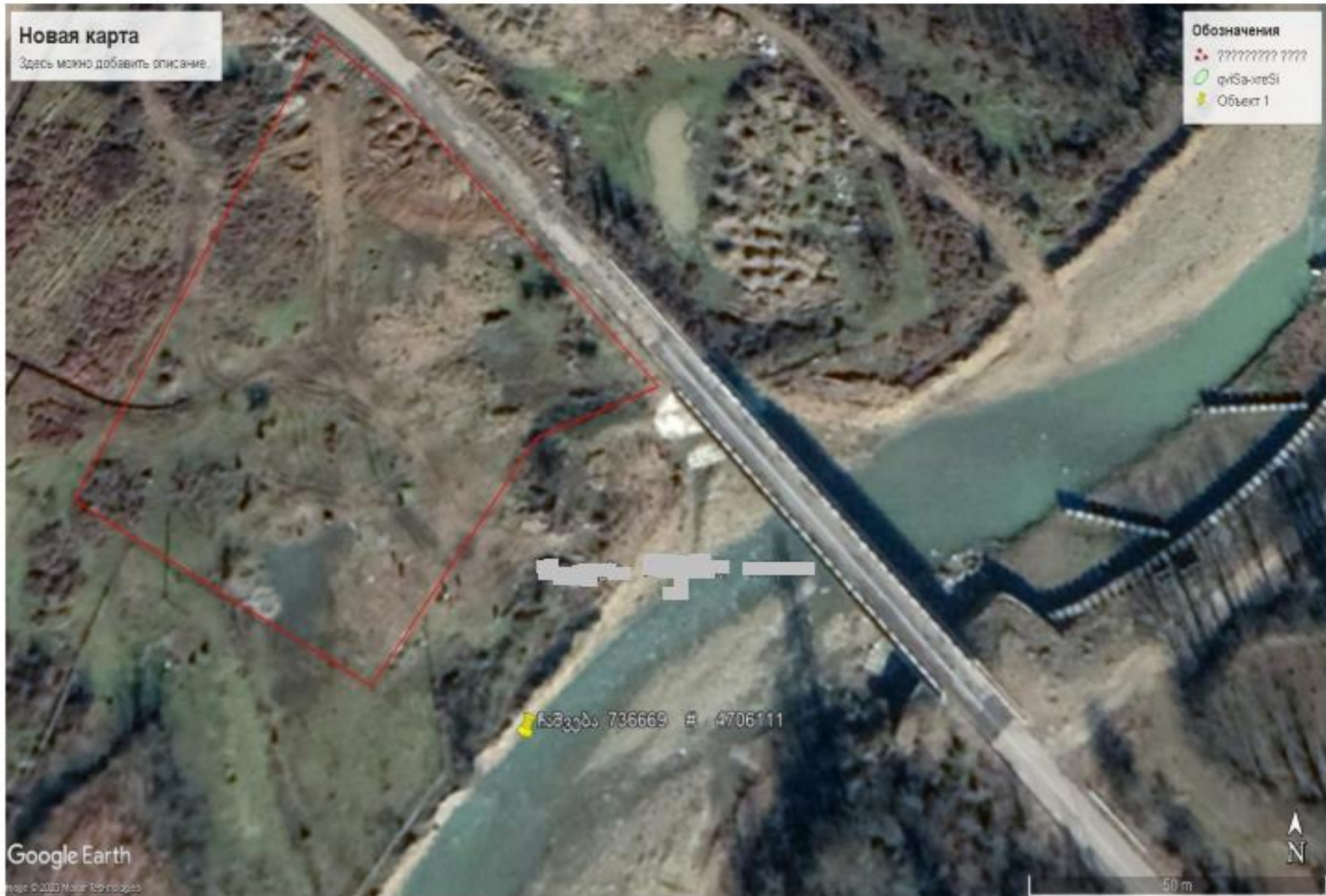
სურ. 3 - სიტუაციური რუკა წყალჩამდების წერტილის მითითებით