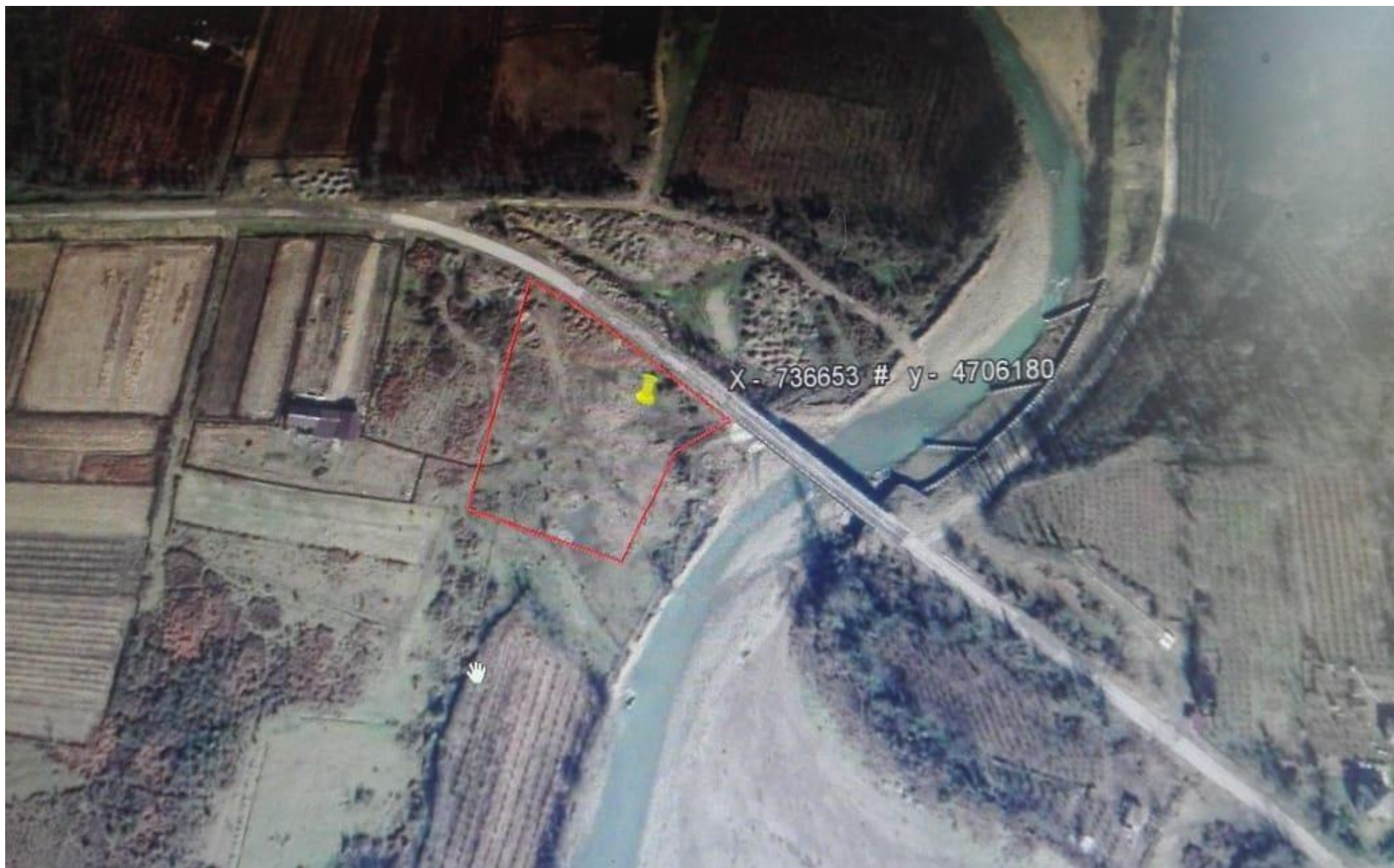
სურ. 2 - საპროექტო ტერიტორიის სიტუაციური რუკა საწარმოს განთავსების ადგილის მითითებით