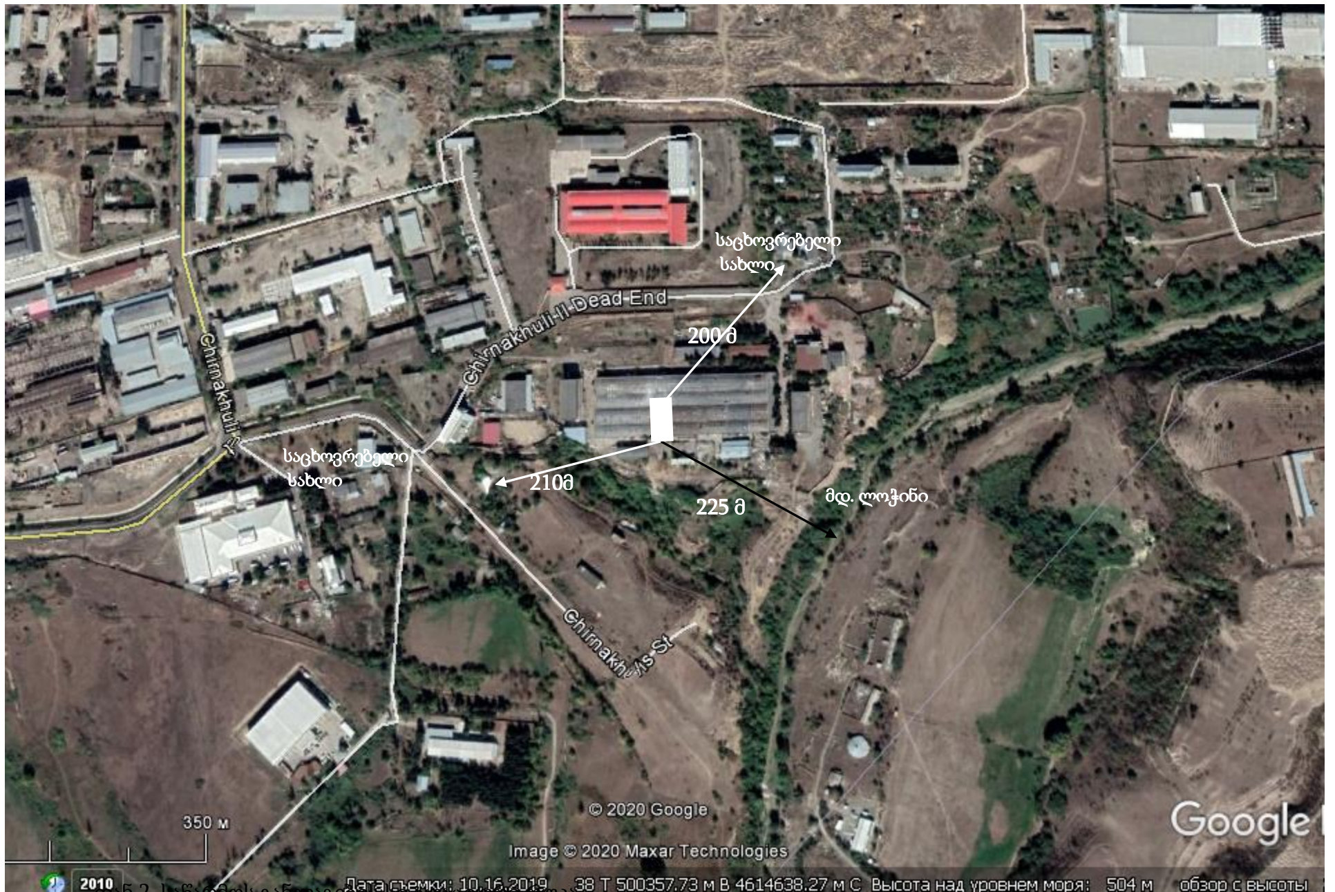
დას.2. საწარმოს განლაგების სიტუაციური რუკა.