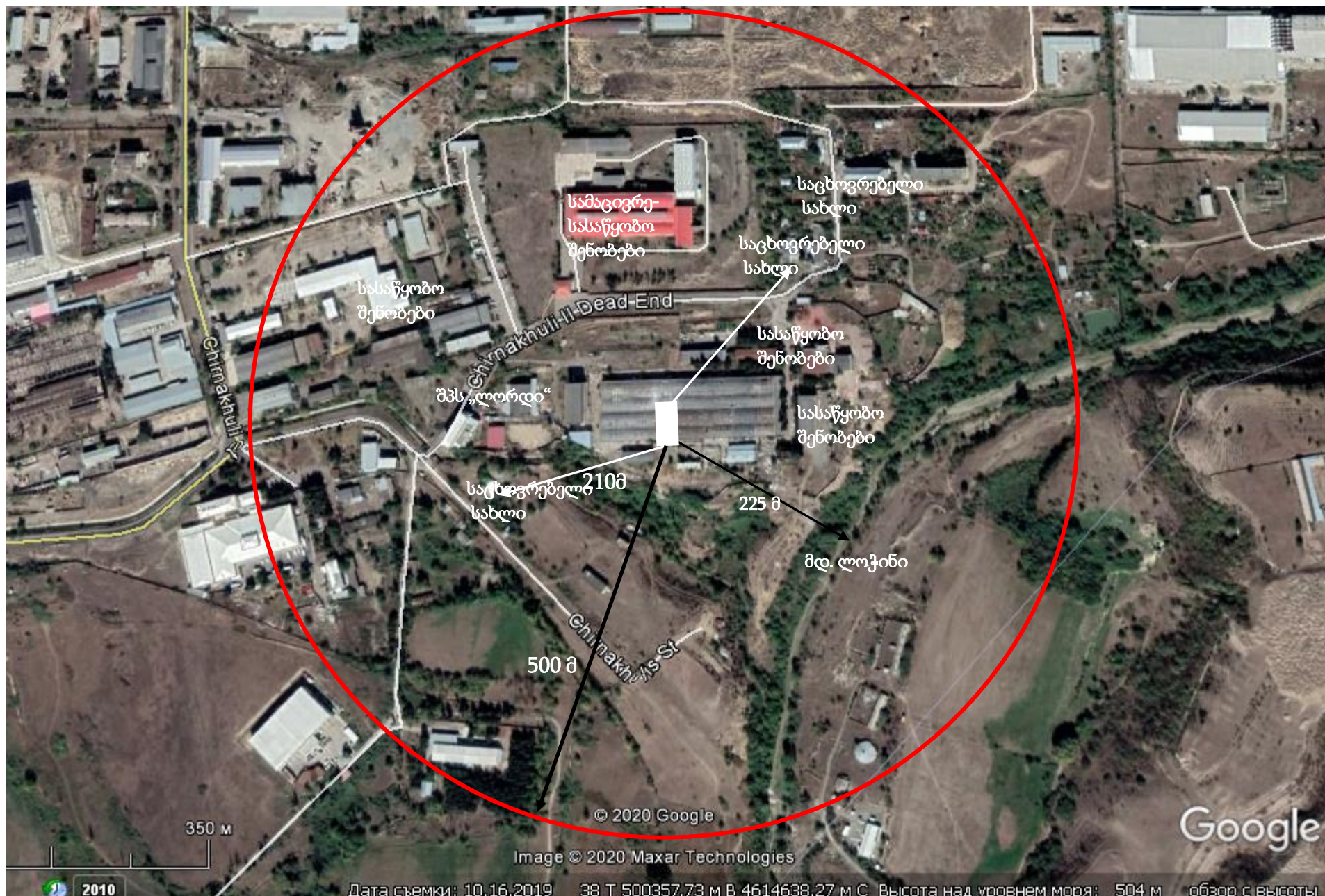
სურათი 2.1.1. სიტუაციური გეგმა