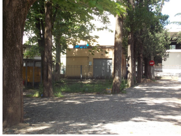
არსებული ინსინერატორის შენობა