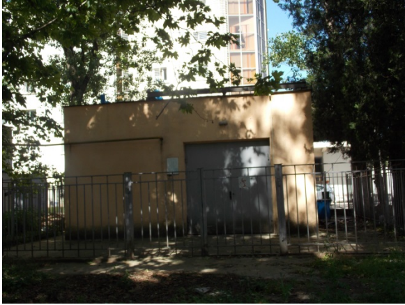
არსებული ინსინერატორის შენობა