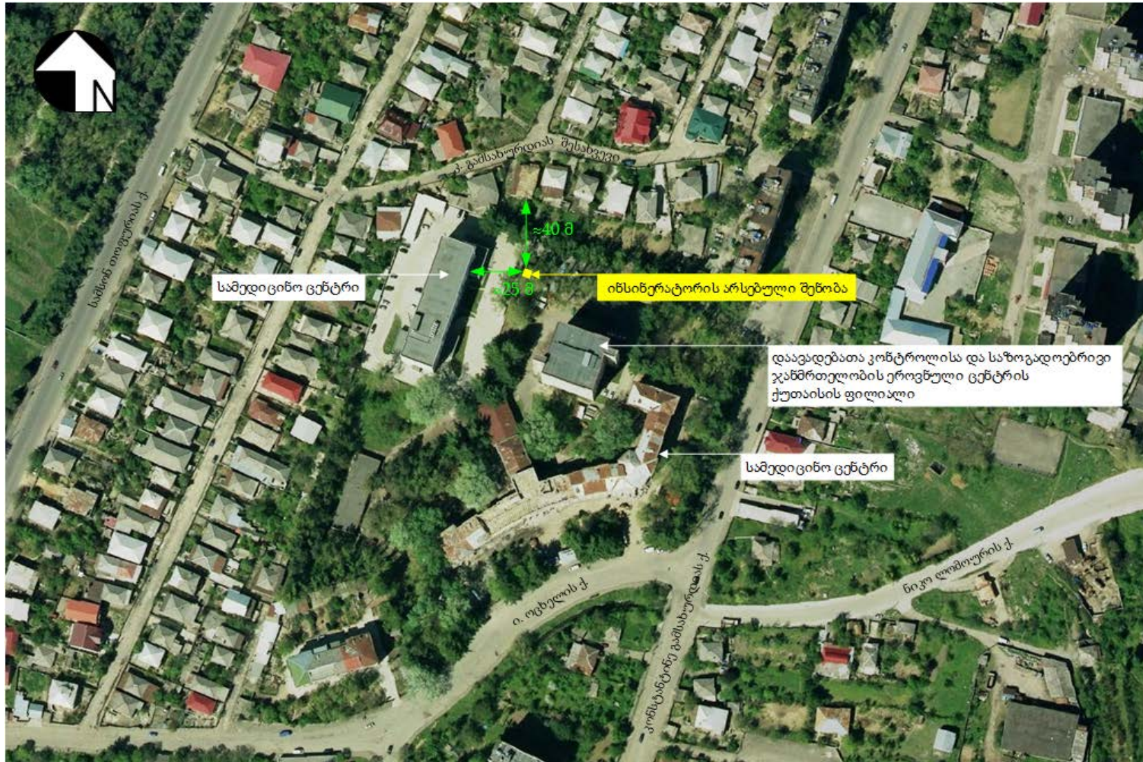
ნახაზი 2.1.2. ტერიტორიის სიტუაციური სქემა