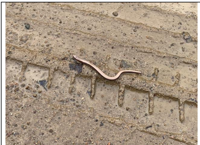
ბოხმეჭა ( Anguis colchica ) (2020 წლის ნოემბერი)

ველზე კვლევასას, შერჩეული ტერიტორიის მოსაზღვრე ლოკაციაზე დაფიქსირებული იქნა მცირე ზომის ბოხმეჭა ( Anguis colchica )