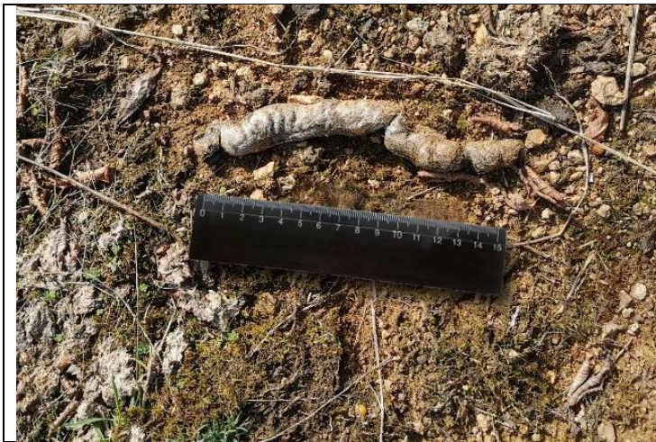
ტურის ( Canis aureus ) ექსკრემენტი (2019 წლის სექტემბერი)