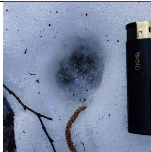
მელიის ( Vulpes vulpes ) კვალი (2020 წლის დეკემბერი)

ველზე კვლევასას, შერჩეული ტერიტორიის მოსაზღვრე ლოკაციაზე დაფიქსირებული იქნა მცირე ზომის ბოხმეჭა ( Anguis colchica )