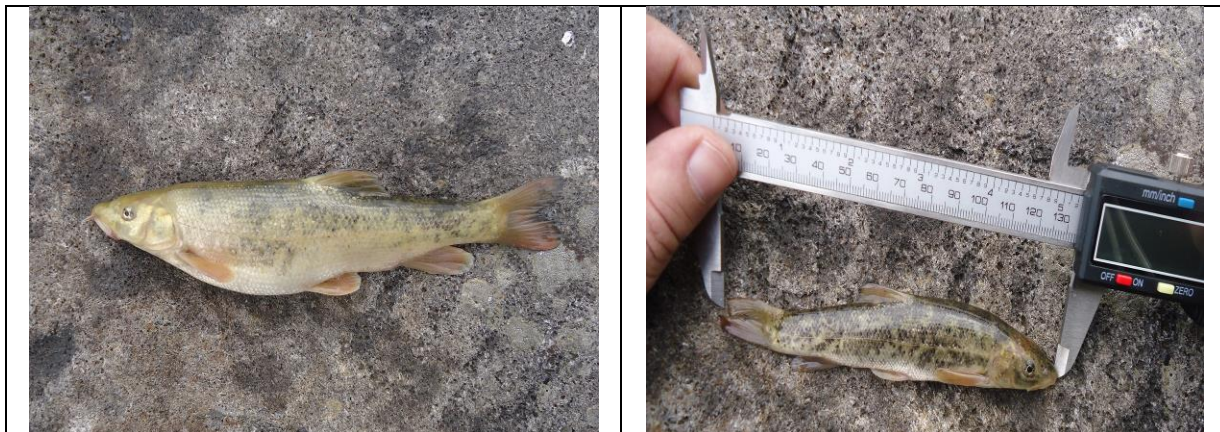
კოლხური წვერა ( Barbus tauricus escherichii )

სქესობრივ სიმწიფეს აღწევს 3 – 4 წლის ასაკიდან. მრავლდება ივნისიდან - აგვისტოს ბოლომდე. ქვირითს ყრის მდინარის თხელწყლიან, ქვა-ქვიშიან ადგილებში, წყლის 12 – 18 °C ტემპერატურის დროს, 2 000 – 30 000 ცალამდე. ქვირითის დიამეტრი შეადგენს 2,5 მმ-ს, გამრავლებისას ჭარბობენ მამლები. ქვირითიდან ლიფსიტები იჩეკებიან ერთი კვირის განმავლობაში.