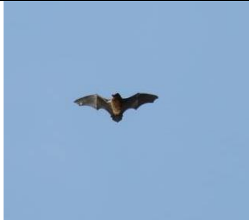
წითური მელამურა ( Nictalus nictula )