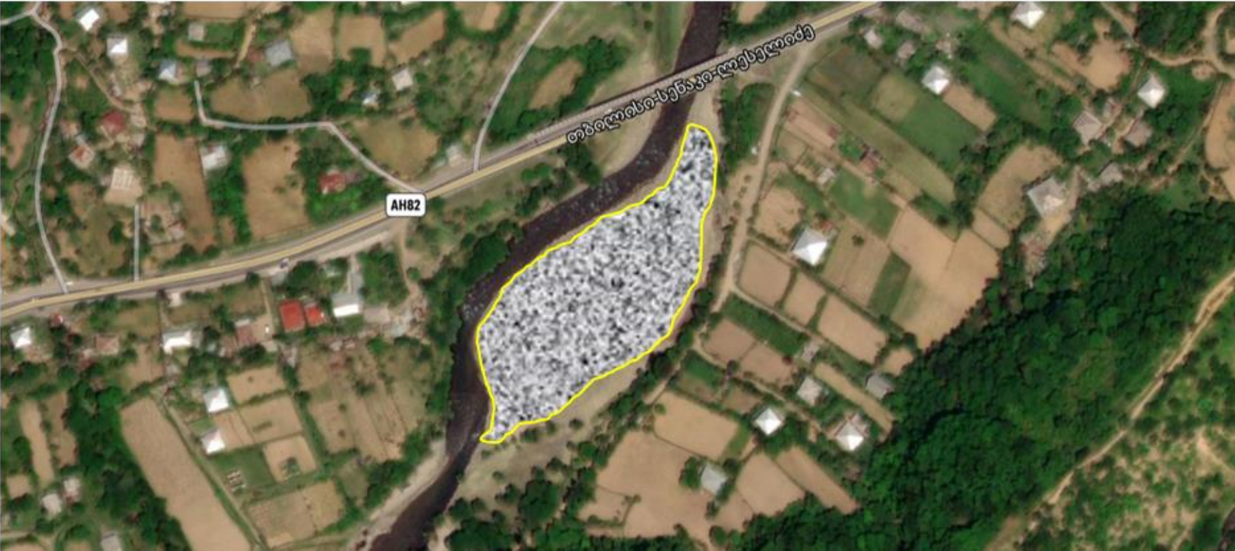
ნახაზი 1: სანაყროს ადგილმდებარეობა