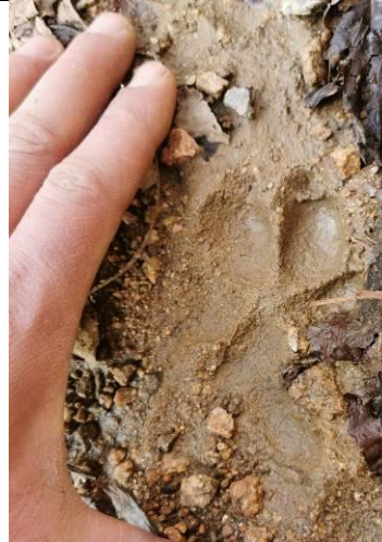
რუხი მგლის ( Canis lupus ) კვალი (2019 წლის სექტემბერი)