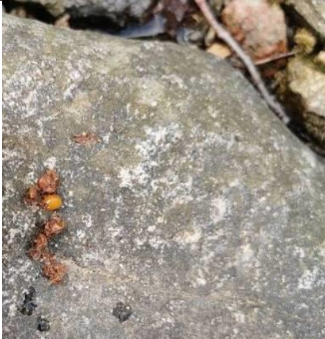
დედოფალას (სინდიოფალა) ( Mistela nivalis ) ექსკრემენტი (2019 წლის სექტემბერი)