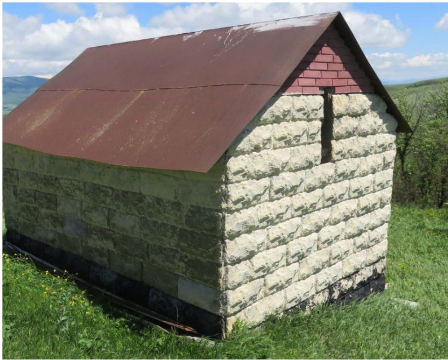
სურ. NN108-111. სალოცავი