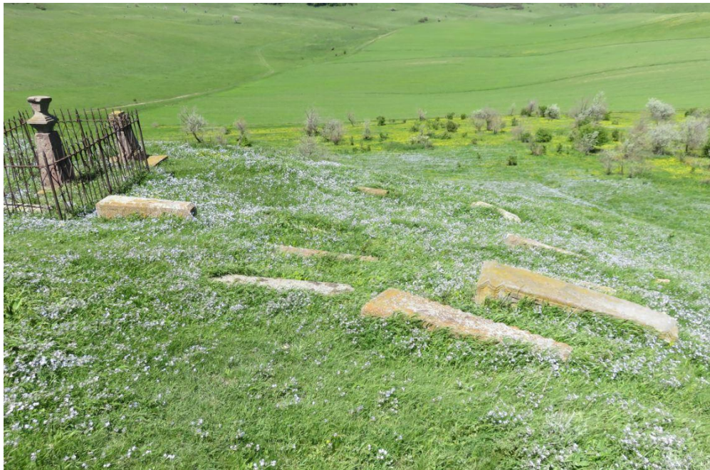
სურ. NN116-117. სამაროვანი ნიგოზას წმ. გიორგის ეკლესიის მიმდებარედ (არქივის მიხედვით, სოფ. ნიგოზას ნასოფლარი (22813) უნდა ყოფილიყო)