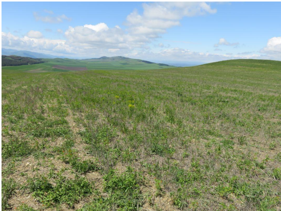
სურ. NN76-81. ტერიტორია, სადაც უნდა მოეწყოს სანაყარო