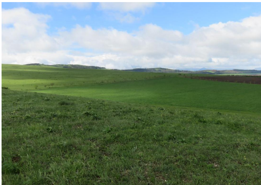
სურ. NN62-65. მე-16 ანბის მიმდებარე ტერიტორია