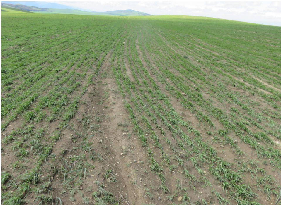
სურ. NN14-17. მე-4 ანბის მიმდებარე ტერიტორია