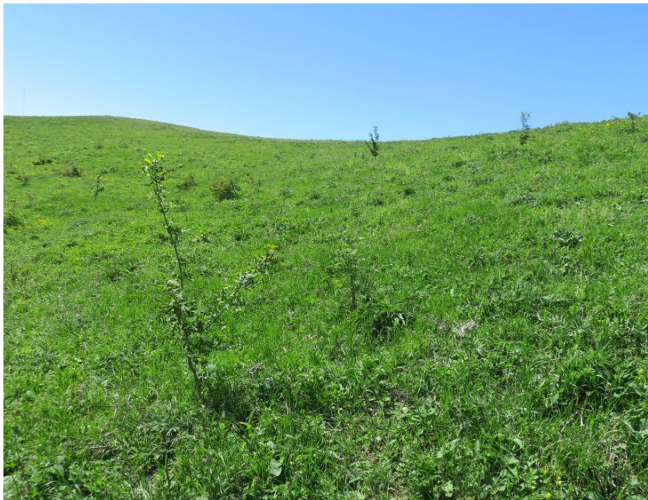
სურ. NN122-125. ადგილი, სადაც არქივის მიხედვით, სოფ. ნიგოზას სამაროვანი (22815) უნდა ყოფილიყო