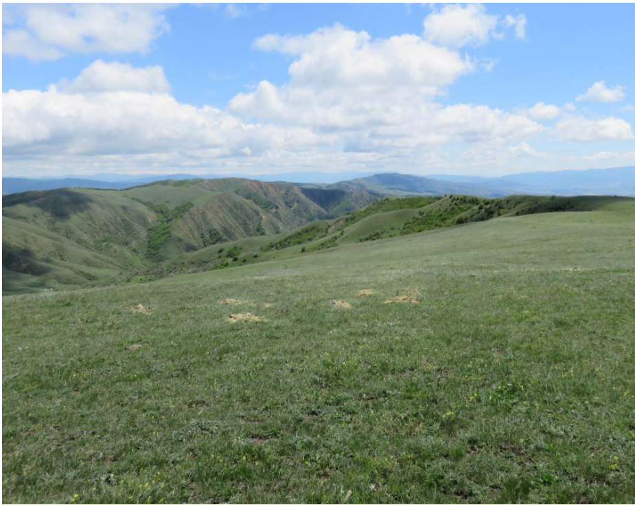
სურ. NN22-25. მე-6 ანძის მიმდებარე ტერიტორია