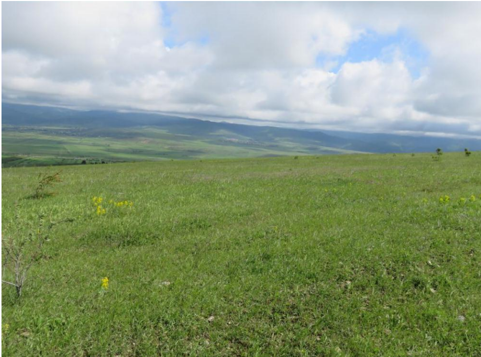
სურ. NN54-57. მე-14 ანძის მიმდებარე ტერიტორია