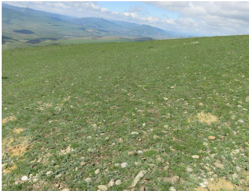
სურ. NN42-45. მე-11 ანძის მიმდებარე ტერიტორია