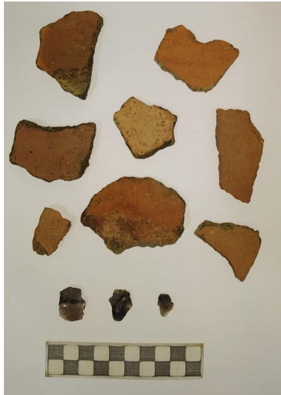
სურ. NN132-133. მე-9 ანძის განთავსების ადგილის მახლობლად გამოვლენილი ანაკრეფი კერამიკული მასალა და ობსიდიანის ფრაგმენტები ველზე (ზემოთ) და პირველადი დამუშავების შემდგომ (ქვემოთ)