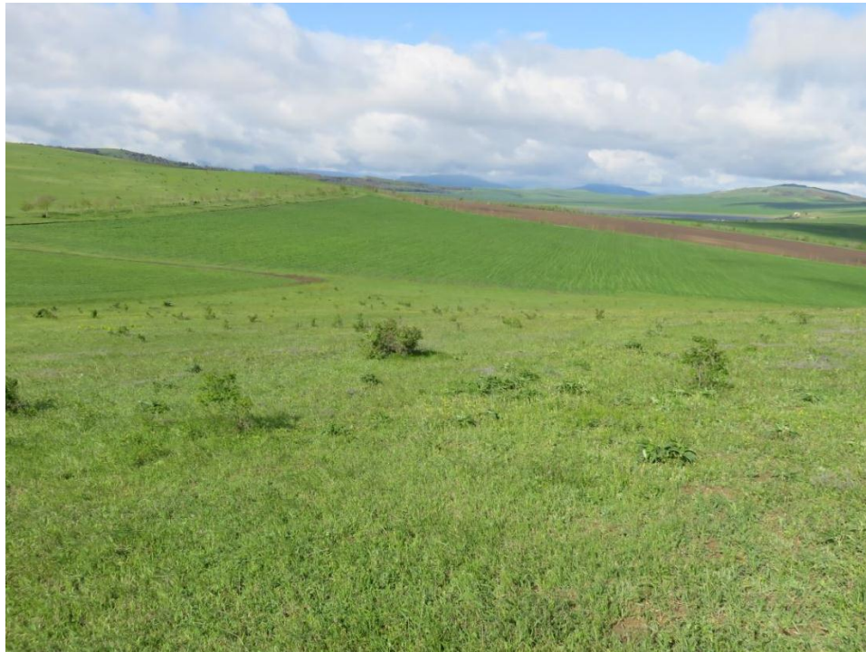
სურ. NN66-71. ტერიტორია, სადაც უნდა მოეწყოს სამშენებლო ზანაკი