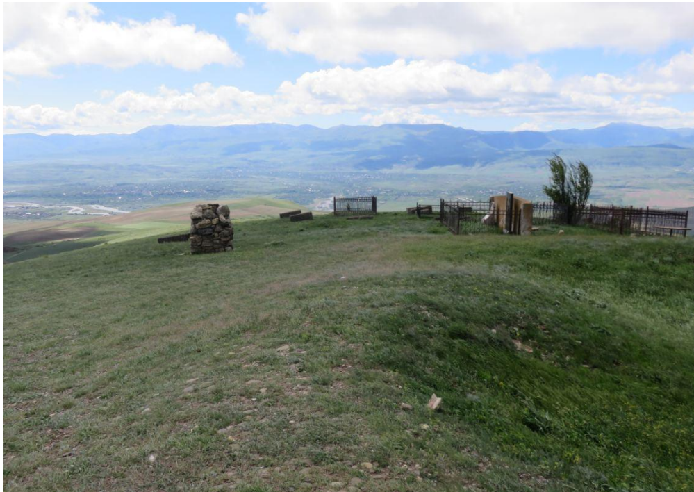
სურ. NN98-103. ზეგარდის წმ. გიორგის ეკლესია