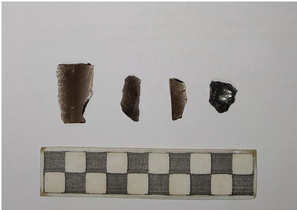
სურ. NN134-135. მე-4 ანძის განთავსების ადგილის მახლობლად გამოვლენილი ანაკრეფი ობსიდიანის ფრაგმენტები ველზე (ზემოთ) და პირველადი დამუშავების შემდგომ (ქვემოთ)