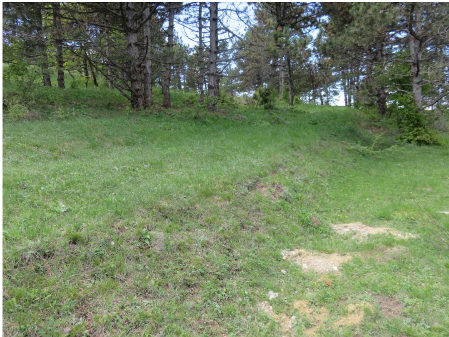
სურ. NN26-29. მე-7 ანძის მიმდებარე ტერიტორია