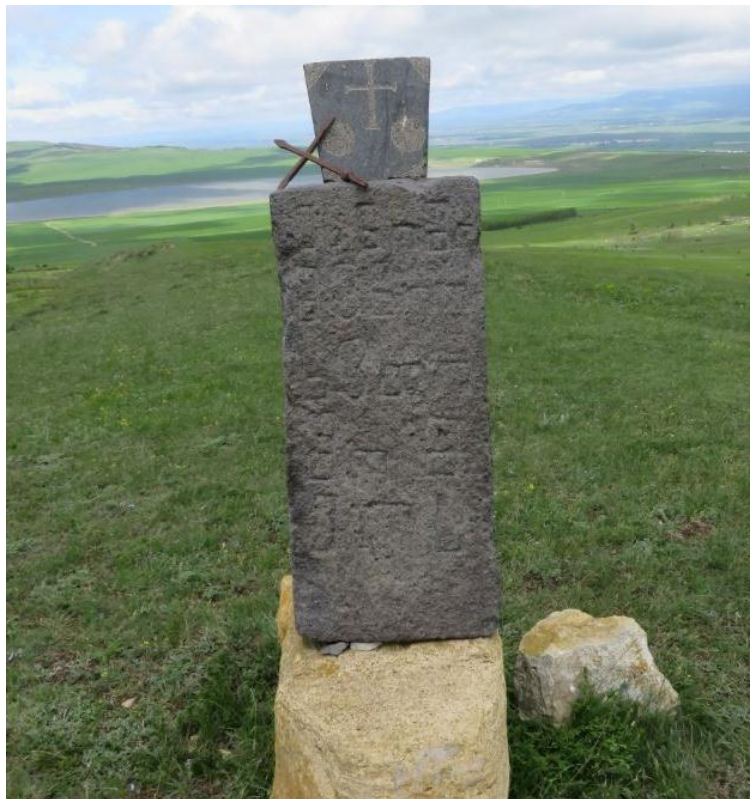
სურ. NN126-129. დარბაზული ეკლესიის ჩრდილო-აღმოსავლეთით დაფიქსირებული ქვების კონსტრუქცია - „წრე“ (სასამართლო)