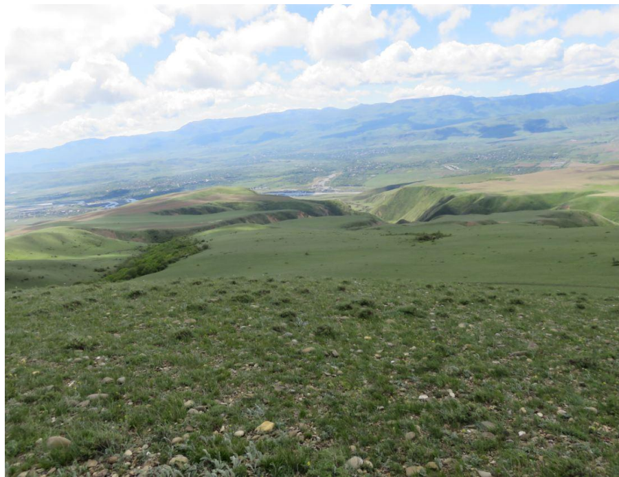
სურ. NN38-41. მე-10 ანძის მიმდებარე ტერიტორია