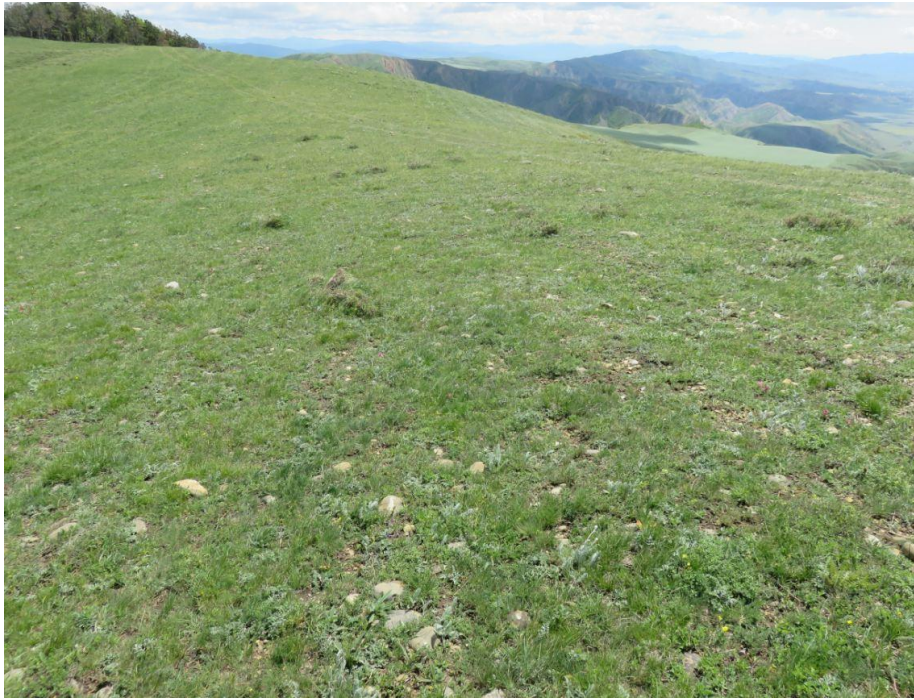
სურ. NN30-33. მე-8 ანძის მიმდებარე ტერიტორია