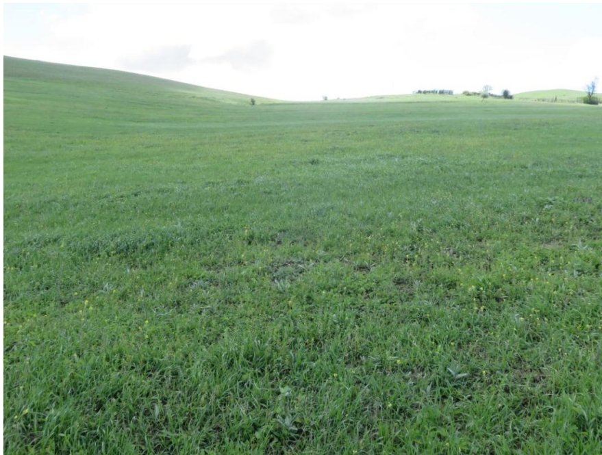
სურ. NN46-49. მე-12 ანბის მიმდებარე ტერიტორია