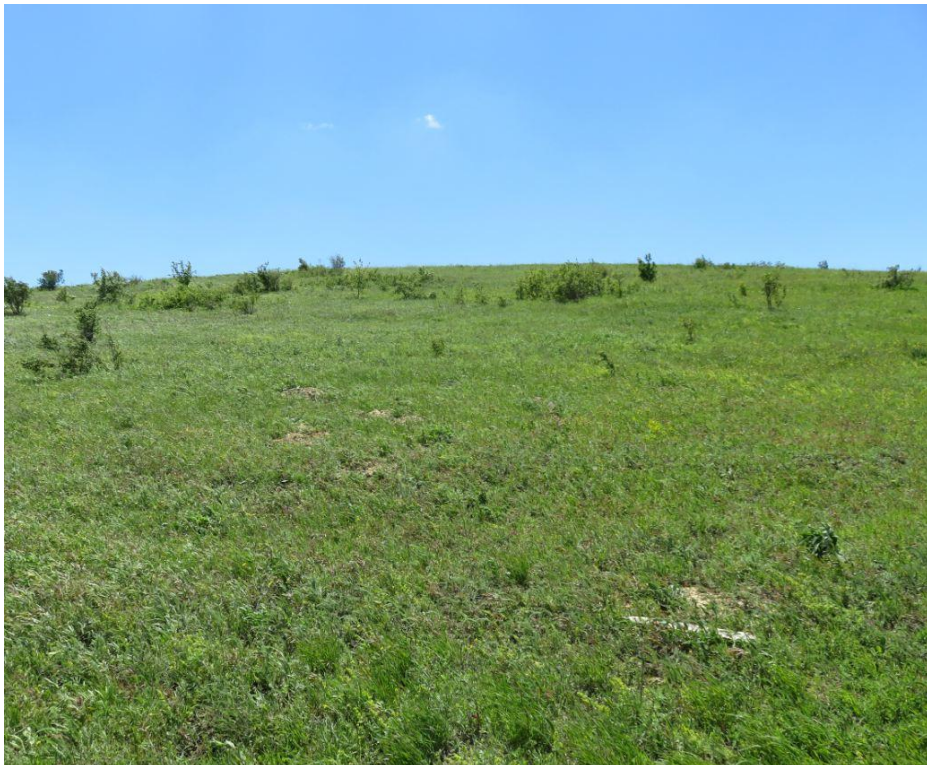
სურ. NN6-9. მე-2 ანბის მიმდებარე ტერიტორია