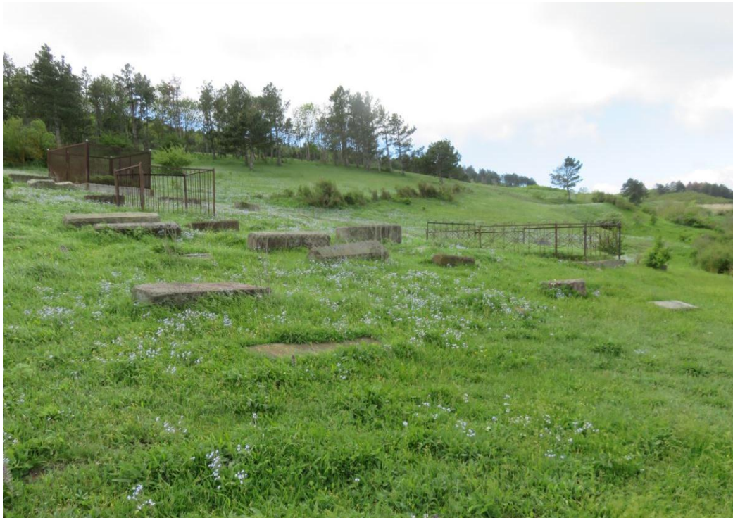
სურ. NN92-97. დარბაზული ეკლესია (წმ. გიორგი) სასაფლაოთი