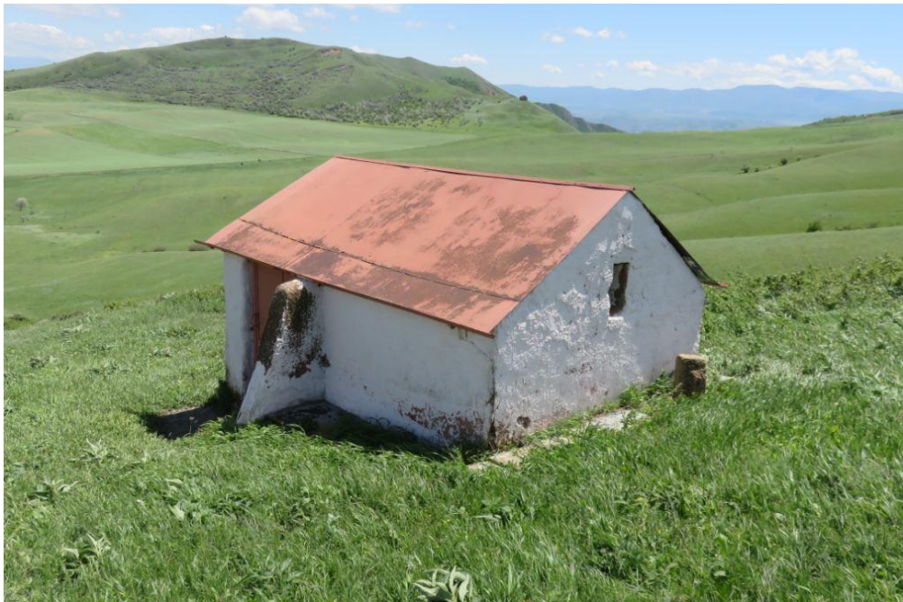
სურ. NN104-107. წმ. გიორგის სალოცავი