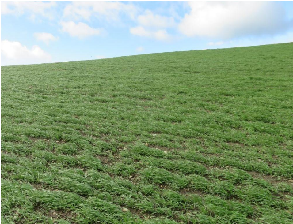
სურ. NN2-5. 1-ლი ანბის მიმდებარე ტერიტორია