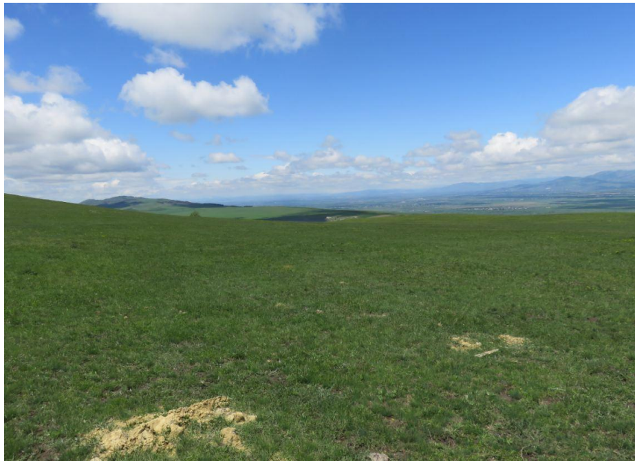
სურ. NN18-21. მე-5 ანბის მიმდებარე ტერიტორია