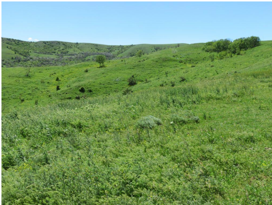
სურ. NN118-121. ადგილი, სადაც არქივის მიხედვით, სოფ. ნიგოზას ნამოსახლარი (22812) უნდა ყოფილიყო