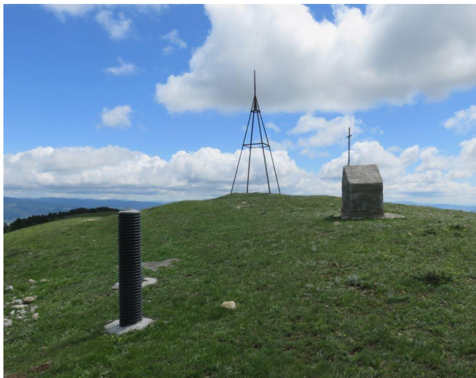
სურ. NN130-131. მე-9 ანძის განთავსების ადგილის მახლობლად მოწყობილი სალოცავი ნიში