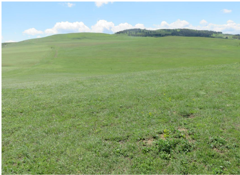
სურ. NN72-75. ტერიტორია, სადაც უნდა განთავსდეს ქვესადგური