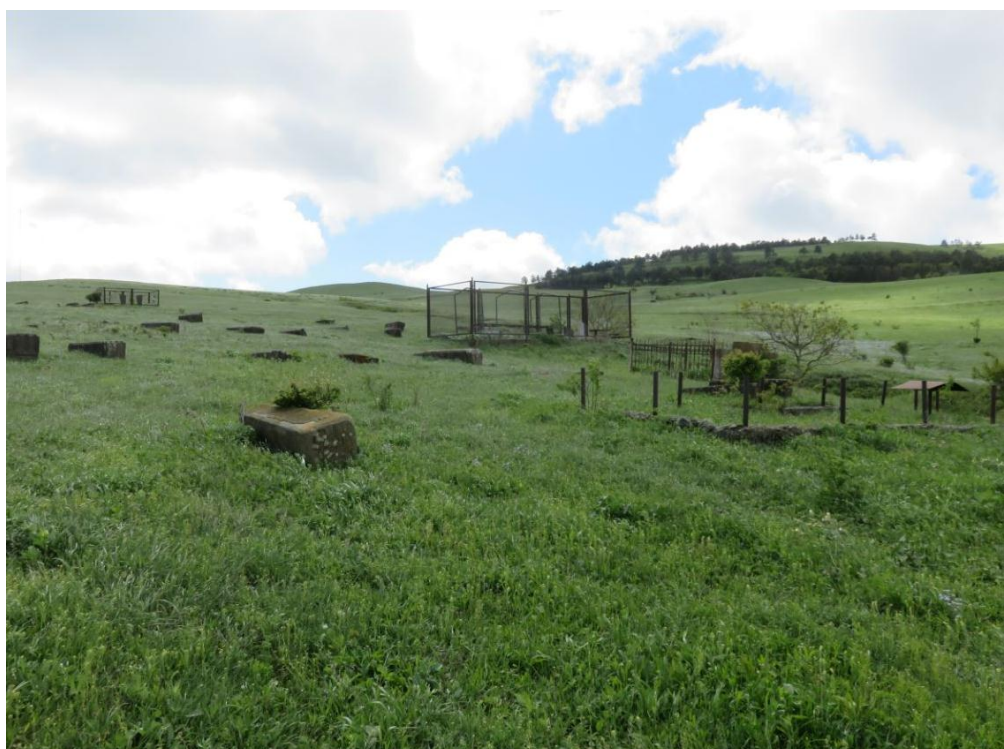
სურ. NN84-85. თანამედროვე სასაფლაო 2