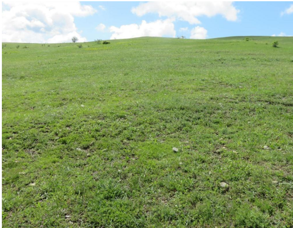
სურ. NN50-53. მე-13 ანძის მიმდებარე ტერიტორია