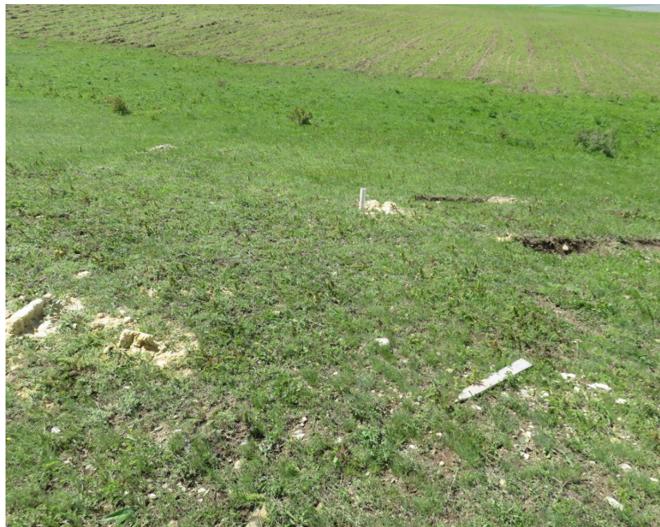
სურ. NN10-13. მე-3 ანძის მიმდებარე ტერიტორია