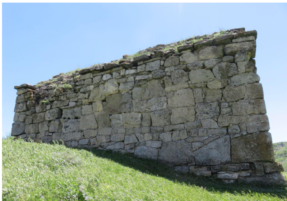
სურ. NN112-115. ნიგოზას წმ. გიორგის ეკლესია