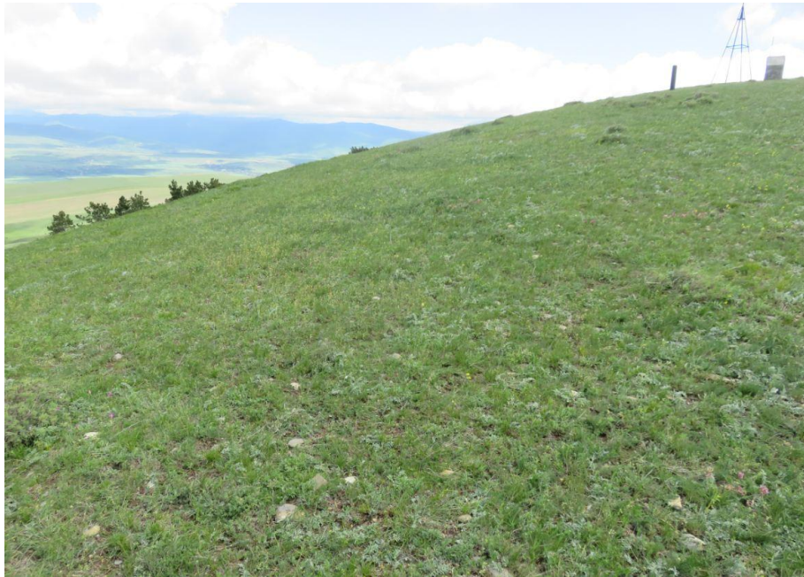
სურ. NN34-37. მე-9 ანძის მიმდებარე ტერიტორია