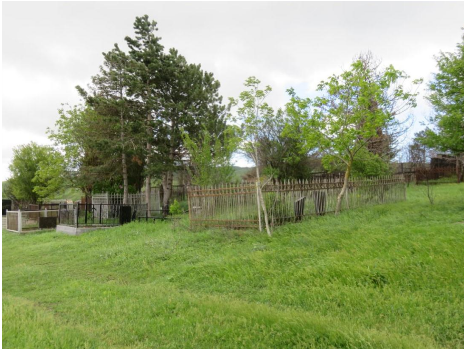
სურ. NN82-83. თანამედროვე სასაფლაო 1