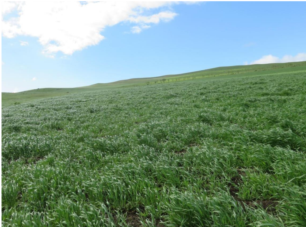
სურ. NN86-91. ადგილი, სადაც არქივის მიხედვით, სოფ. ნიგოზას სამაროვანი (22816) უნდა ყოფილიყო