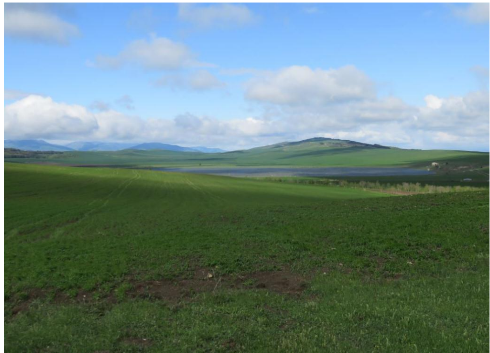
სურ. NN58-61. მე-15 ანძის მიმდებარე ტერიტორია