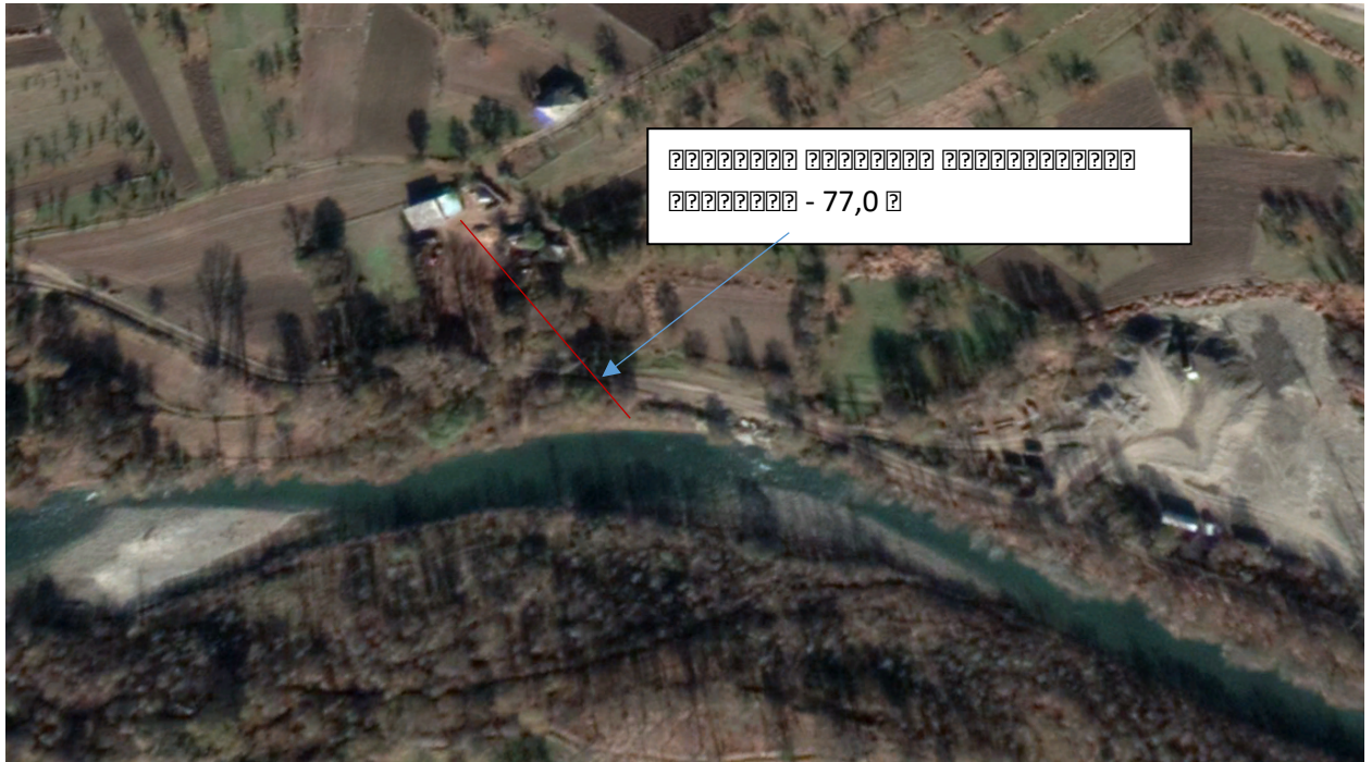
ნახ.1 საპროექტო უბნის დაშორება აუხლოესი საცხოვრებელი სახლიდან

დაგეგმილი საქმიანობის გახორციელების ადგილი არ არის სიახლოვეს: